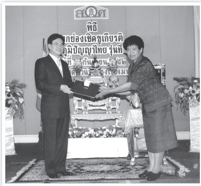
รับประกาศนียบัตร และเช็มเชิดชูเกียรติ ครูภูมิปัญญาไทย รุ่นที่ ๖ จากสำนักงานเลขาธิการสภาการศึกษา