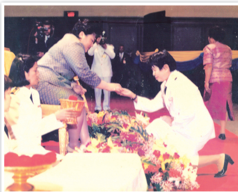
พระเจ้าวรวงศ์เธอ พระองค์เจ้าโสมสวลี พระวรราชทินนิตตามาตุ พระราชทานเข็มเชิดชูเกียรติ