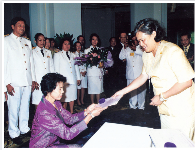
สมเด็จพระเทพรัตนราชสุดาฯ สยามบรมราชกุมารี พระราชทานประกาศนียบัตร และเข็มที่ระลึก ผู้ปฏิบัติงานชนะเลิศ ๒๕๔๘