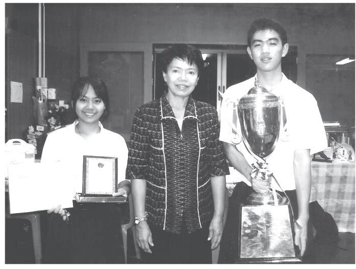
ถ่ายภาพกับศิษย์