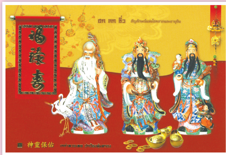
รูป ฮก ลก ซิว ในบัตร ส.ค.ส. ปีใหม่ ของ GRACE GREETING CO., LTD.

ถาม ได้อ่านคอลัมน์ ถามมา - ตอบไป เรื่องถนนและสะพานที่ชื่อพระรามแล้ว ได้พบชื่อถนนโบราณที่เป็นภาษาจีน เช่น ถนนลก ในแผนที่ที่ลงประกอบก็มี เคยได้ทราบว่ามีอยู่หลายชื่ออยากทราบว่าชื่ออะไรบ้าง ปัจจุบันคือถนนอะไร