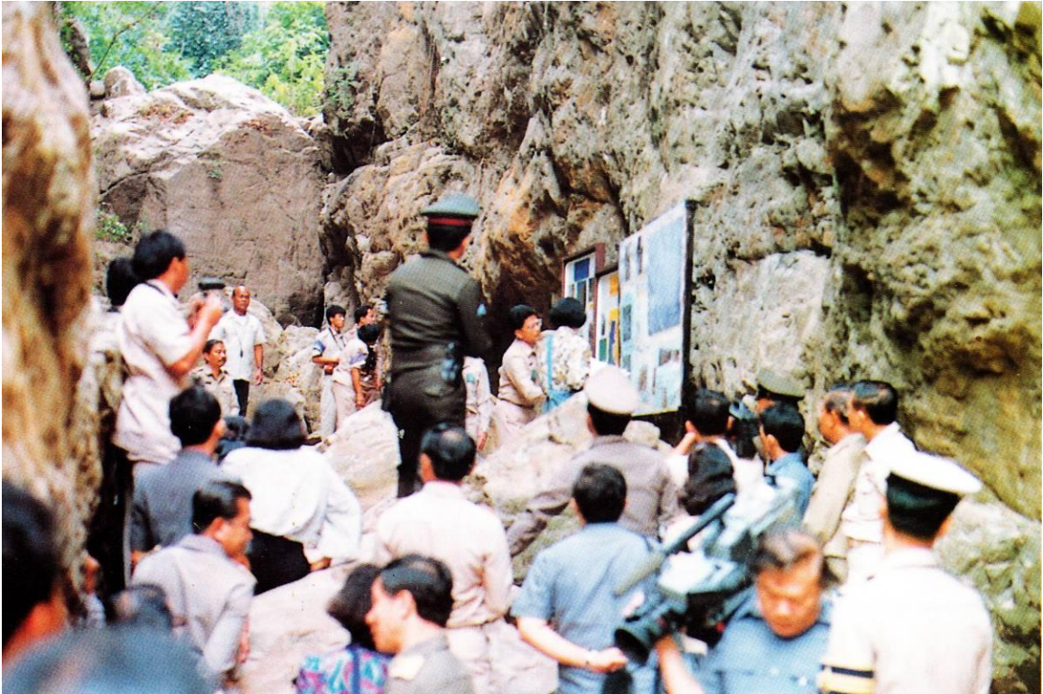
สมเด็จพระเทพรัตนราชสุดาฯ สยามบรมราชกุมารี ทรงฟังบรรยายสรุป และทอดพระเนตรแผนที่ แผนที่ แสดงถึงแหล่งต้นน้ำ บริเวณโขกพระร่วงลงพระขรรค์ เมื่อวันที่ ๑๙ กุมภาพันธ์ พุทธศักราช ๒๕๓๔