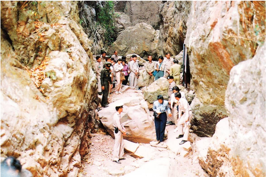
สมเด็จพระเทพรัตนราชสุดาฯ สยามบรมราชกุมารี ทรงฟังบรรยายสรุป และทอดพระเนตรแผนที่ แผนที่ แสดงถึงแหล่งต้นน้ำ บริเวณโขกพระร่วงลงพระขรรค์