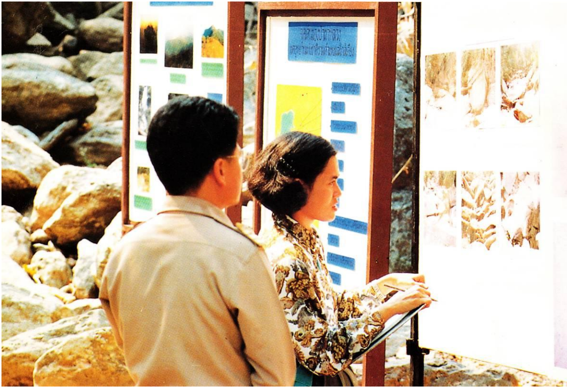
สมเด็จพระเทพรัตนราชสุดาฯ สยามบรมราชกุมารี ทรงฟังบรรยายสรุป และทอดพระเนตรแผนผัง ภาพถ่ายเกาะแก่งหินของโซภพระแม่ย่า (เหมืองยายอึ่ง)