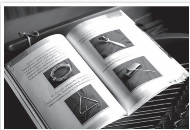
หนังสือ “ก่อนจะมาเป็นเพลง”