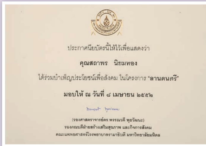
โล่รางวัลและประกาศนียบัตร ที่ได้รับจากการให้ความร่วมมือ สนับสนุนกิจกรรมทางการศึกษาและสังคม