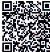
สิ่งที่ส่งมาด้วย ๓