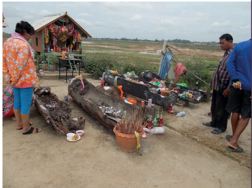
รูปโลงไม้โบราณที่พบในแหล่งโบราณคดีบึงตะเคิ่ง ตำบลบางระกำ อำเภอบางระกำ จังหวัดพิษณุโลก

๓. ยิ่งขาดการศึกษาด้านพันธุกรรมของคนโบราณ (DNA) ซึ่งหากทำการศึกษได้จะทำให้เราสามารถได้ข้อมูลด้านประชากรมนุษย์โบราณในพื้นที่ลุ่มน้ำยม - น่าน มากยิ่งขึ้น และสามารถอธิบายปรากฏการณ์ทางวัฒนธรรมของผู้คนสมัยโบราณที่อาจเชื่อมโยงกับการตั้งถิ่นฐานของผู้คนในปัจจุบัน