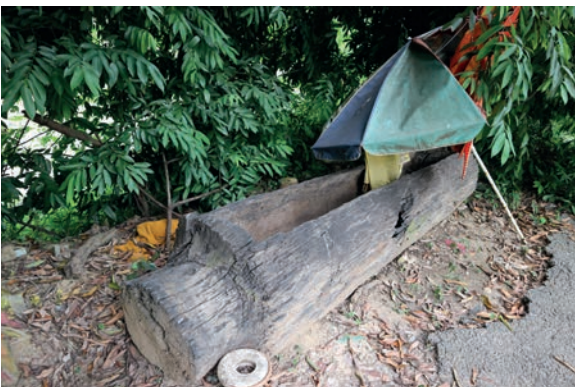
รูปโลงไม้โบราณที่พบในแหล่งโบราณคดีบ้านคลองเตย ตำบลบึงกอก อำเภอบางระกำ จังหวัดพิษณุโลก