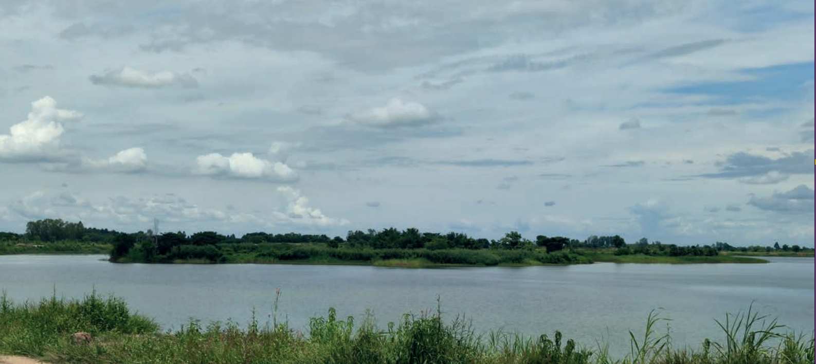
สภาพปัจจุบันของบึงตะเคิ่ง มีลักษณะเป็นบึงรองรับน้ำขนาดใหญ่

เพื่อให้ได้หลักฐานที่ถูกต้องมากที่สุด เช่น การขุดค้นแหล่งโบราณคดีถ้าผีแมนโลงลงรักของคณะวิจัยในพื้นที่อำเภอปางมะผ้า จังหวัดแม่ฮ่องสอน ยังต้องใช้ระยะเวลานาน ๓ ปี (พ.ศ. ๒๕๕๖ - ๒๕๕๙)