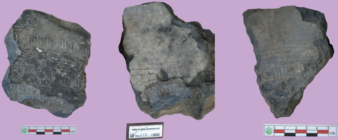
ชิ้นส่วนแม่พิมพ์กลองมโหระทึก แหล่งโบราณคดีโนนหนองหอย

ผลการขุดค้น รวมทั้งการขุดกู้โบราณวัตถุและการสำรวจพบว่า แหล่งโบราณคดีโนนหนองหอยเป็นชุมชนหมู่บ้านเกษตรกรรม มีการอยู่อาศัยของมนุษย์ในยุคก่อนประวัติศาสตร์ สมัยเหล็ก เมื่อราว ๒,๑๐๐ ปีมาแล้ว หลักฐานการอยู่อาศัยของมนุษย์ มีการผลิตภาชนะดินเผา ทอผ้า มีประเพณีการฝังศพมนุษย์แบบวางศพนอนหงายเหยียดยาว และบรรจุในภาชนะดินเผา มีการติดต่อสัมพันธ์กับชุมชนภายนอก มีความรู้ความชำนาญในงานโลหะกรรม ผลิตเครื่องมือเครื่องใช้โลหะ โดยในการขุดค้นพบเศษก้อนแร่ ชีแร่ ชิ้นส่วนเข้าหลอมโลหะดินเผาขนาดใหญ่ แท่งดินเผาไฟ ก้อนดินเผาไฟ รวมทั้งก้อนโลหะทองแดง? สำหรับนำมาหลอมเป็นเครื่องมือเครื่องใช้สำริด มีลักษณะด้านหนึ่งเรียบ อีกด้านหนึ่งแหลมหรือกลมมนซึ่งพบจำนวนมากและชาวบ้านเก็บรักษาไว้ ชิ้นส่วนท่อลม ที่สำคัญพบว่าชุมชนมีการผลิตกลองมโหระทึกขึ้น จากการพบชิ้นส่วนแม่พิมพ์ดินเผาในการผลิตกลองมโหระทึก ชิ้นส่วนกลองมโหระทึกจำนวน ๒ ชิ้น ได้แก่ ชิ้นส่วนหน้ากลองและหูกลอง มีลักษณะชำรุดที่เกิดจากกระบวนการผลิต และกลองมโหระทึกจำลองขนาดเล็ก