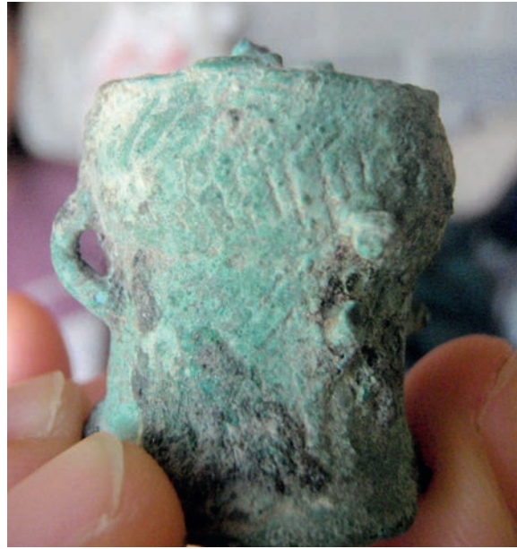
กลองมโหระทึกจำลองขนาดเล็ก แหล่งโบราณคดีโนนหนองหอ

ชั้นที่ ๑ ลายเส้นที่ปรากฏบนชั้นแม่พิมพ์เห็นได้อย่างชัดเจน เป็นลายเส้นขนาน ลายเส้นเฉียง และวงกลมลายเส้นทแยงต่อเนื่อง ส่วนลายที่โดดเด่นหรือลายกลมคล้ายส่วนหัวและปากของนก