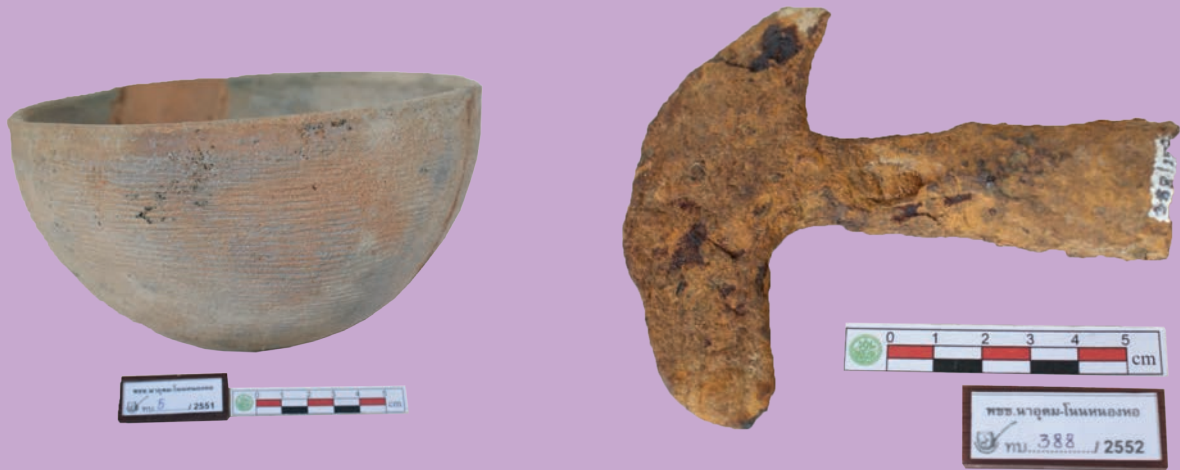
เครื่องมือเหล็กและภาชนะดินเผา พบที่แหล่งโบราณคดีโนนหนองหอ

แหล่งโบราณคดีโนนหนองหอ ตั้งอยู่ในเขตหมู่ ๑ บ้านนาอุดม ตำบลนาอุดม อำเภอนิคมคำสร้อย จังหวัดมุกดาหาร แหล่งโบราณคดีแห่งนี้ถูกทำลายโดยการไถปรับเนินดินเพื่อขยายพื้นที่ทำการเกษตรกรรมและการลักลอบขุดหาโบราณวัตถุของชาวบ้านตั้งแต่ พ.ศ. ๒๕๓๖ เป็นต้นมา สำนักศิลปากรที่ ๙ อุบลราชธานี ได้ทำการตรวจสอบและขุดกู้โบราณวัตถุหลายครั้ง ปัจจุบันตัวแหล่งมีลักษณะเป็นเนินดิน มีความสูงจากที่นาโดยรอบ ๑ - ๒ เมตร มีพื้นที่ประมาณ ๕๐ ไร่