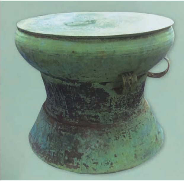
กลองมโหระทึกพบที่อำเภอคำชะอี จังหวัดมุกดาหาร