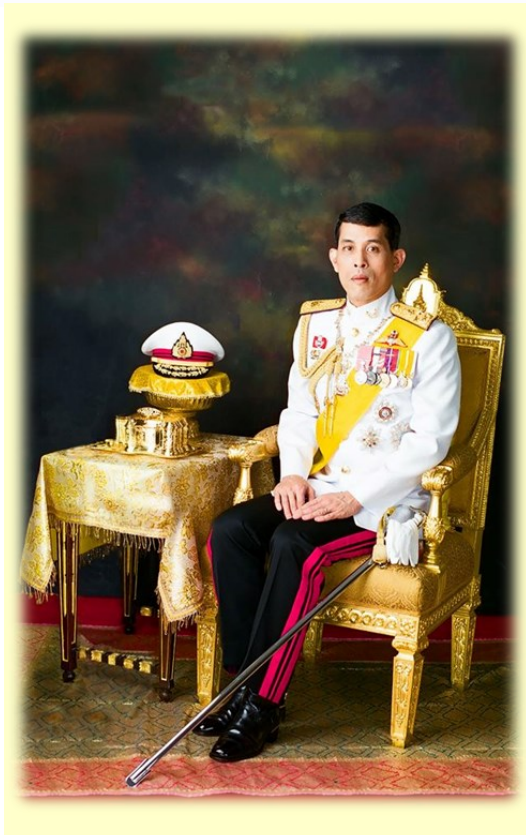
ทรงพระเจริญ