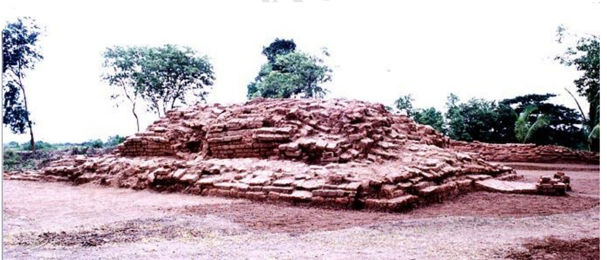
โบราณสถานหมายเลข 24 เมืองคูบัว สภาพหลังจากการขุดแต่ง