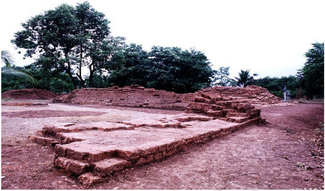
โบราณสถานหมายเลข 25 เมืองคูบัว สภาพหลังจากการขุดแต่ง