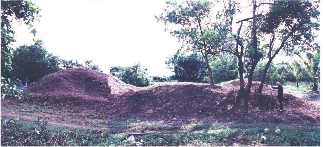
โบราณสถานหมายเลข ๒๔ และ ๒๕ เมืองคูบัว สภาพก่อนการขุดแต่งหลังจาก