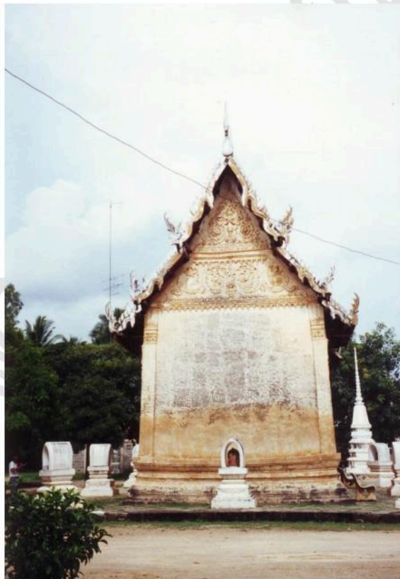
ด้านหลังอุโบสถวัดท่าคอย ตัวอุโบสถสอบเล็กน้อย