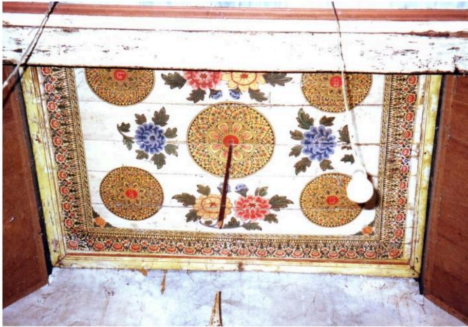
ลายดาวเพดานภายในอุโบสถวัดท่าคอย