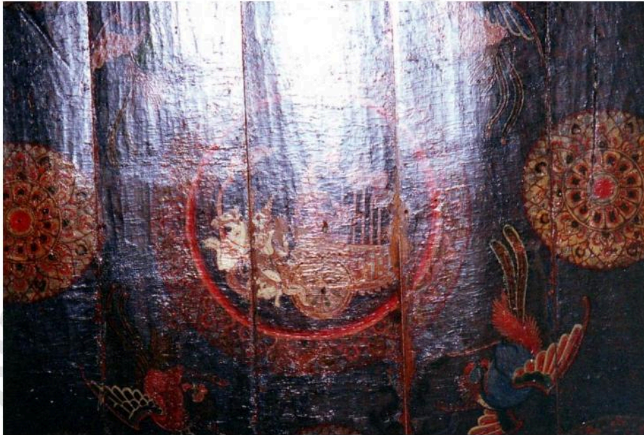
ภาพเขียนบนเพดานศาลาการเปรียญวัดท่าคอย รูปราชรถพระจันทร์ล้อมรอบด้วยลายดาวเพดาน