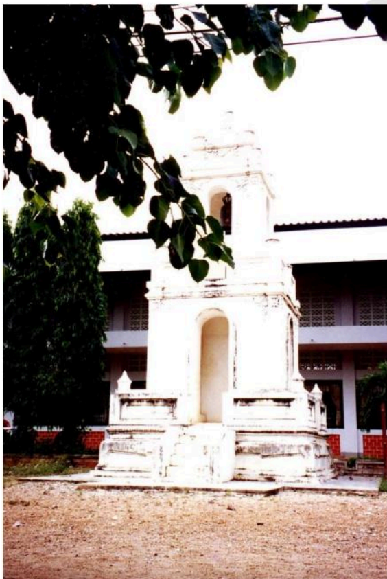
หอระฆังวัดท่าคอย เป็นอาคารประยุกต์ทรงสี่เหลี่ยม