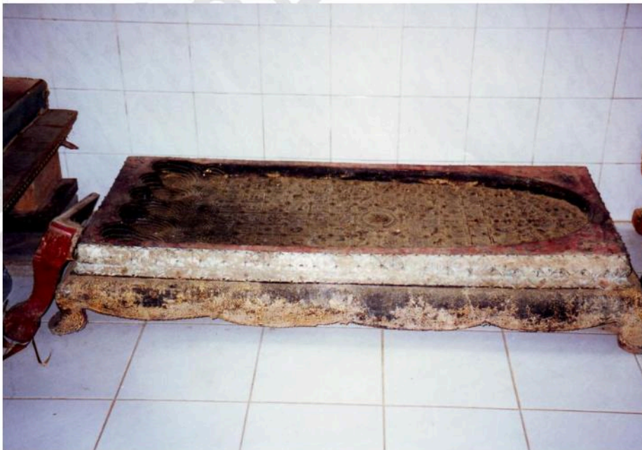
รอยพระพุทธบาทจำลอง เก็บรักษาไว้