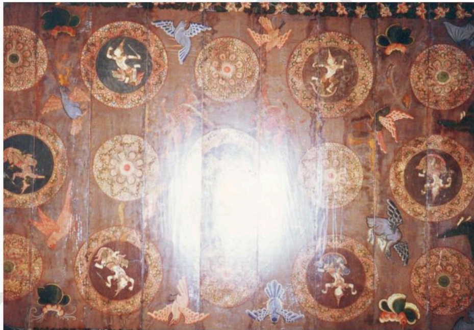
ภาพเขียนบนเพดานศาลาการเปรียญวัดท่าคอย เป็นภาพนกกยุง ในดวงดาวล้อมรอบด้วย เทพอัปสร รามสูร เมขลา และลายดวงดารา