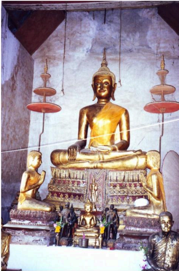
พระประธานในอุโบสถ เป็นพระพุทธรูป ปูนปั้นปางมารวิชัย ประดิษฐานอยู่บน ฐานชุกชีปูนปั้น