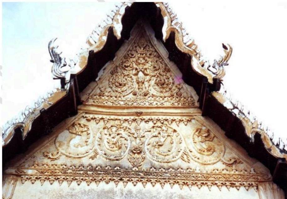
หน้าบันด้านทิศตะวันตก อุโบสถ วัดท่าค้อย ตอนบนเป็นรูปเทพพนม ตอนล่างเป็นลายก้านขดหางโต หางทำเป็นรูปครุฑออกมา