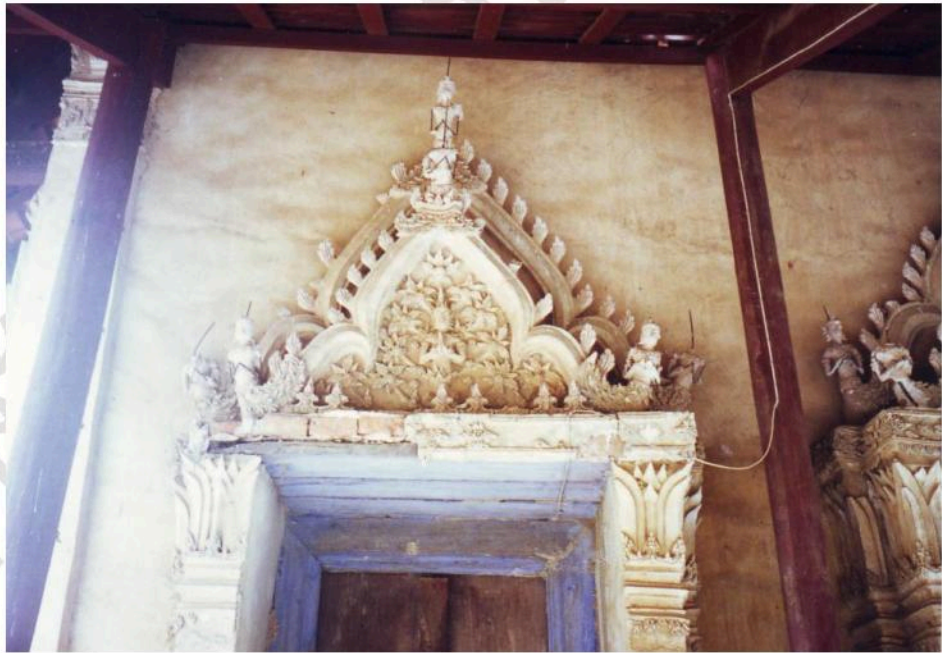
ซุ้มประตู อุโบสถวัดท่าคอย ประดับด้วยลวดลายปูนปั้น เช่นเดียวกัน