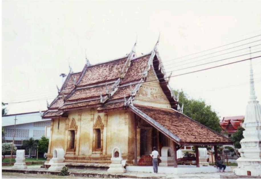
อุโบสถวัดท่าคอย เป็นอุโบสถขนาดเล็กฐานอ่อนโค้ง ภายในมีภาพเขียนบนเพดานไม้