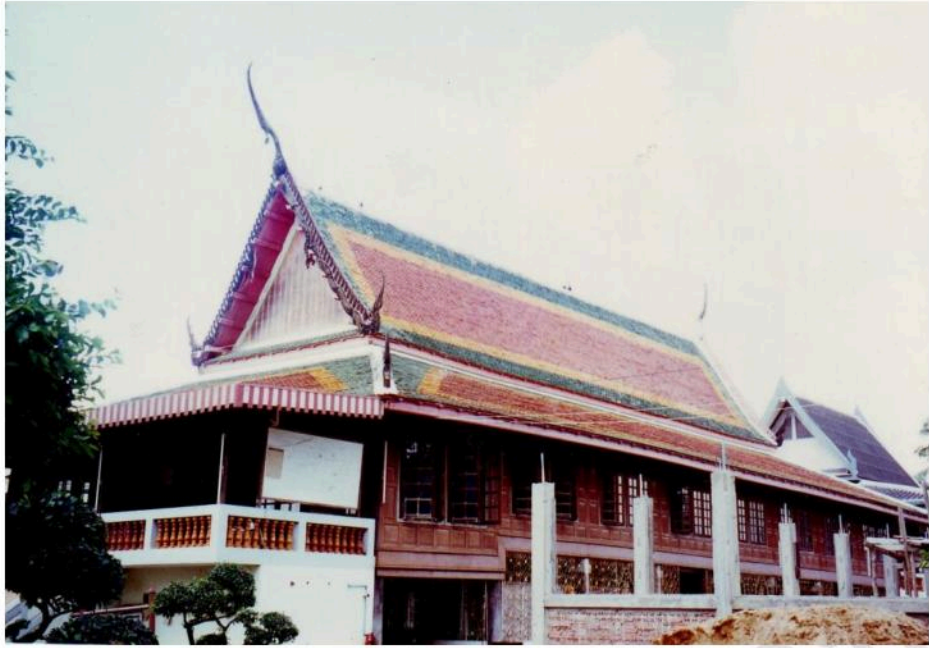
ศาลาการเปรียญวัดท่าคอย ที่เพดานมีภาพเขียนที่ย้ายมาจากศาลาเปรียญหลังเก่า