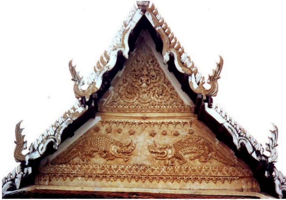
หน้าบัน ด้านหน้า (ทิศตะวันตก) อุโบสถวัดท่าค้อย เป็นรูปเทพพนม ถัดลงมาเป็นมกรพันหน้าเข้าหากัน