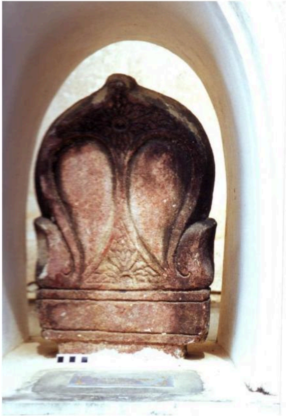
เสมาวัดท่าคอย เป็นเสมาขนาดเล็ก สลักจากหินทรายแดง