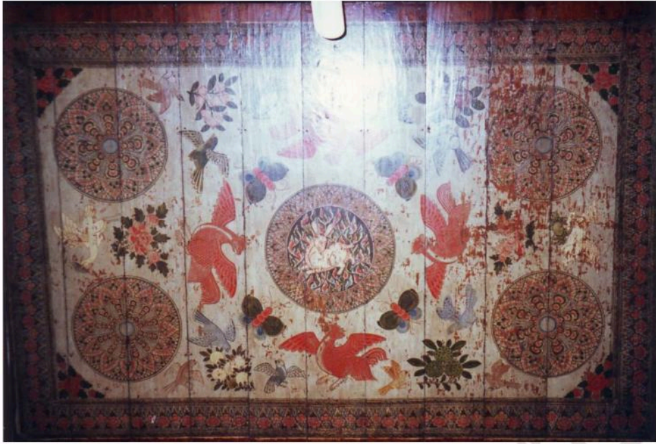
ภาพเขียนเพดานศาลาการเปรียญวัดท่าคอย รูปกระต่ายในดวงจันทร์ล้อมรอบด้วยลายดาวเพดาน