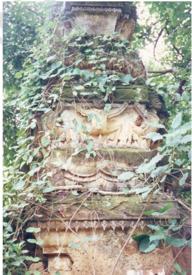
ลวดลายปูนปั้นตกแต่งเจดีย์ราย