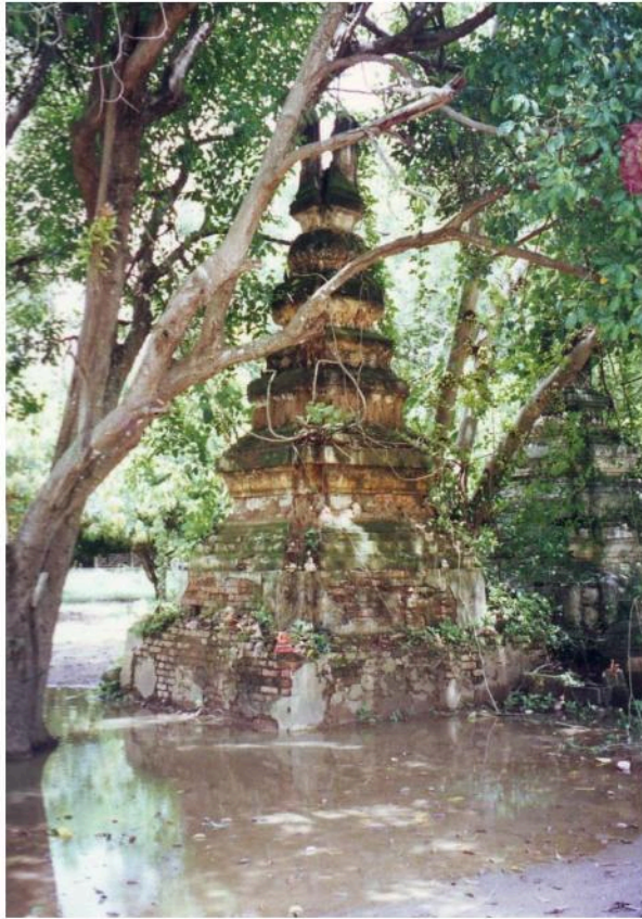
เจดีย์ราย หน้าอุโบสถหลังเดิม เป็นเจดีย์ย่อมุมไม้สิบสอง ตกแต่งด้วยลวดลายปูนปั้น