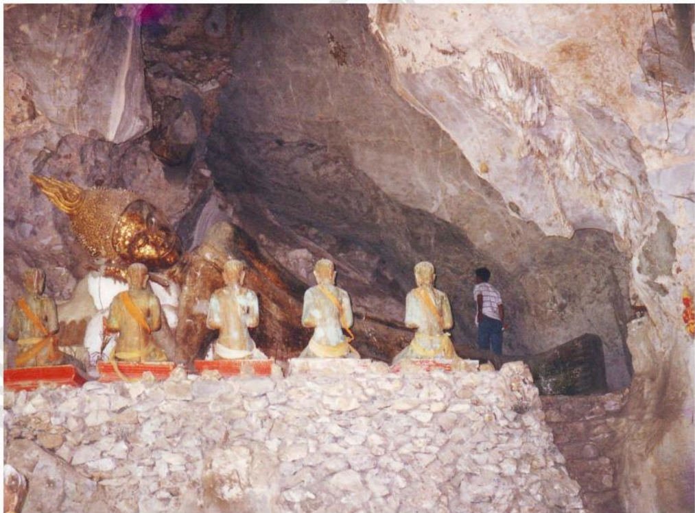
พระพุทธไสยาสน์ ที่ประดิษฐานอยู่ในถ้ำพระเขานาขวาง