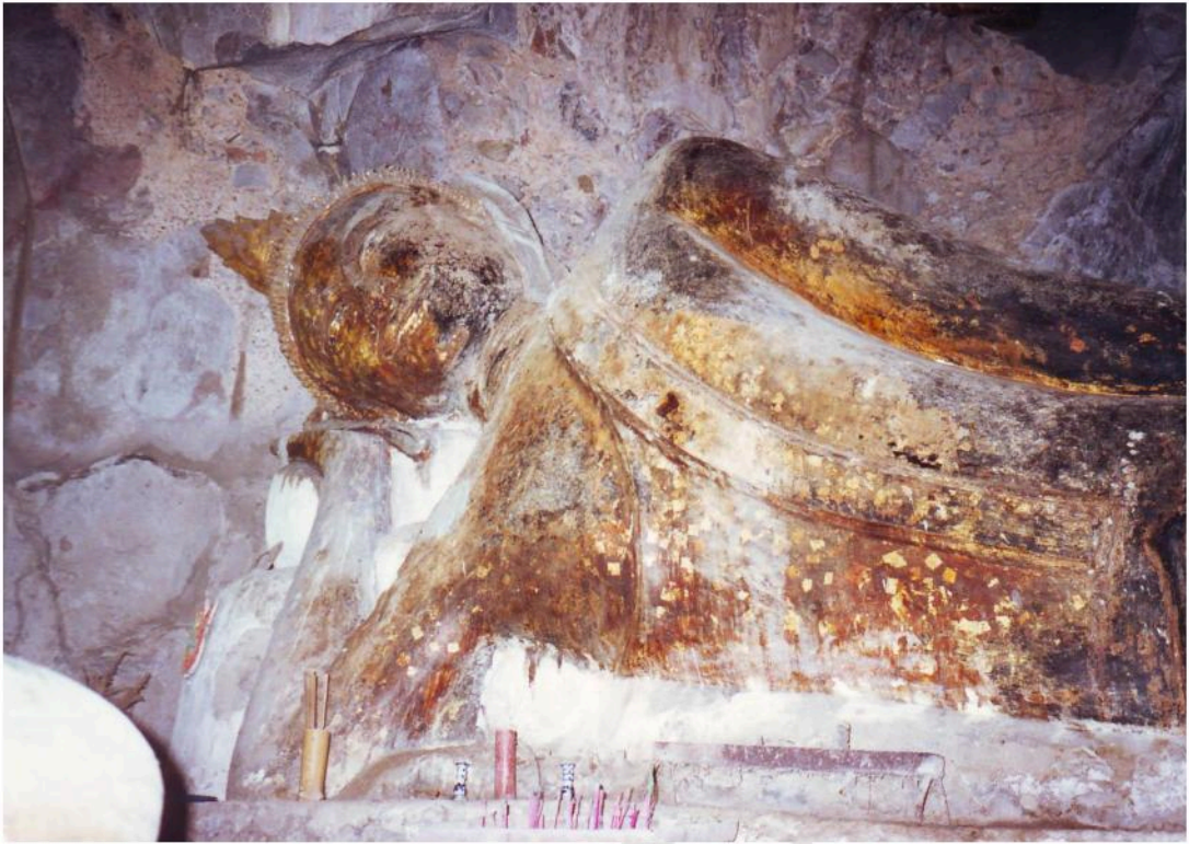
พระพุทธไสยาสน์ ในถ้ำพระเขานาขวาง พระพักตร์ค่อนข้างยาว พระองค์เพรียว