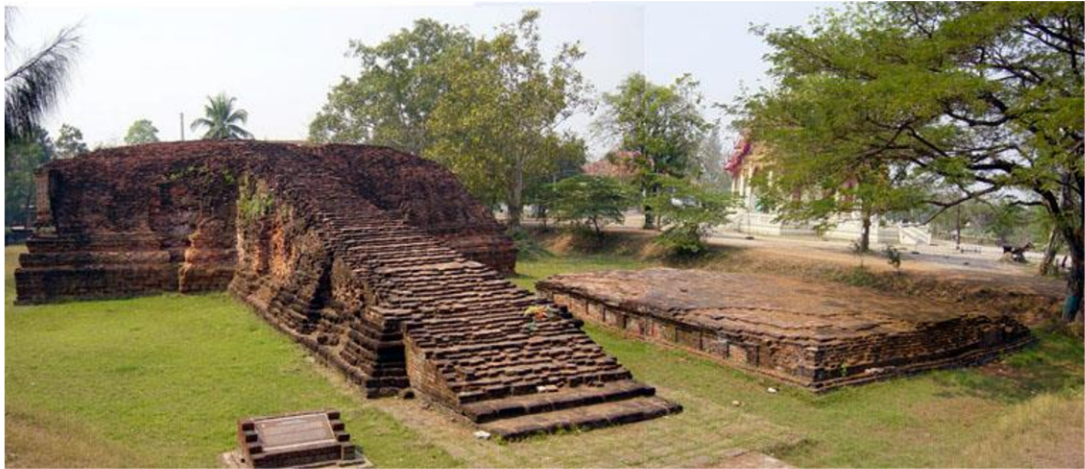
วัดโขลง โบราณสถานกลางเมืองคูบัว อ.เมือง จ.ราชบุรี