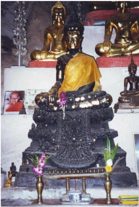
พระพุทธรูปพบในถ้ำวัดอินทศิรี