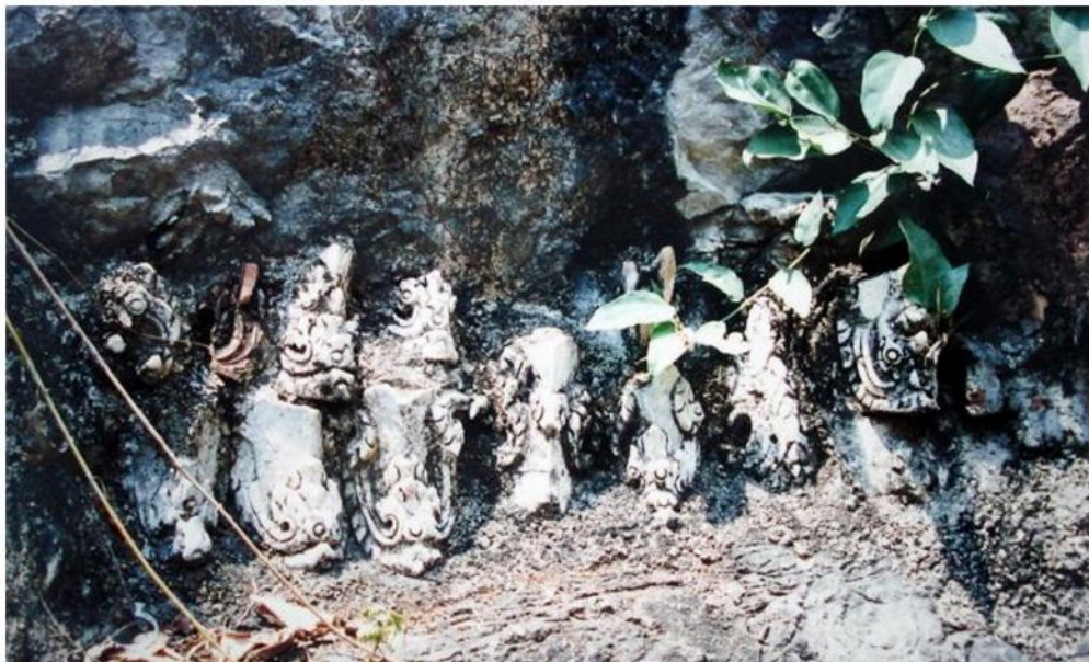
ลวดลายปูนปั้นประดับเจดีย์พบในบริเวณวัดอินทคีรี