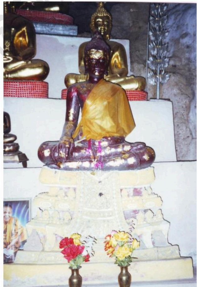
พระพุทธรูปพบในถ้ำวัดอินทศิรี