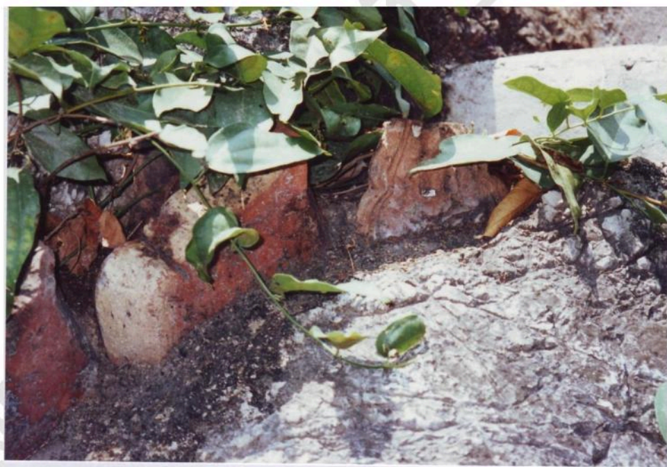
อิฐและกระเบื้องเชิงชายพบในวัดอินทคีรี