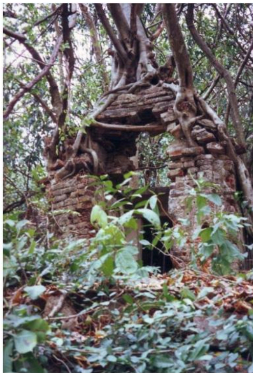
ซุ้มทางเข้านถ้ำวัดอินทศิรี