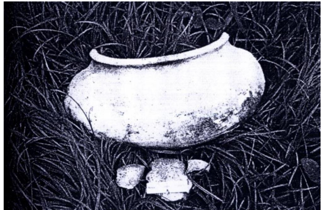
ภาชนะดินเผาขนาดใหญ่พบจากถ้ำวิมาน