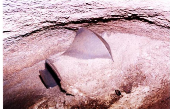
ภาชนะดินเผาก้นกลมปากบาน ถูกรินปูนเคลือบ ติดอยู่กับผนังถ้ำวิมาน