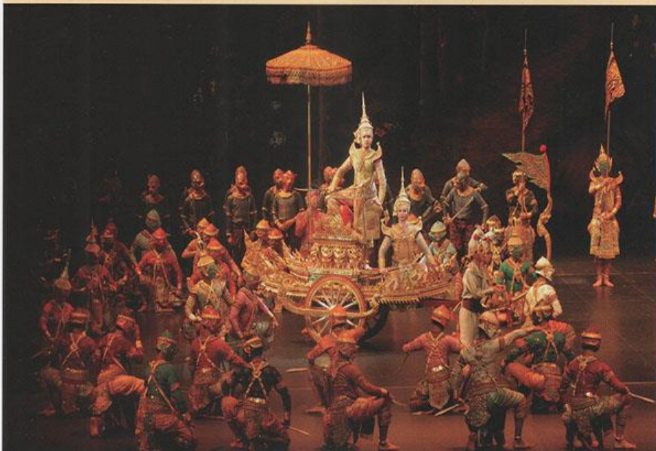
▼ การแสดงโขน ศิลปะชั้นสูงที่ต้องอาศัยศาสตร์และศิลป์หลายแขนง

นาฏศิลป์ของไทยค้นพบได้จากหลักฐานทางโบราณคดีที่เก่าแก่ที่สุดคือหลักศิลาจารึกหลักที่ ๑ ของพ่อขุนรามคำแหงมหาราช ซึ่งได้อ้างถึง “ระบำ รำ และเต้น” และได้รับการพัฒนาให้สมบูรณ์ยิ่งขึ้นในสมัยกรุงศรีอยุธยา โดยเฉพาะอย่างยิ่งในสมัยของสมเด็จพระเจ้าอยู่หัวบรมโกศ เนื่องจากเป็นยุคสมัยที่บ้านเมืองมีความสงบสุข จึงกลายเป็นยุคทองของนาฏศิลป์และละครราชสำนัก โดยศิลปะการแสดงของไทยจะประกอบด้วย ๓ หมวดใหญ่ คือ นาฏศิลป์ โขน และละคร นับได้ว่าโดดเด่นและมีความสำคัญเป็นอย่างยิ่ง