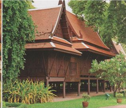
▲ บ้านทรงไทย ภูมิปัญญาที่สืบทอดจากรบรรพบุรุษ

ต้มยำ เป็นอาหารยอดนิยมที่ทำให้ชาวโลกได้รับรู้ถึงอาหารไทยในอันดับต้น ๆ มีรสเปรี้ยว เผ็ดนำ ผสมเค็ม และหวาน รับประทานกับข้าวสวยร้อน ๆ มีทั้งแบบต้มยำน้ำข้น และต้มยำน้ำใส โดยมีเครื่องต้มยำคือ ข่า ตะไคร้ ใบมะกรูด พริก ทำการปรุงรสด้วยมะนาว น้ำปลา น้ำพริกเผา หรืออาจจะเพิ่มเห็ดหรือเนื้อสัตว์ก็ได้ หากจะทำแบบน้ำข้นก็ใส่กะทิหรือนมสดเพิ่มตามสูตรต้มยำของร้านอาหารในปัจจุบัน