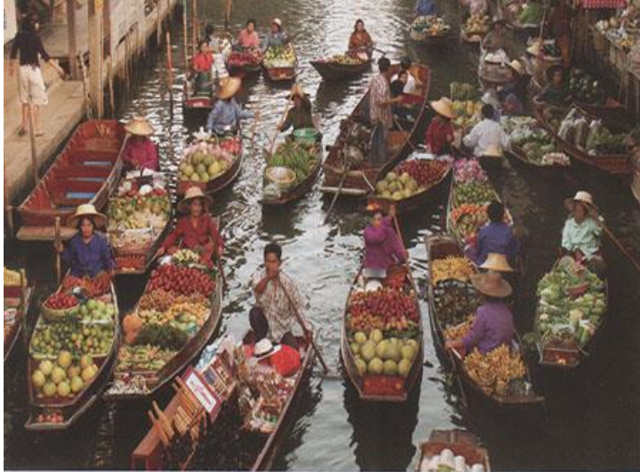
▲ ตลาดน้ำ แสดงถึงวิถีชีวิตชาวไทยในอดีตมีความเกี่ยวข้องกับน้ำอย่างใกล้ชิด

แวววิกา ศรีบ้าน. “ราชอาณาจักรไทย ดินแดนแห่งรอยยิ้มและมิตรไมตรี” วัฒนธรรม. 52(พิเศษ) : หน้า 94 - 103.