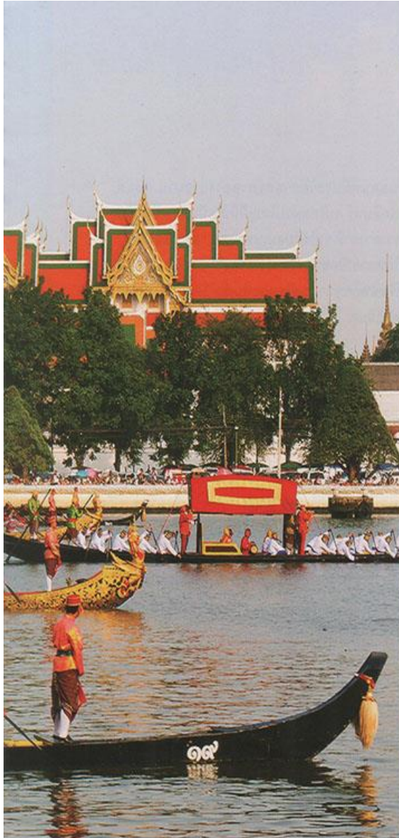
กระบวนพยุหยาตราชลมารค กระบวนเสด็จพระราชดำเนินทางน้ำ เป็นราชประเพณีไทยที่มีมาแต่โบราณ

แวววิกา ศรีบ้าน. “ราชอาณาจักรไทย ดินแดนแห่งรอยยิ้มและมิตรไมตรี” วัฒนธรรม. 52(พิเศษ): หน้า 94 - 103.