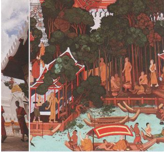
▲ ภาพจิตรกรรมไทย

แวววิกา ศรีบ้าน. “ราชอาณาจักรไทย ดินแดนแห่งรอยยิ้มและมิตรไมตรี” วัฒนธรรม. 52(พิเศษ) : หน้า 94 - 103.