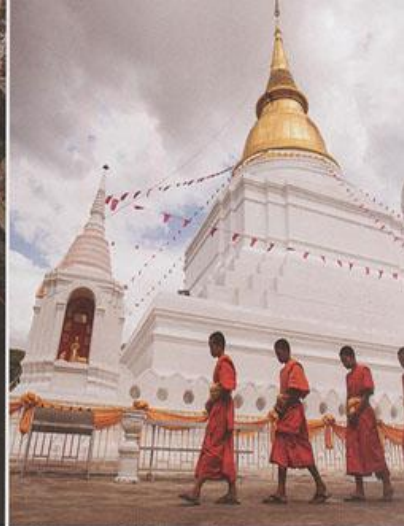
▲ วิถีชาวพุทธที่มีวัดเป็นศูนย์กลาง