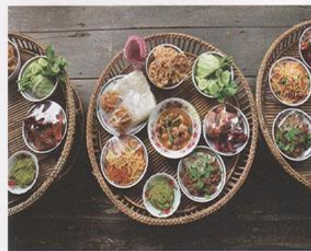
▲ จันโถก ภาชนะสำหรับวางสำหรับอาหารของชาวล้านนา

อาหารที่ขึ้นชื่อของคนไทย คือ “น้ำพริกปลาชุก” พร้อมกับเครื่องเคียงที่จัดมาเป็นชุด โดยน้ำพริกถือเป็นเครื่องจิ้มสำหรับอาหารในแต่ละมื้อ หรือจะรับประทานกับข้าวเปล่าก็ได้ ในการเรียกชื่อน้ำพริกแต่ละชนิดจะเรียกตามส่วนประกอบหลักที่นำมาทำ ซึ่งอาจเป็นเนื้อสัตว์ พืชผัก เช่น น้ำพริกขิง น้ำพริกปลา น้ำพริกปลาร้า เป็นต้น