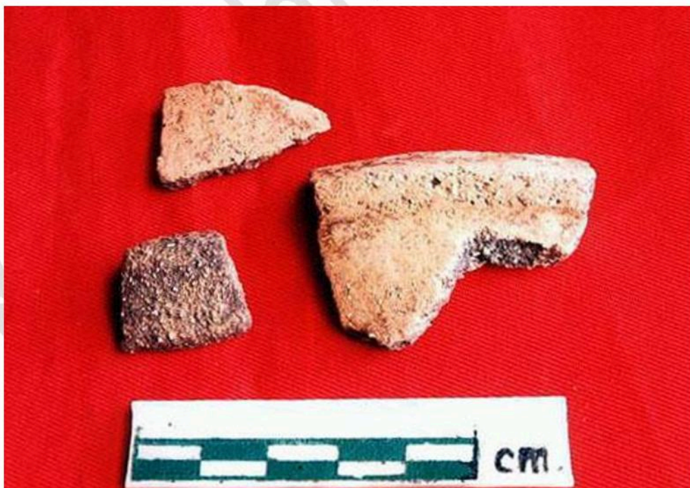
ชิ้นส่วนภาชนะดินเผาเนื้อหยาบ พบจากถ้ำไทร 1