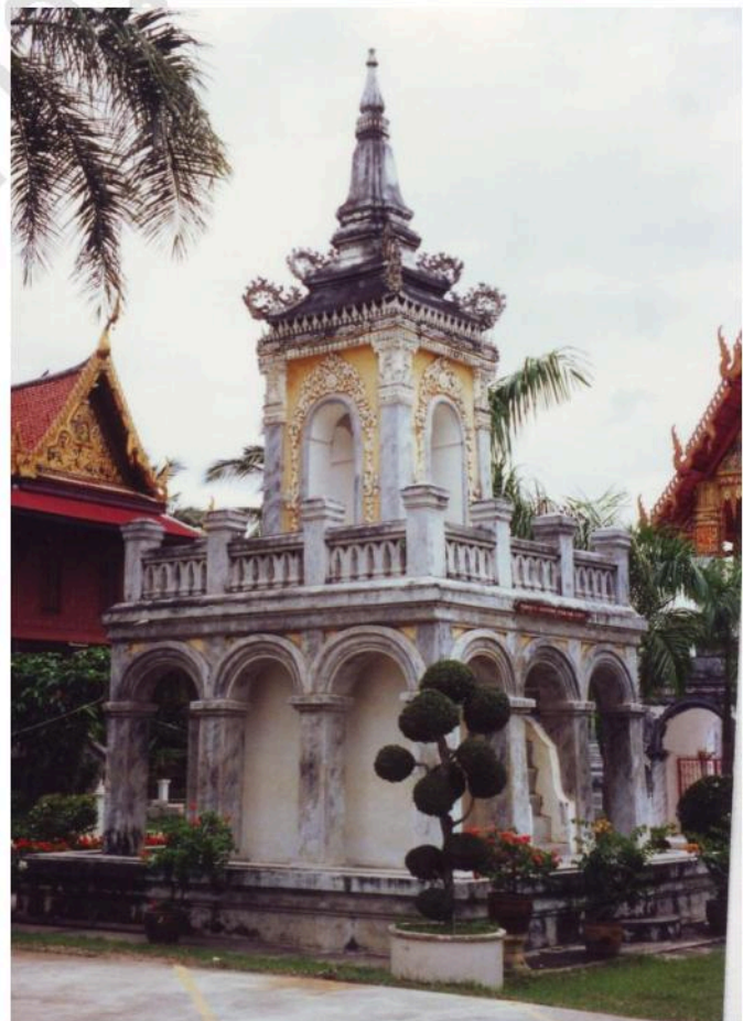
หอรระฆังวัดบันไดทอง เป็นอาคารประยุกต์ ไทย, จีน และตะวันตก รูปทรงคล้ายหอรระฆัง ที่วัดใหญ่สุวรรณาราม