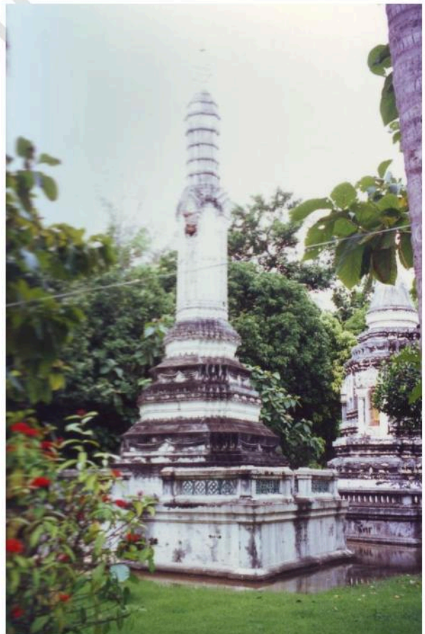
ปราสาทย่อมุมไม้ยี่สิบ รูปทรงสูงเพรียวมาก