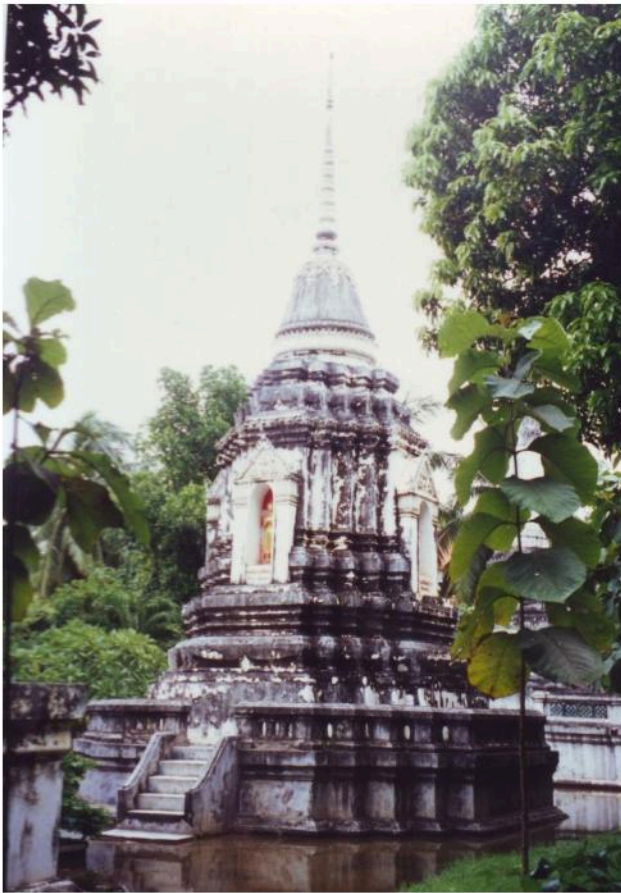
เจดีย์ย่อมุมไม้ยี่สิบทรงกลม เรือนธาตุมีซุ้มพระ 4 ทิศ