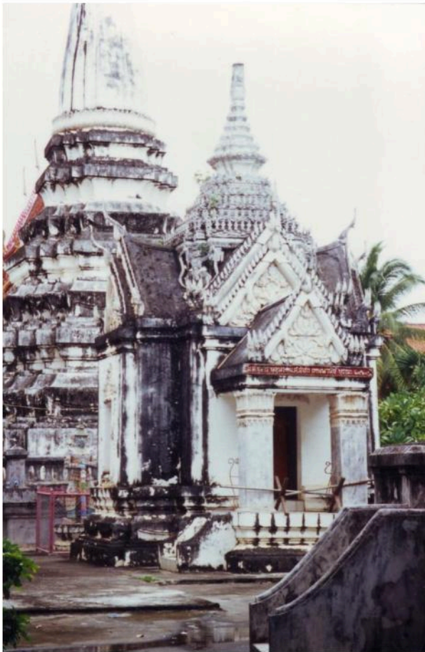
มณฑป ทรงจตุรมุข ตกแต่งด้วยลวดลายปูนปั้น บูรณะเมื่อ พ.ศ. 2528