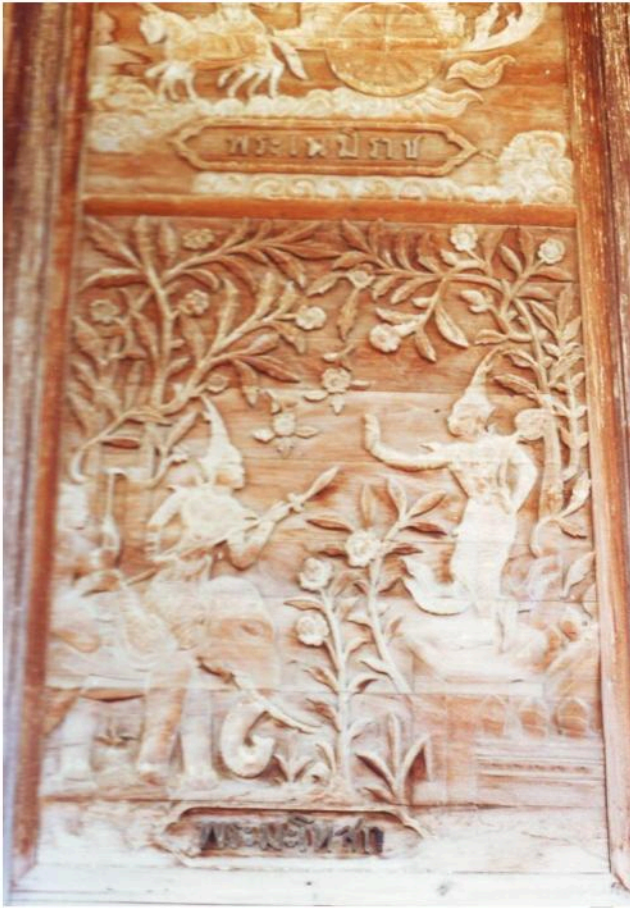
ฝาด้านนอกอุโบสถ วัดกุฎีบางเค็ม เป็นไม้แกะสลักที่ผนังด้านหน้าเป็นเรื่องทศชาดก ใต้ภาพมีคำบรรยายบอก