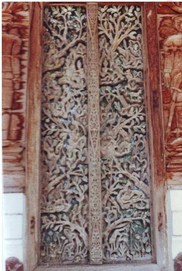
บานประตูะโบสถวัดกุฎี เป็นไม้แกะสลักประดับกระจกสี