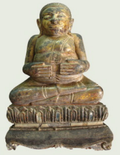
พระพุทธรูปประทับนั่ง ศิลปะอยุธยา ราชพุทธศตวรรษที่ ๒๐ - ๒๔ พบที่อำเภอเมือง จังหวัดนครราชสีมา

สมัยก่อนประวัติศาสตร์ จัดแสดงหลักฐานโบราณคดี สมัยก่อนประวัติศาสตร์ จากแหล่งโบราณคดีที่สำคัญ อาทิ แหล่งโบราณคดี บ้านปราสาท เป็นอุโลก บ้านโนนวัด และบ้านหลุมข้าว ในเขตอำเภอเมือง และแหล่งโบราณคดีบ้านสอย อำเภอพิมาย จังหวัดนครราชสีมา ซึ่งมีอยู่ระหว่าง ๑,๐๐๐ - ๑,๕๐๐ ปีมาแล้ว