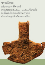
ขวานโลหะ สมัยก่อนประวัติศาสตร์ อายุประมาณ ๒,๕๐๐ - ๑,๕๐๐ ปีมาแล้ว พบที่แหล่งโบราณคดีบ้านปราสาท อำเภอเมือง จังหวัดนครราชสีมา