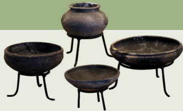
ภาชนะดินเผาแบบพื้นนาค้ำ สมัยก่อนประวัติศาสตร์ อายุประมาณ ๒,๕๐๐ - ๑,๕๐๐ ปีมาแล้ว พบที่จังหวัดนครราชสีมา

ศิลปะอยุธยา ถึงรัตนโกสินทร์ ภายหลังจากอิทธิพลวัฒนธรรมเขมรเสื่อมลงในราวกลางพุทธศตวรรษที่ ๑๘ ถึงต้นพุทธศตวรรษที่ ๑๙ อิทธิพลวัฒนธรรมจากอาณาจักรล้านช้าง กรุงศรีอยุธยา ตลอดจนกรุงรัตนโกสินทร์ ได้เข้ามามีบทบาท และแพร่กระจายในดินแดนแถบนี้