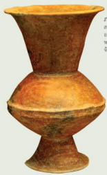
ภาชนะดินเผา สมัยก่อนประวัติศาสตร์ อายุประมาณ ๒,๖๐๐ - ๒,๒๐๐ ปีมาแล้ว พบที่แหล่งโบราณคดีบ้านปราสาท จังหวัดนครราชสีมา