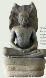
พระพุทธรูปนาคปรก ศิลปะทวารวดี พุทธศตวรรษที่ ๑๘ พบที่อำเภอเมือง จังหวัดนครราชสีมา