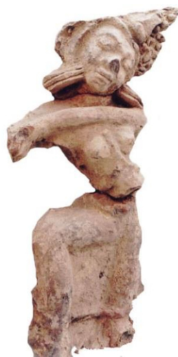
ลวดลายดินเผาประดับศาสนสถาน