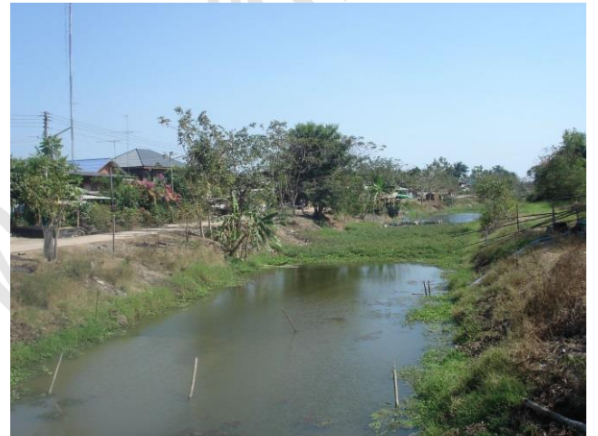
คูเมืองทางด้านทิศตะวันออกของเมืองคู