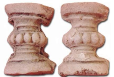
ลวดลายดินเผาประดับศาสนสถาน