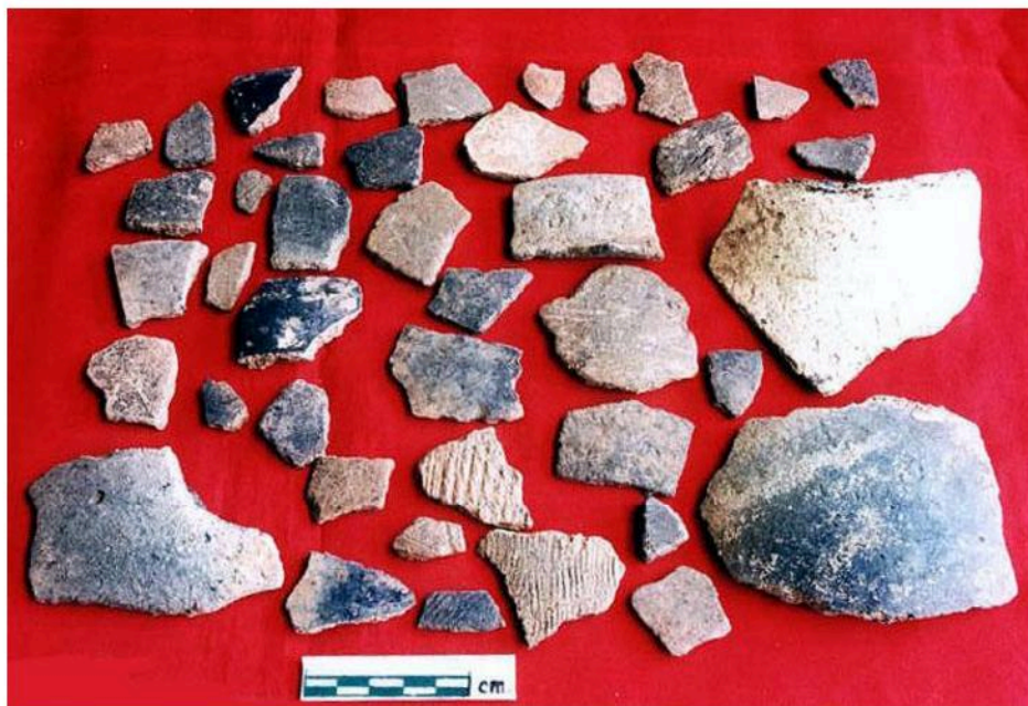
เศษชิ้นส่วน หม้อขนาดต่าง ๆ แหล่งโบราณคดีบ้านไทรหุบเขลา อ.แก่งกระจาน จ.เพชรบุรี