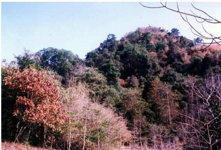
แหล่งโบราณคดีบ้านไทรหุบฉลา อ.แก่งกระเจาน จ.เพชรบุรี