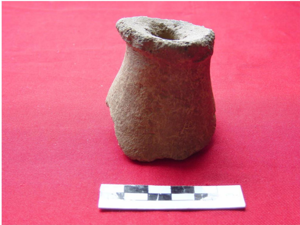
ชิ้นส่วนภาชนะดินเผา พบในแหล่งโบราณคดีบ้านห้วยแร่