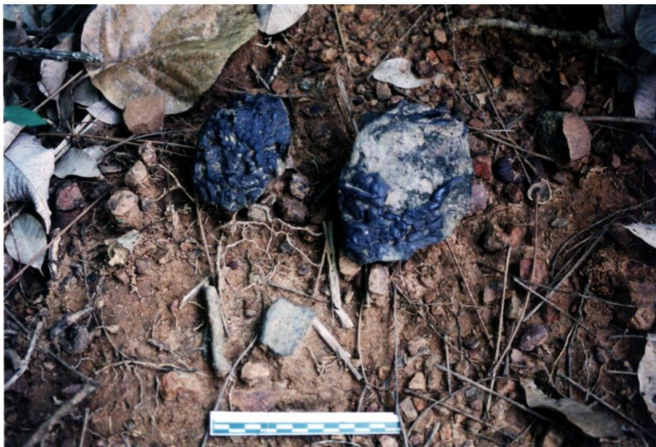
ตะกอนแร่เหล็กและชั้นส่วนภาชนะดินเผาที่พบจากแหล่งโบราณคดีบ้านห้วยแร่ 1