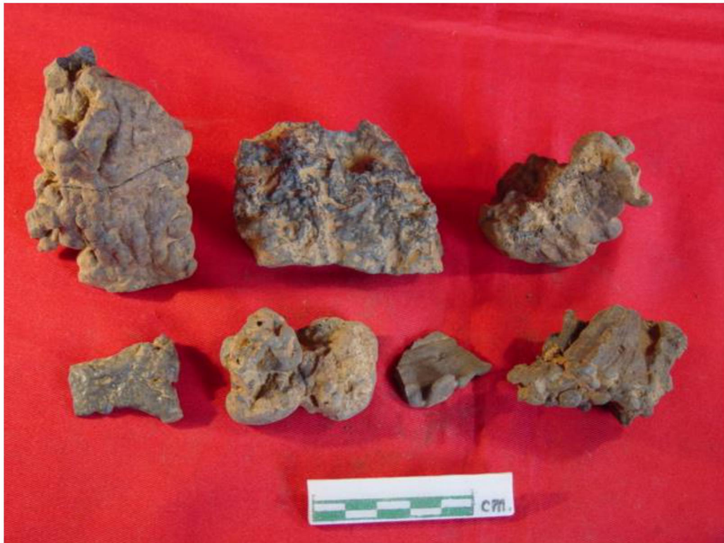
ตะกรันแร่เหล็กที่พบจากแหล่งโบราณคดีบ้านห้วยแร่ 1