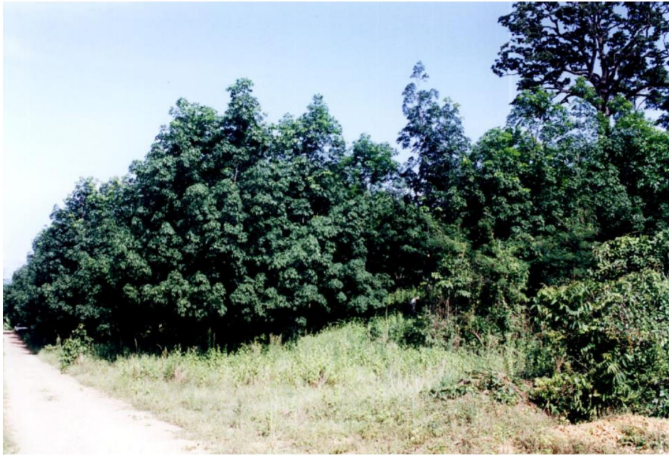
แหล่งโบราณคดีบ้านห้วยแร่ 1