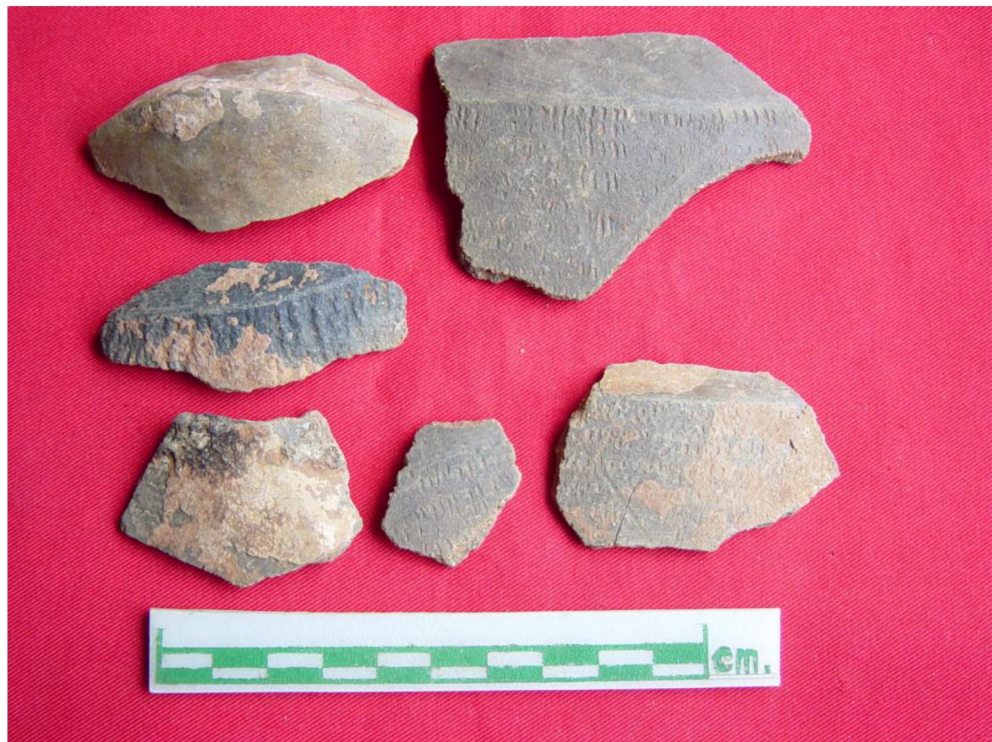
ชิ้นส่วนภาชนะดินเผา พบในแหล่งโบราณคดีบ้านห้วยแร่