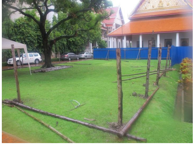
พื้นที่ด้านทิศใต้ของพระที่นั่งอิศราวินิจฉัย ก่อนทำการขุดค้น