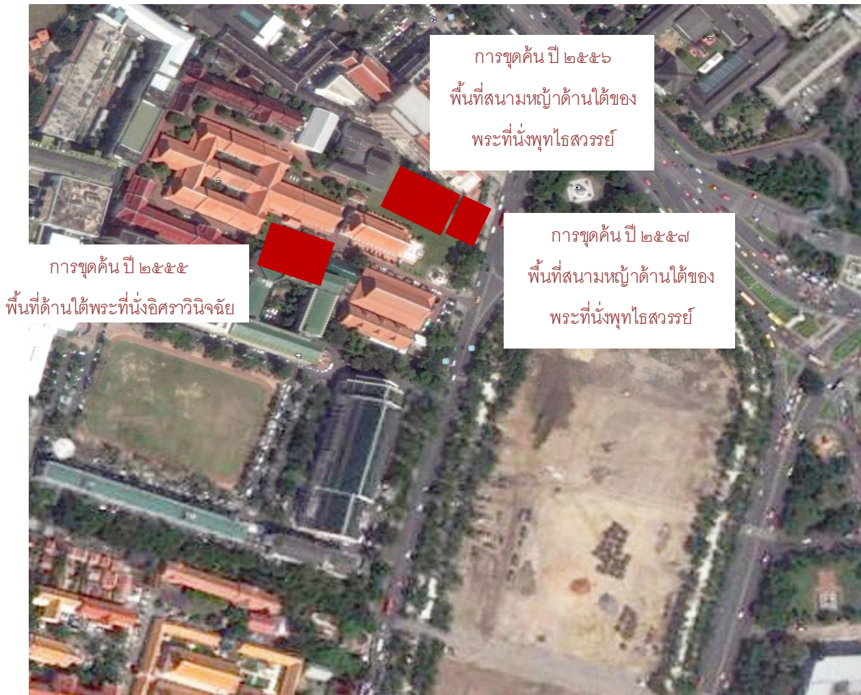
แผนผังแสดงตำแหน่งที่ทำการขุดค้น