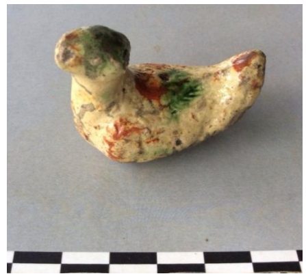
ตัวอย่างโบราณวัตถุที่พบ