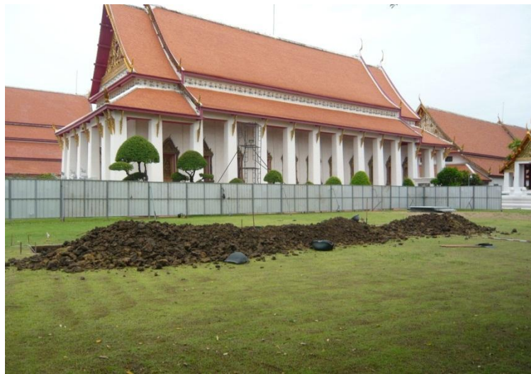
พื้นที่ก่อนทำการขุดค้น

ในระยะที่ ๔ ขุดค้นและขุดแต่งบริเวณพื้นที่สนามหญ้าหน้าโรงราชรถ พิพิธภัณฑสถานแห่งชาติ พระนคร ปริมาณงาน ๔๐๐ ลบ.ม. ได้มีขั้นตอนการดำเนินงานโดยการประยุกต์เทคโนโลยีการสำรวจทางด้านธรณีฟิสิกส์ในการศึกษาร่องรอยหลักฐานทางโบราณคดีใต้ดิน (GPR) และระบบภูมิสารสนเทศ (GIS) ในการศึกษาการใช้พื้นที่ในอดีต และได้เริ่มทำการขุดค้นทางโบราณคดี ตั้งแต่ปลายเดือนมิถุนายน ๒๕๕๗ เป็นต้นมา