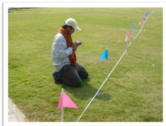
การสำรวจโดยใช้เครื่องมือธรณีฟิสิกส์