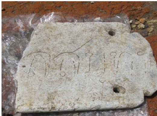
ตัวอย่างโบราณวัตถุที่พบ