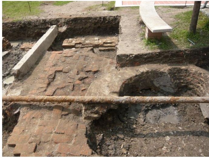
แนวโบราณสถานที่พบจากการขุดค้น