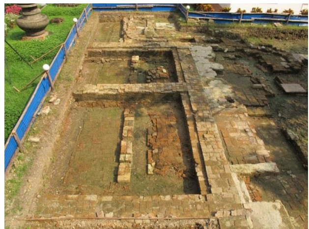
โบราณสถานที่พบจากการขุดค้น