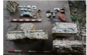
ตัวอย่างโบราณวัตถุที่ได้จากการขุดค้น