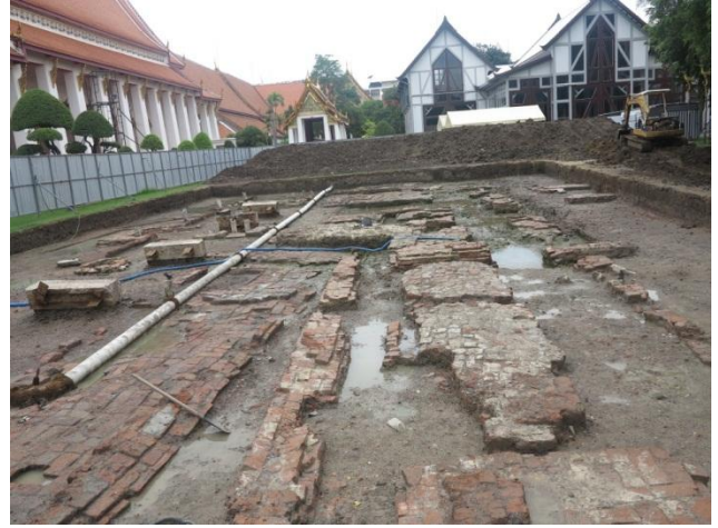
แนวโบราณสถานที่พบจากการขุดค้น