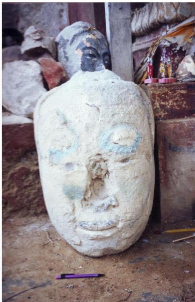
เศียรพระพุทธรูปปูนปั้นขนาดใหญ่