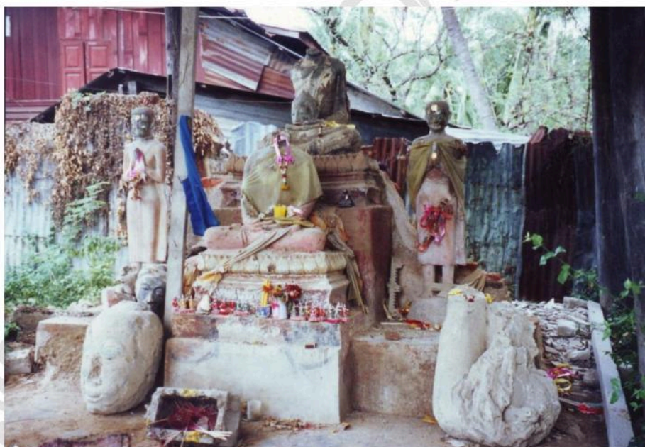
พระพุทธรูปในอุโบสถวัดท่าน้ำ (ร้าง)