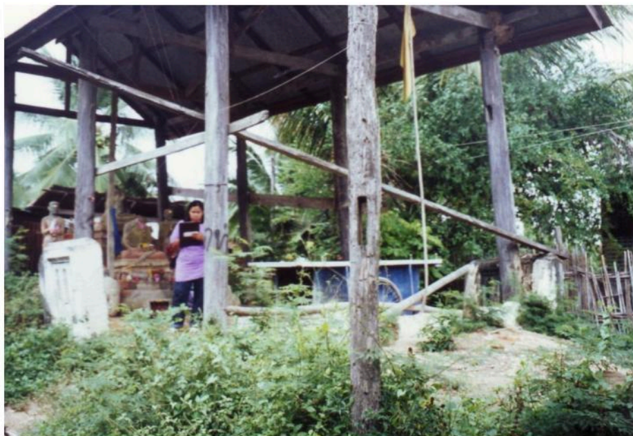
อุโบสถวัดท่าน้ำ (ร้าง) เหลือเฉพาะฐานและพระประธาน