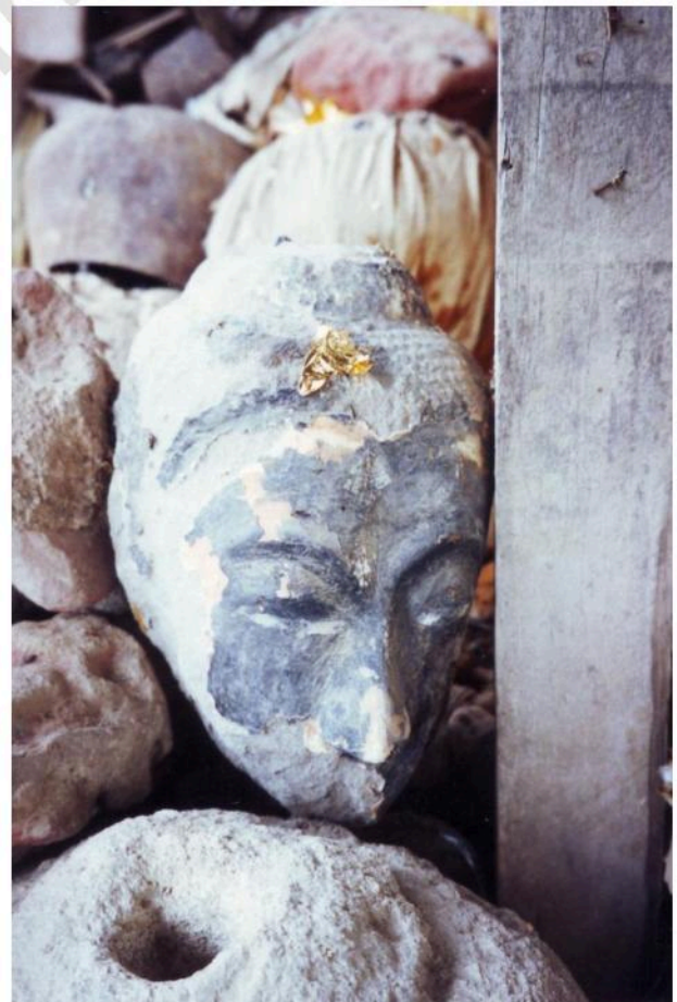
เศียรพระพุทธรูปหินทรายอยู่ที่วัดท่าน้ำ (ร้าง)