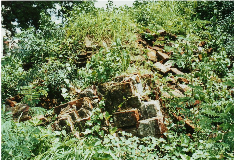
แนวการก่ออิฐซึ่งเป็นส่วนของฐานเจดีย์ที่หักล้ม

เนินเจดีย์วัดเพรงร้าง ต.หน้าเมือง อ.เมือง จ.ราชบุรี