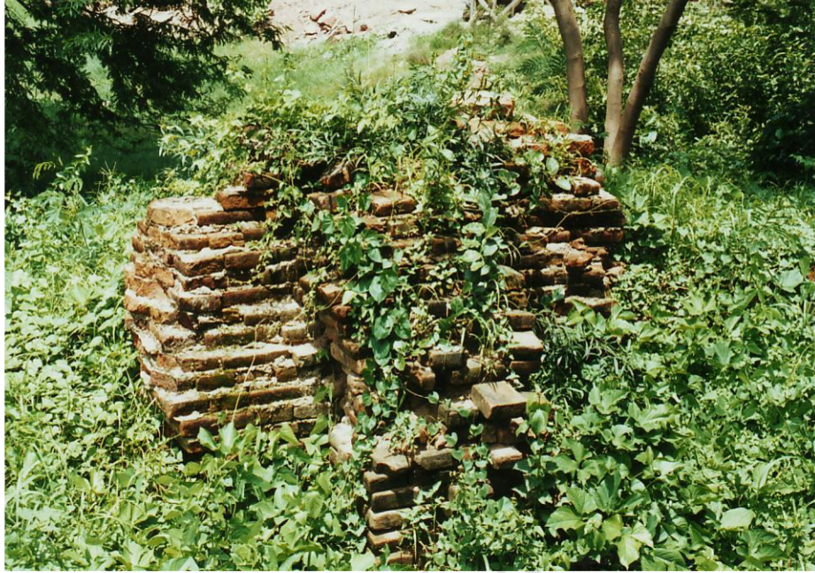
ฐานอิฐทางทิศตะวันออกเฉียงใต้ขององค์เจดีย์

เนินเจดีย์วัดเพรงร้าง ต.หน้าเมือง อ.เมือง จ.ราชบุรี