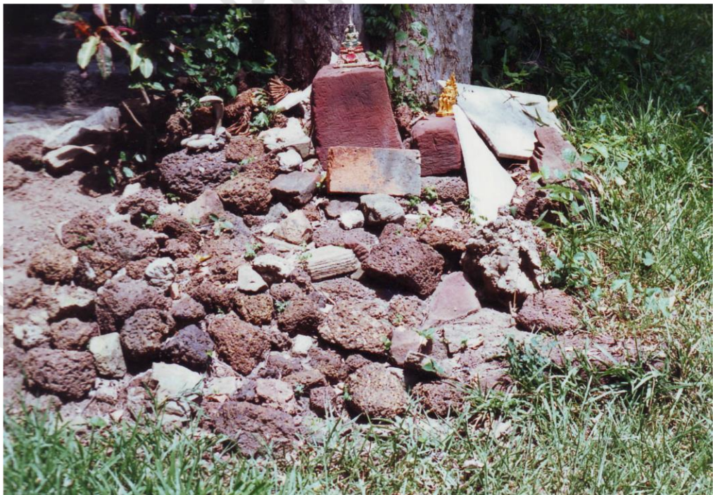
ชิ้นส่วนศิลาแลง และหินทรายแดงซึ่งเป็นส่วนประกอบของอาคารโบราณสถานจอมปราสาท