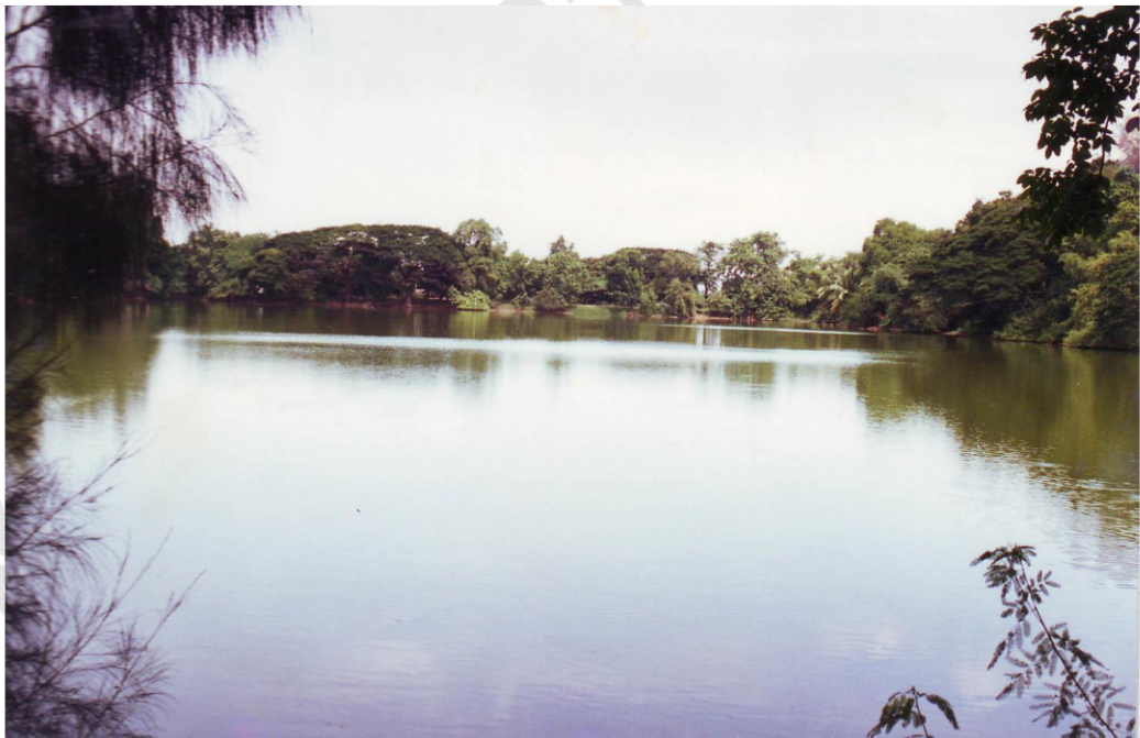
สระโกสินารายณ์ สระน้ำโบราณตั้งอยู่ทางด้านทิศเหนือของโบราณสถานจอม