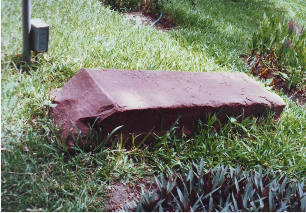
ชิ้นส่วนประกอบของอาคาร แห่งหินทรายแดงพบบนเนินโบราณสถานจอมปราสาท