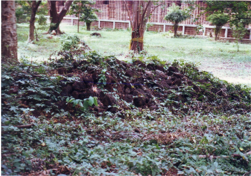
กองศิลาแลง บริเวณเนินโบราณสถานจอมปราสาท