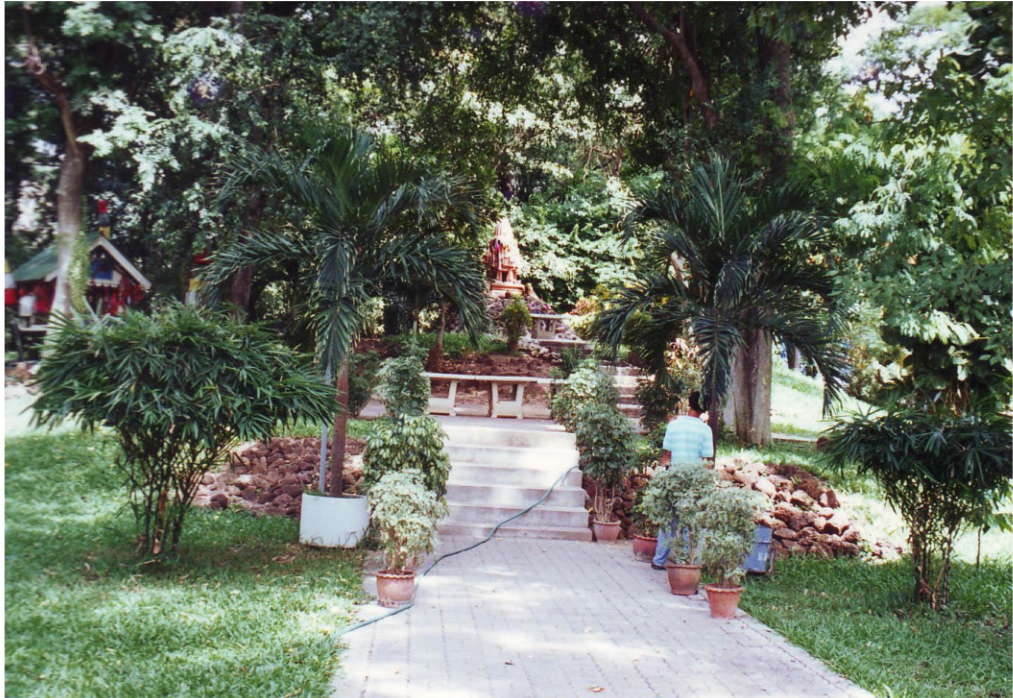
โบราณสถานจอมปราสาท