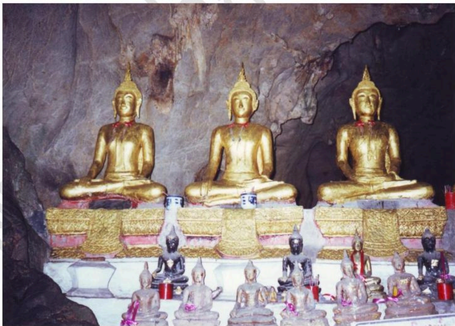
พระพุทธรูปที่พระบาทสมเด็จพระจุลจอมเกล้าเจ้าอยู่หัว สร้างถวายเป็นพระราชกุศล แต่พระเจ้าอยู่หัวตั้งแต่รัชกาลที่ 1-4