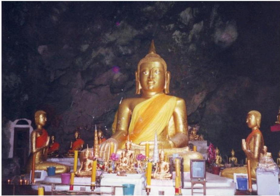
พระประธานในถ้ำเขาลวง รัชกาลที่ 4 โปรดให้สร้างขึ้นใหม่แทนของเดิม