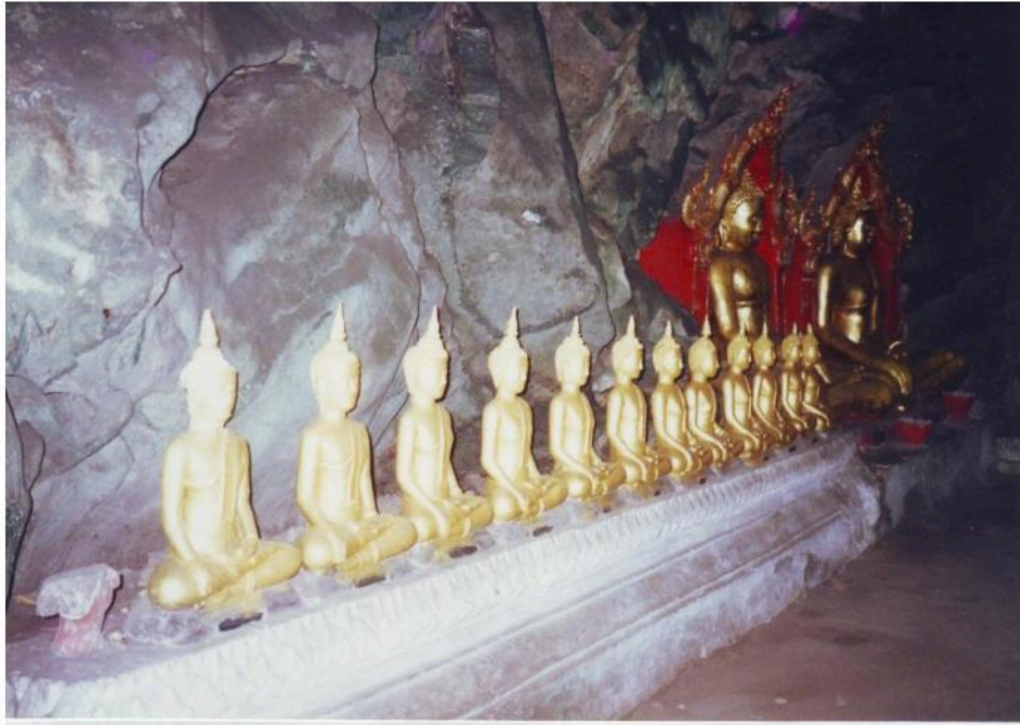
พระพุทธรูปในถ้ำเขาหลวง ส่วนหนึ่งเป็นพระพุทธรูปที่สร้างขึ้นในสมัยรัชการที่ 4 มีจารึกพระนามและนามไว้ที่ฐานพระพุทธรูป