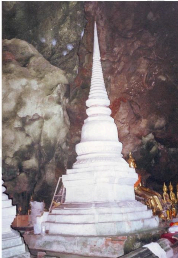
เจดีย์ทรงกลม ฐานสี่เหลี่ยมเพิ่มมุม