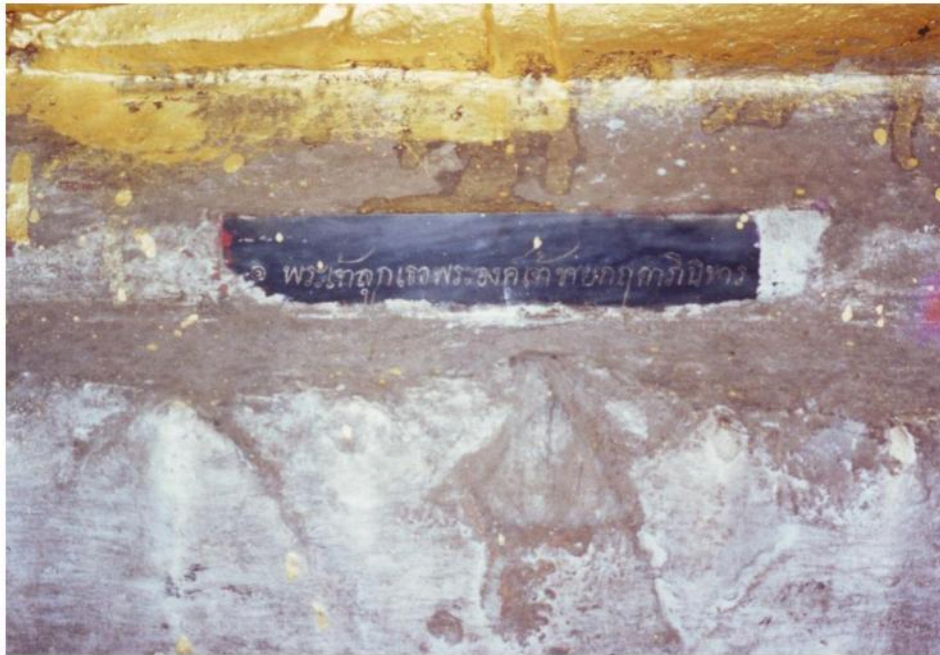
จารึกนามผู้สร้างที่ฐานพระพุทธรูป