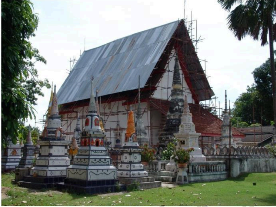
อุโบสถวัดท่าไชยศิริ