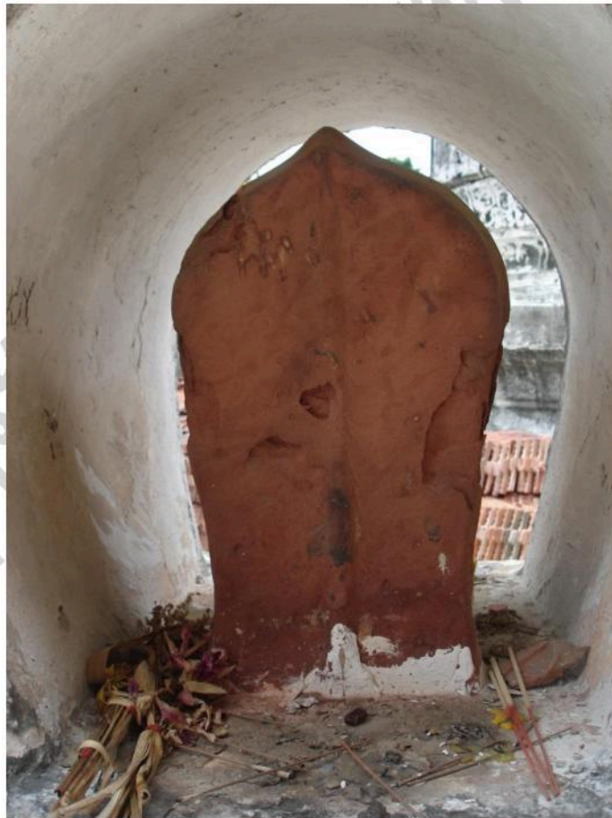
เสมาวัดท่าไชยศิริ เป็นเสมาคู่ สลักจากหินทรายแดง ไม่ตกแต่งลวดลาย