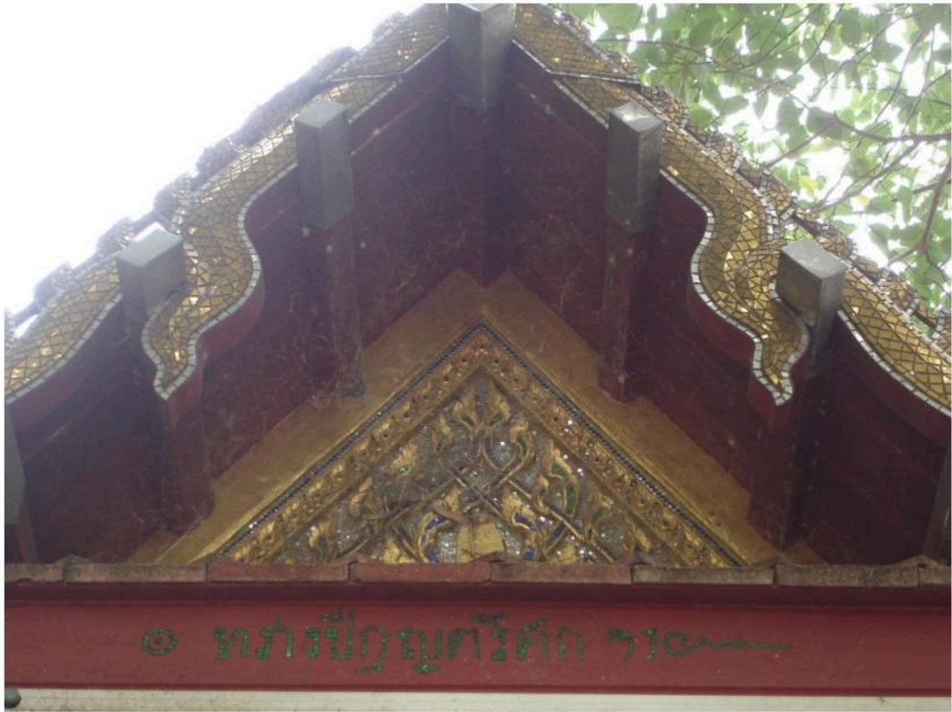
หน้าบันด้านทิศตะวันตก มีข้อความ “ทรงปัญตรีศก”