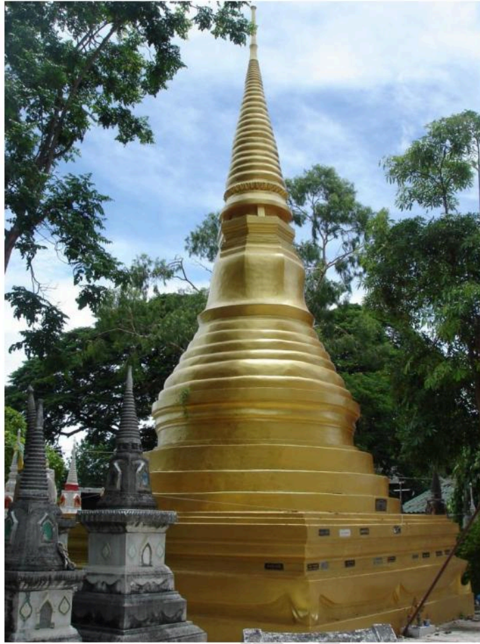
เจดีย์ทรงกลม ด้านหน้าอุโบสถ วัดท่าไชยศิริ น่าจะรักษา รูปแบบเดิมก่อนการบูรณะ บัลลังค์เป็นรูปแปดเหลี่ยม เป็นแบบนิยมของเจดีย์ทรงกลม สมัยอยุธยาตอนปลาย