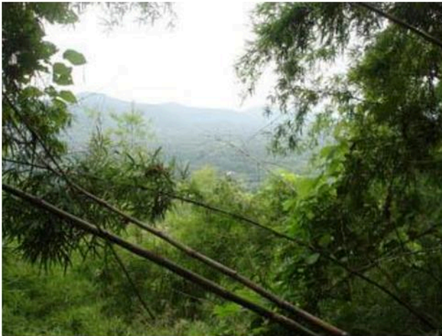
สภาพแวดล้อมหน้าปากถ้ำโหว้