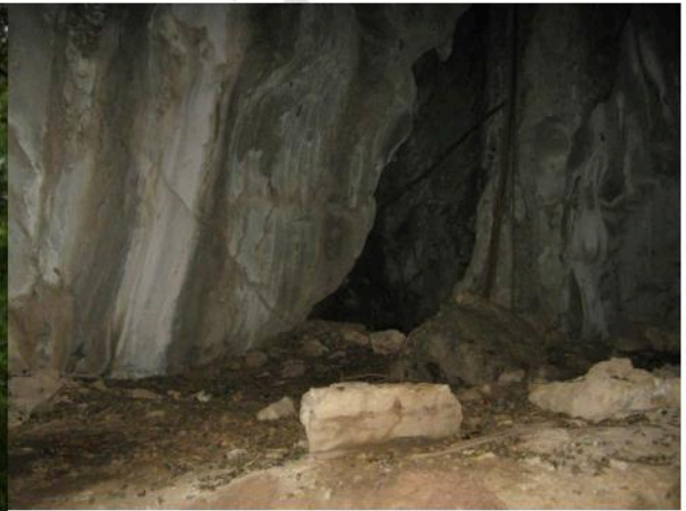
สภาพทั่วไปภายในปากถ้ำโหว้