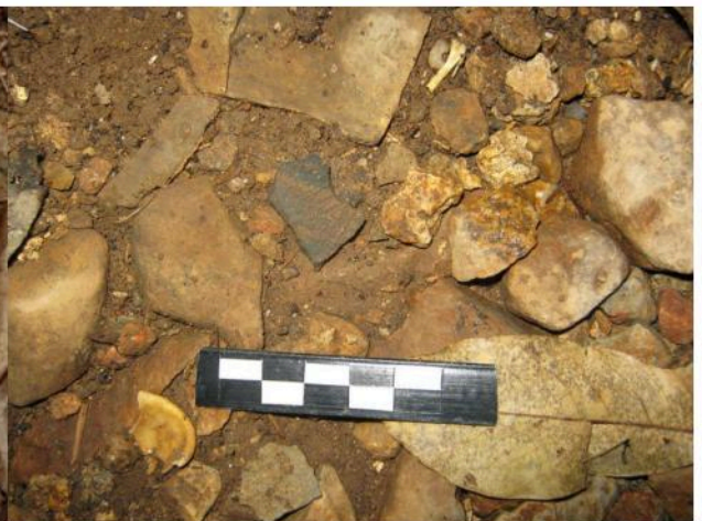
ชั้นส่วนภาชนะดินเผาตกแต่งด้วยลายกุดประทับ