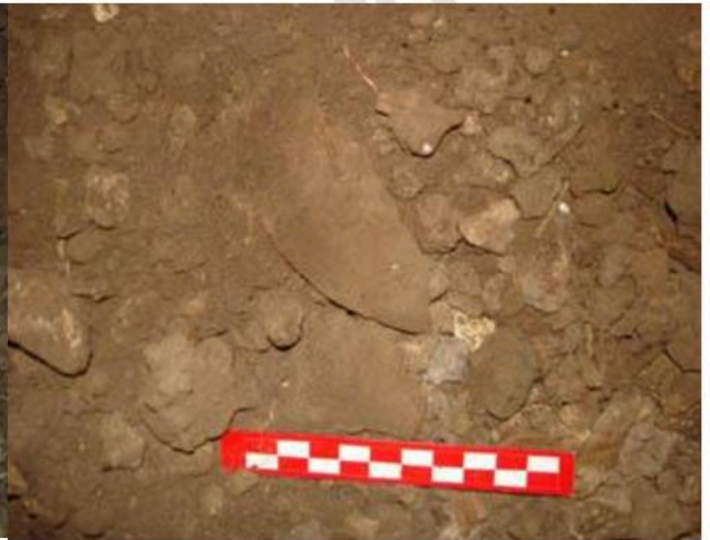
ชั้นส่วนภาชนะดินเผาแบบผิวเรียบพบภายในคูหาถ้ำโหว้