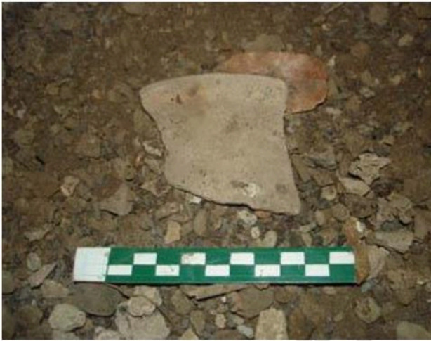
ชั้นส่วนปากภาชนะดินเผาพบภายในคูหาถ้ำโหว้