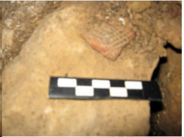
ชั้นส่วนภาชนะดินเผาตกแต่งด้วยลายกดประทับพบภายในคูหาถ้ำโหว้