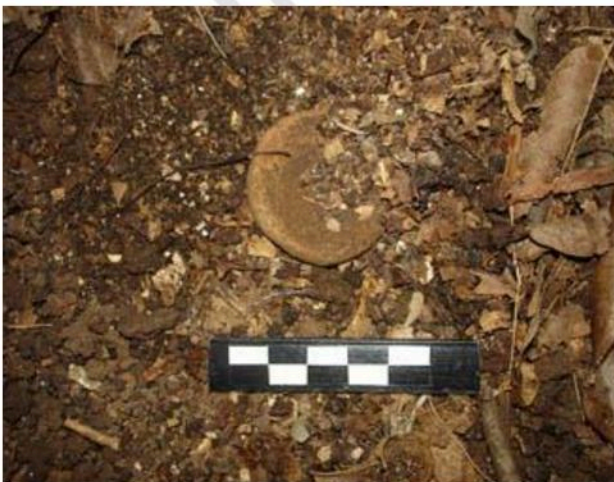
ตะกอนดินเผาพบภายในคูหาถ้ำโหว้