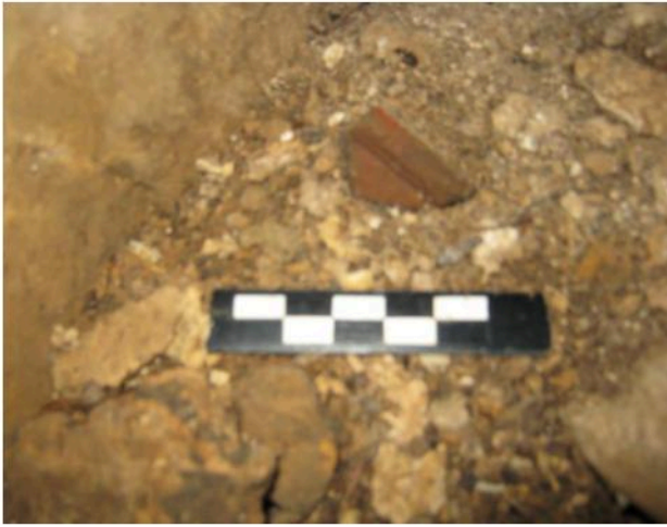
ชั้นส่วนขอบปากภาชนะดินเผาพบภายในคูหาถ้ำโหว้