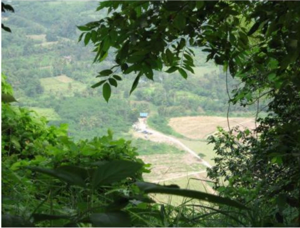
สภาพแหล่งโบราณคดีถ่ายมาจากยอดเขาถ้ำเสือ