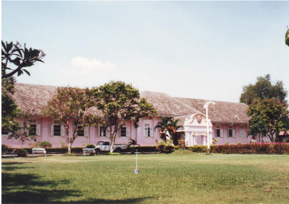
อาคารศาลากลางจังหวัดราชบุรี (เดิม)