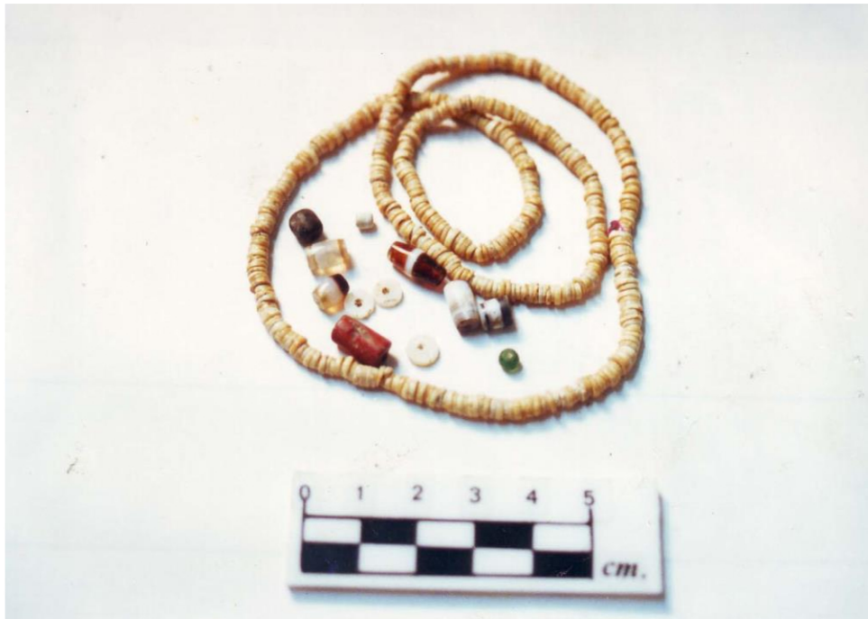
ลูกปัดหิน และลูกปัดแก้ว พบบริเวณเชิงเขาหนองศาลเจ้า