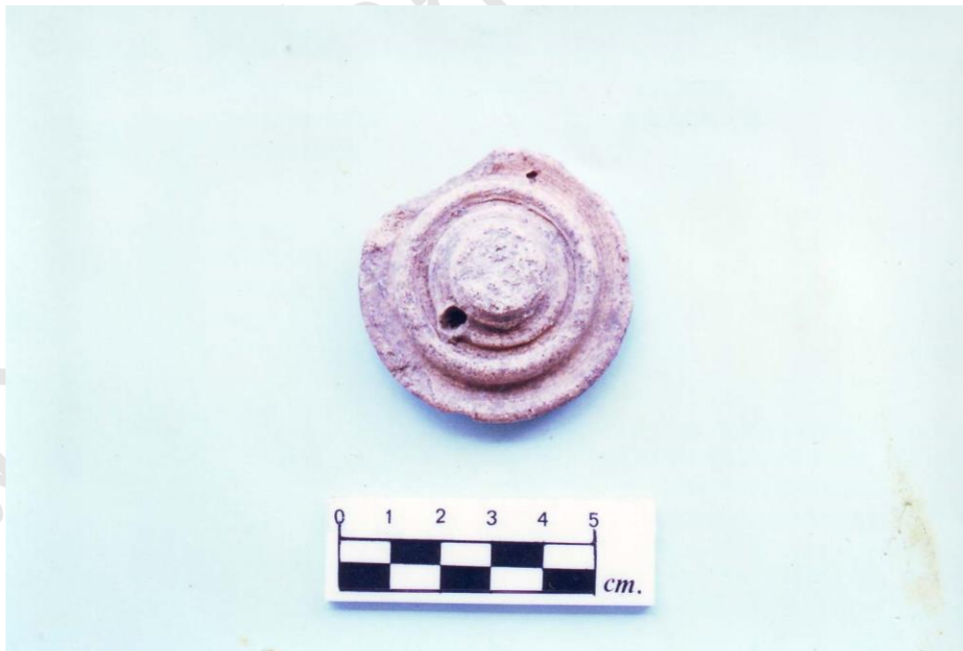
ฝาจุกภาชนะดินเผา พบบริเวณเชิงเขาหนองศาลเจ้า