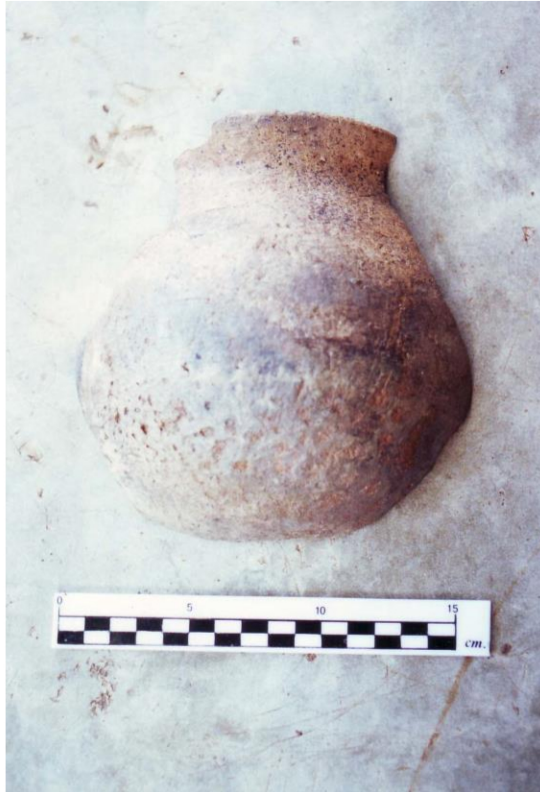
ชิ้นส่วนของหม้อดินเผา เนื้อหยาบ พบจากในถ้ำหนองศาลเจ้า