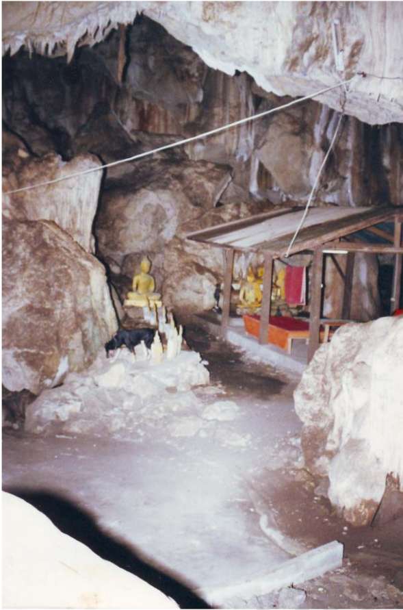
ถ้ำหนองศาลเจ้า