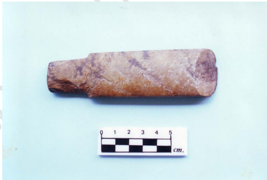
ขวานหินขัด ชนิดมีบ่า พบจากในถ้ำหนองศาลเจ้า