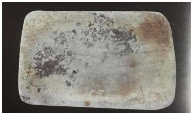
ภาพที่ 39 แท่นหินบด

4.4 แท่นหินบด จำนวน ๑ ชิ้น เป็นแผ่นแบน รูปสี่เหลี่ยมผืนผ้า ผิวเรียบและด้านหนึ่งมีรอยบดจนสีก