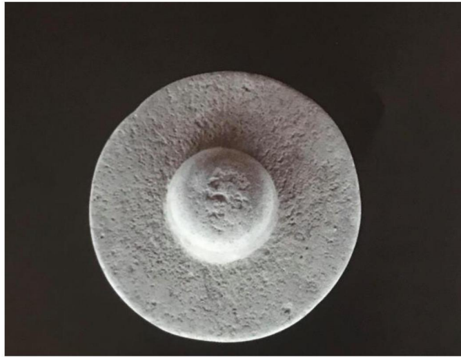
ภาพที่ 36 เครื่องมือหินขนาดใหญ่รูปทรงคล้ายโม้

4.1 แผ่นหินกลมขนาดใหญ่ ขนาดเส้นผ่าศูนย์กลาง ๓๙ เซนติเมตร หนา ๙.๕ เซนติเมตร ลู่ง ๒๐ เซนติเมตร รูปทรงภายนอกคล้ายโม้ตรงกลางนูนสูง ผิวเรียบ สันนิษฐานว่าอาจเป็นเครื่องมือที่ใช้ในการบอแม็ดพืชหรือแป้ง