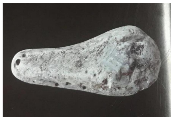
ภาพที่ 40 เครื่องมือหิน

4.5 เครื่องมือหิน ส่วนบนลักษณะคล้ายด้ามหรือเป็นที่จับบางกว่าส่วนล่างซึ่งเป็นทรงกลมโค้งหนา ด้านหนึ่งจะแบนกว่าอีกด้าน เนื้อหินสีเทาพบจำนวน ๑ ชิ้น