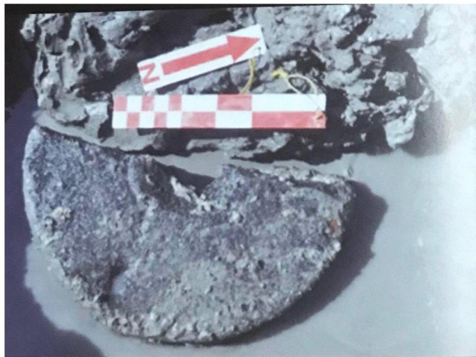
ภาพที่ 37 แผ่นหินรูปครึ่งวงกลม เจาะรูตรงกลาง

4.2 แผ่นหินรูปทรงกลม ขนาดเส้นผ่าศูนย์กลาง ๔๗ เซนติเมตร หนา ๗ เซนติเมตร ภาพไม่สมบูรณ์แตกออกเป็นสองชิ้น ตรงกลางเจาะรูรูปร่างกลม แต่ รอบ ๆ รู มีการเซาะผิวหินให้เป็นรูปสี่เหลี่ยม เนื้อหินหยาบสีดำ พบอยู่ในบริเวณใกล้กับปลายของเสากระโดงเรือต้นที่สอง