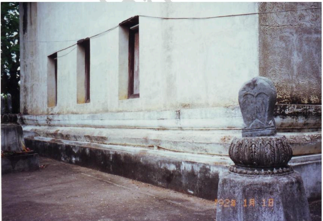
ฐานอุโบสถเป็นแบบฐานสิงห์ รอบอุโบสถมีแท่นตั้งใบเสมาที่สลักจากหินแกรนิต