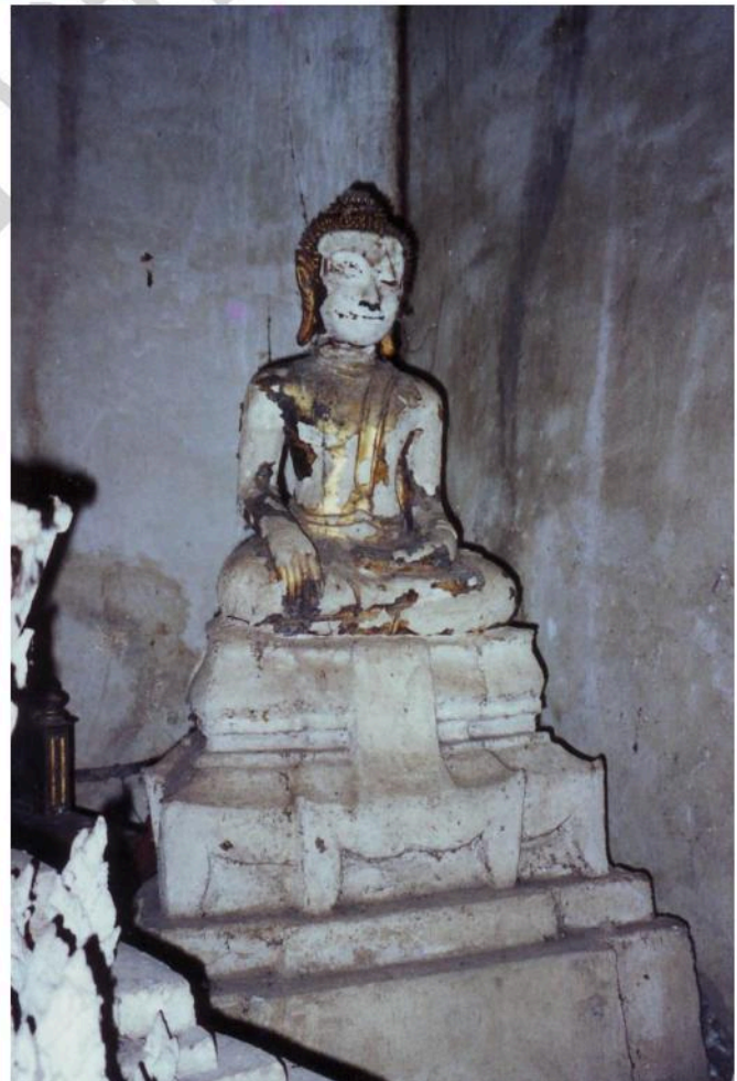
พระพุทธรูปในอุโบสถ วัดเขาน้อย