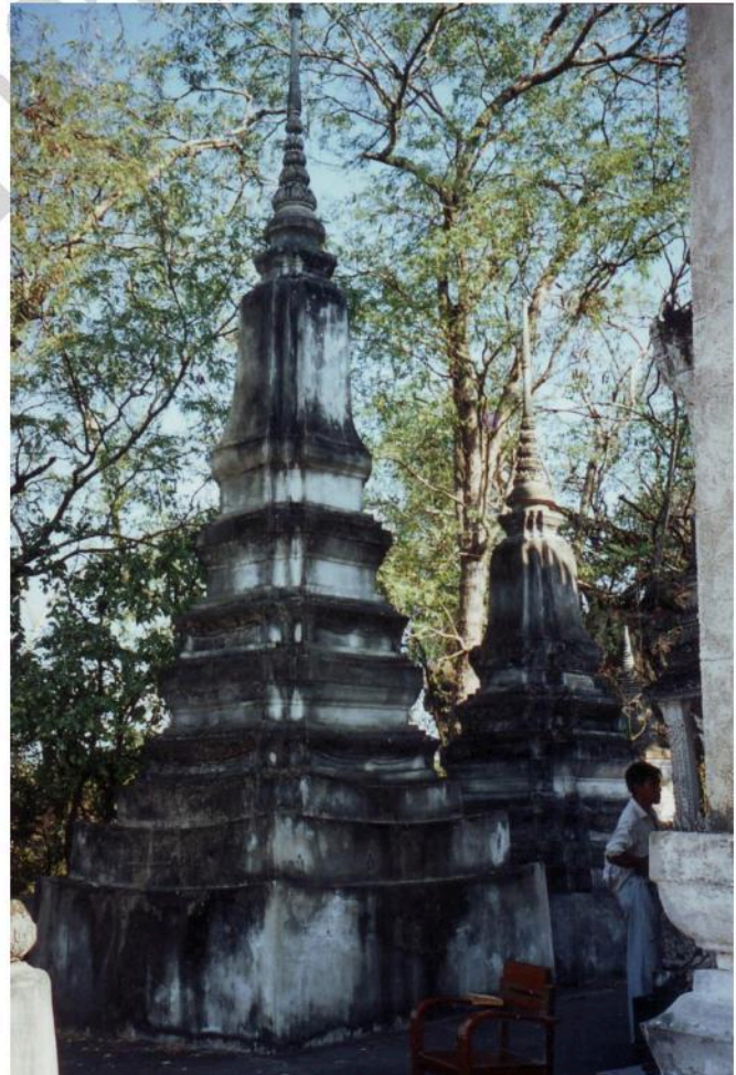
เจดีย์ ด้านหน้าอุโบสถ วัดเขาน้อย เป็นเจดีย์ย่อมุมไม้สิบสอง