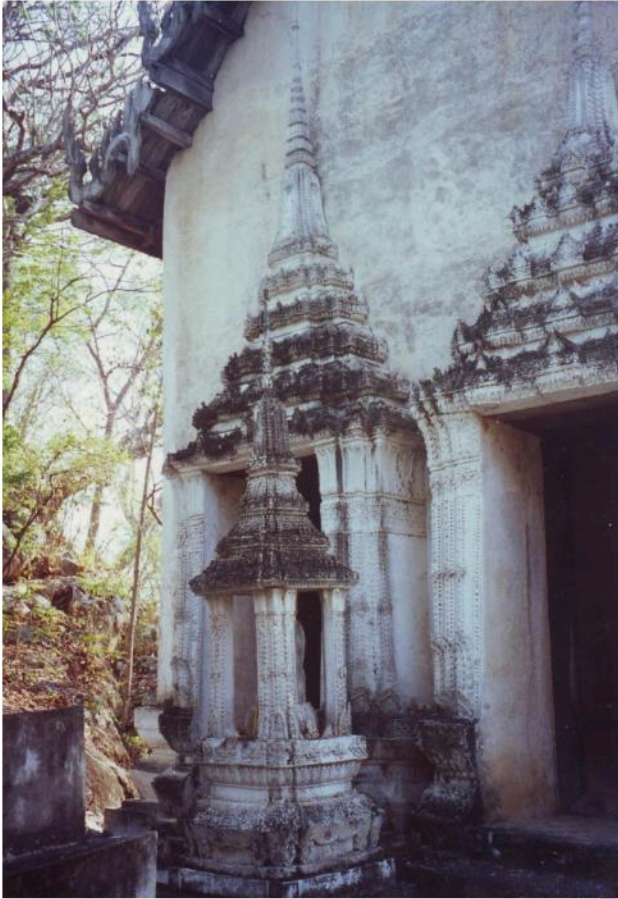
ซุ้มประตูโบสถ์ วัดเขาน้อย เป็นซุ้มทรงมงกุฏ