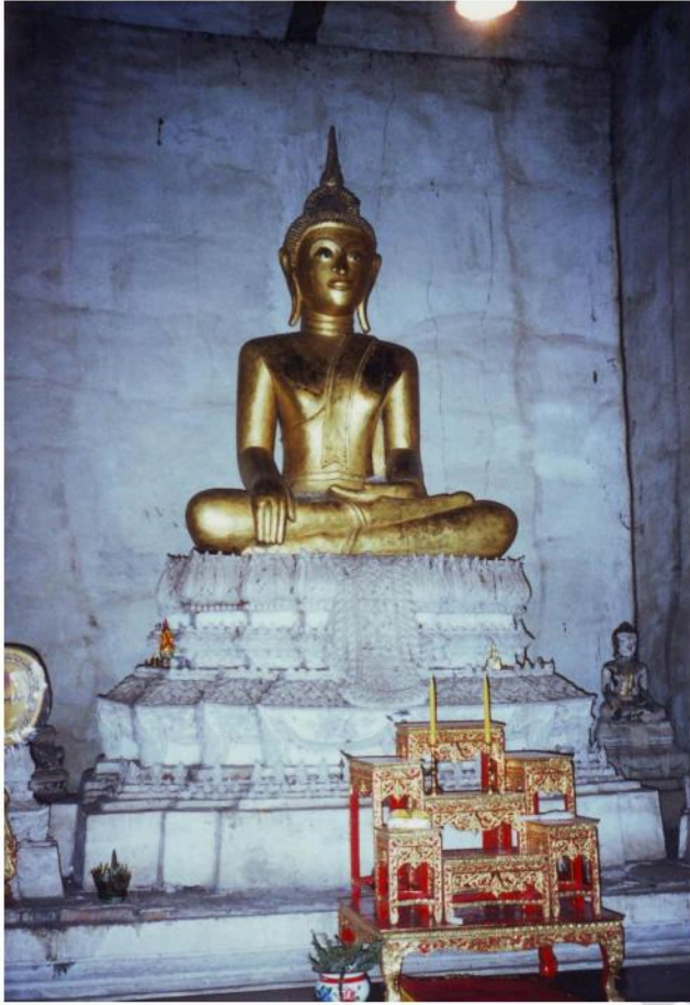
พระประธานในอุโบสถ วัดเขาน้อย