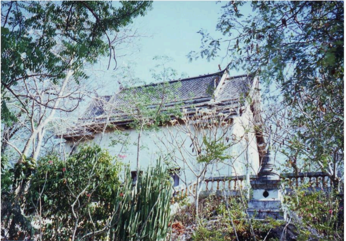
อุโบสถวัดเขาน้อยตั้งอยู่บนเนินเขา เป็นอุโบสถเก่าแต่ได้รับการซ่อมแซมมาโดยตลอด