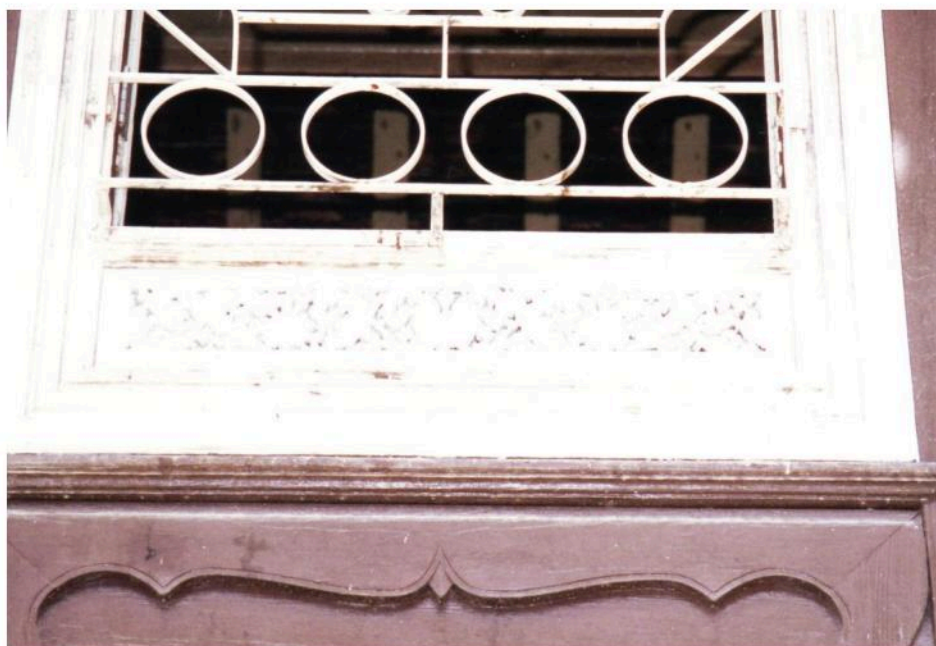
หย่องหน้าต่าง ภูมิสงฆ์ เป็นไม้แกะสลักลวดลายละเอียดงดงาม