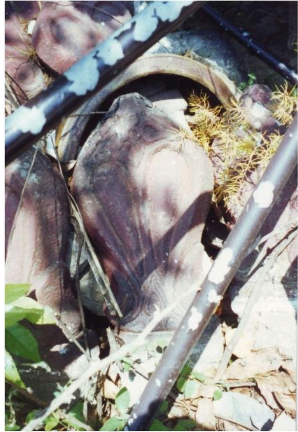
เสมาวัดจันทราวาส