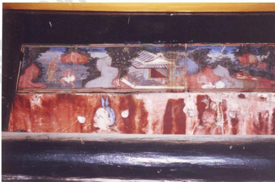
ภาพเขียนบนแผ่นไม้ เหนือคาน ในศาลาการเปรียญ วัดจันทราวาส