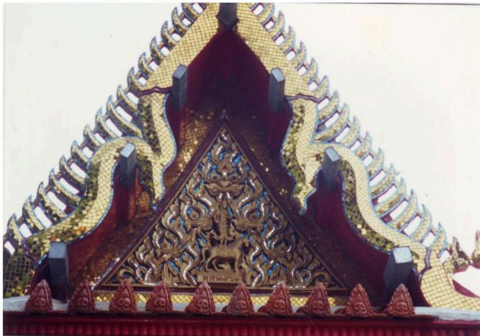
หน้าบันศาลาท่าน้ำ เป็นไม้แกะสลัก ประดับกระจกสีมีตัวอักษร ระบุปีสร้าง คือ พ.ศ. 2461