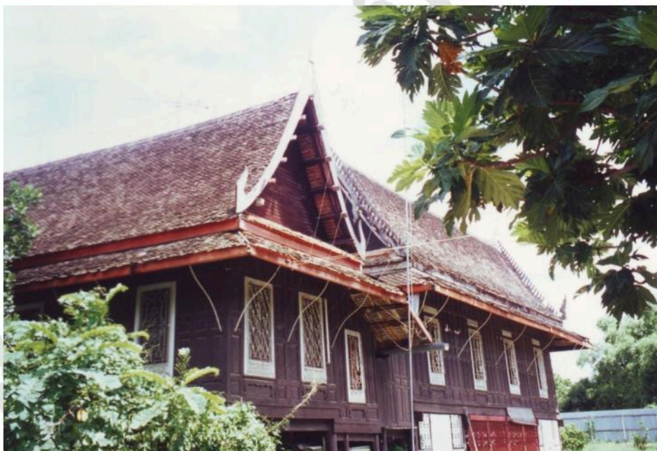
หมุกุฎิสงฆ์ เป็นเรือนไม้ทรงไทย ขนาดใหญ่ หลังคาประดับเครื่องลำยอง