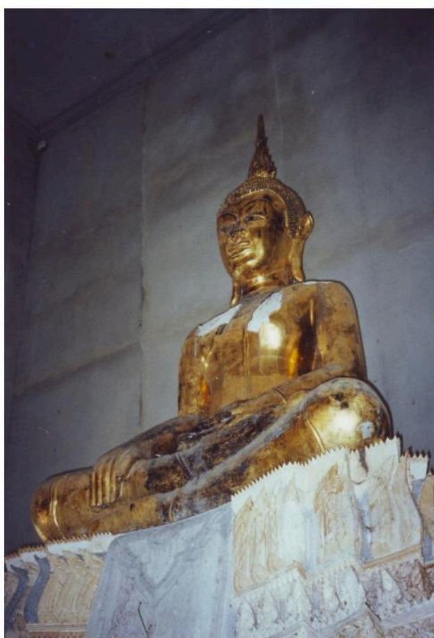
พระประธานในอุโบสถ วัดจันทราวาส