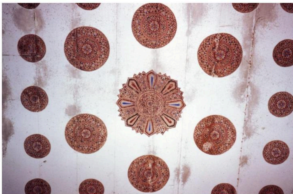
ลายดาวเพดาน บนเพดานศาลาการเปรียญ