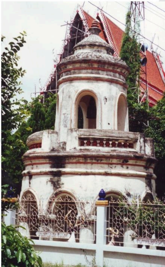
หอร่ม เป็นอาคารประยุกต์ อิทธิพลศิลปะ ตะวันตก รูปโดมคล้ายหอชัชวาลเวียงชัย บนพระนครคีรี