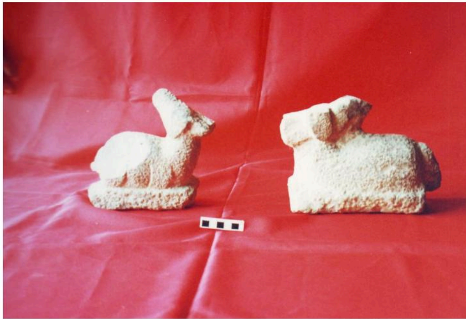
โกลกวางหมอบ ปัจจุบันอยู่ที่วัดหนองปรุง