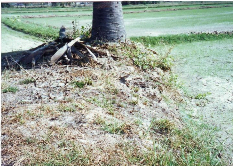
เนินดิน มีเศษชิ้นส่วนอิฐและสะเก็ดหิน กระจายปะปนกันอยู่