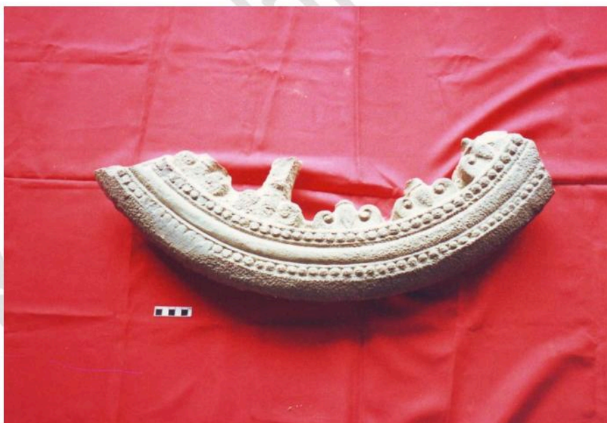
ชิ้นส่วนธรรมจักร ปัจจุบันอยู่ที่วัดหนองปรัง