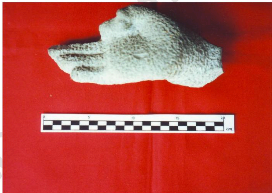
ชิ้นส่วนโกลกนหัตถ์พระพุทธรูป