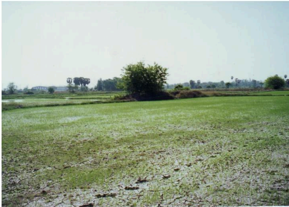
สภาพแหล่งโบราณคดีหนองปรัง ปัจจุบันเป็นดินนา