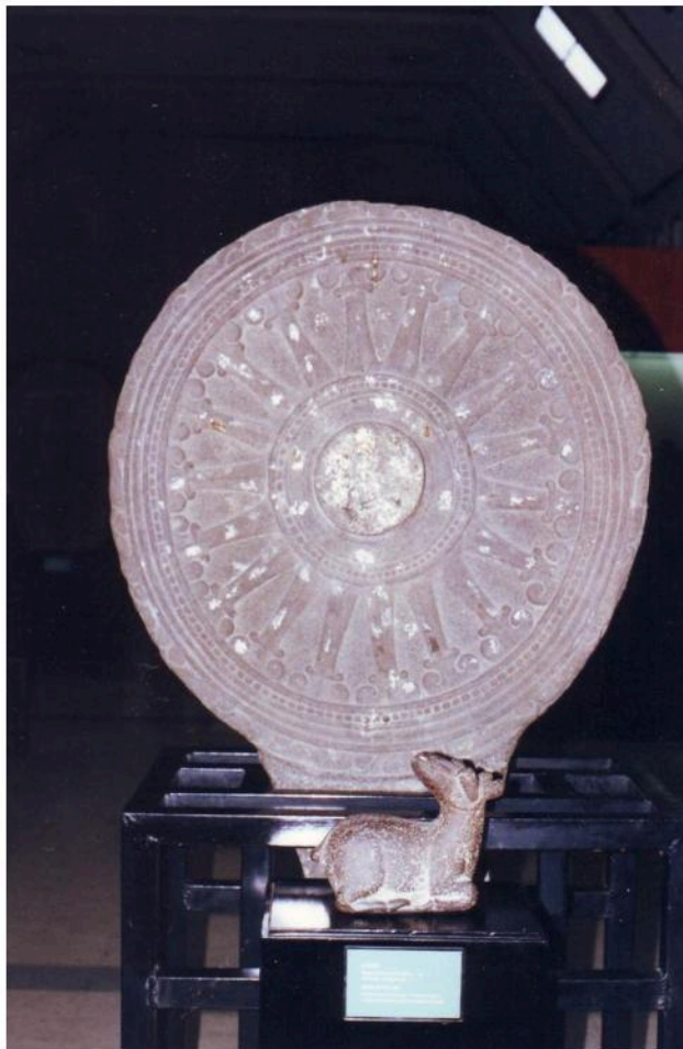
โกลนธรรมจักรที่พบในหินาของนายชั้น แจ่มหล้าปัจจุบันจัดแสดงใน พิพิธภัณฑสถานแห่งชาติ พระนคร