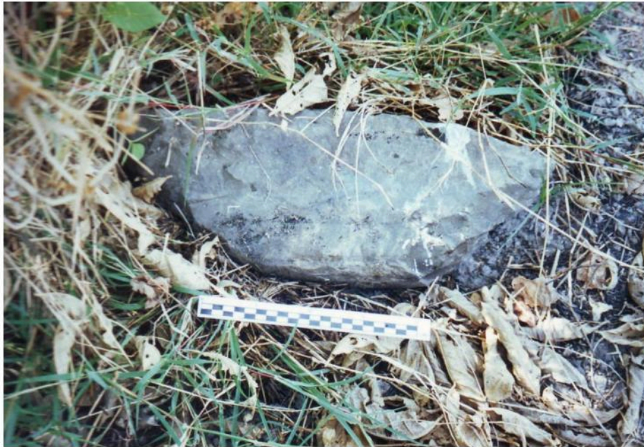
โกลงนแท่นหินบด พบเป็นจำนวนมากในแหล่งโบราณคดีหนองปรุง