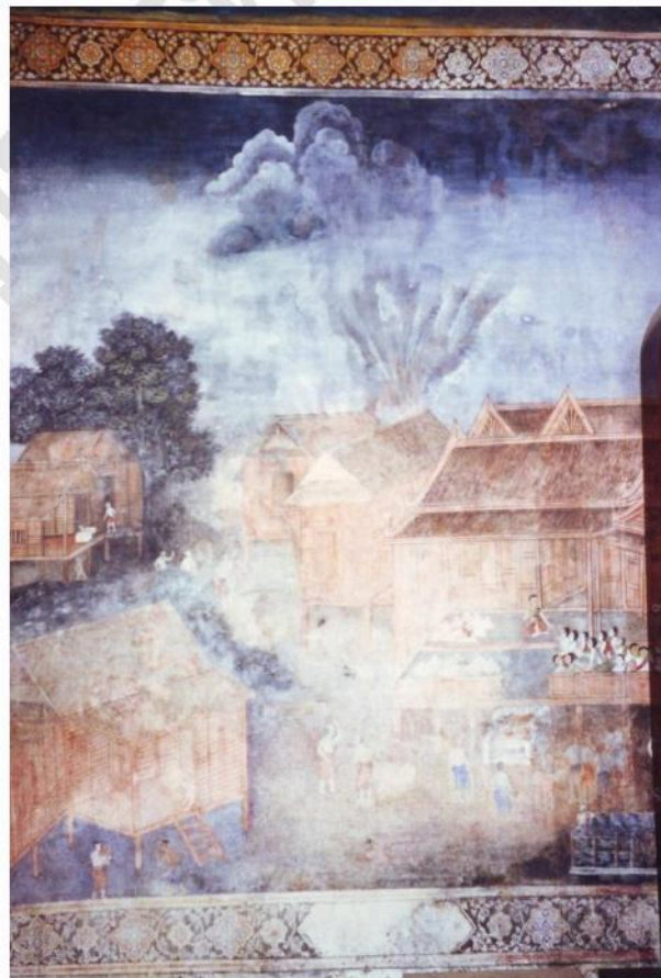
ผนังในระดับช่องหน้าต่าง เขียนภาพเรื่องชีวิต และประเพณีไทย สะท้อนให้เห็นภาพอาคาร บ้านเรือน ในยุคสมัยนั้น