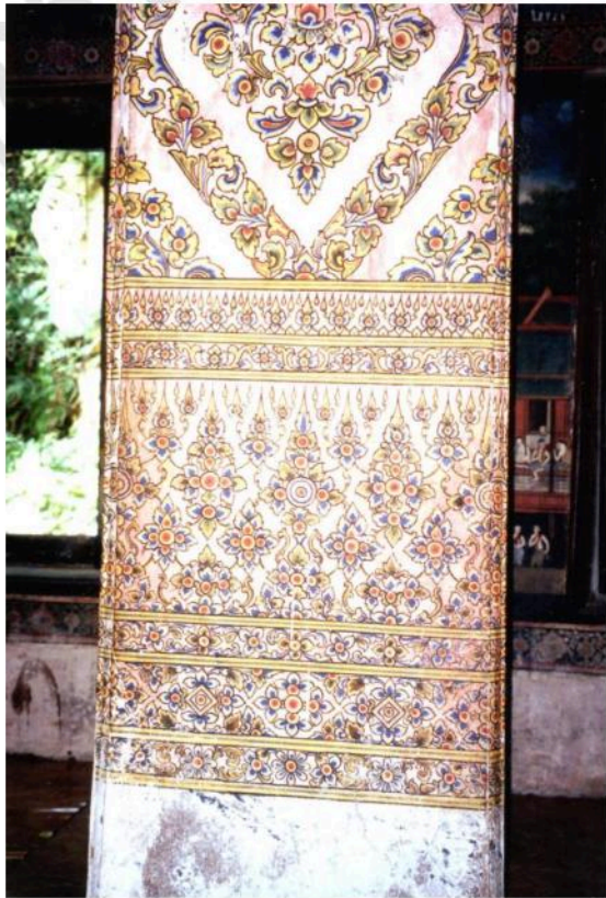
เสาอุโบสถวัดมหาสมณาราม เขียนลายพุ่ม ข้าวบิณฑ์ลายเชิง และลายรดเกล้าเหมือนกัน ทุกต้น