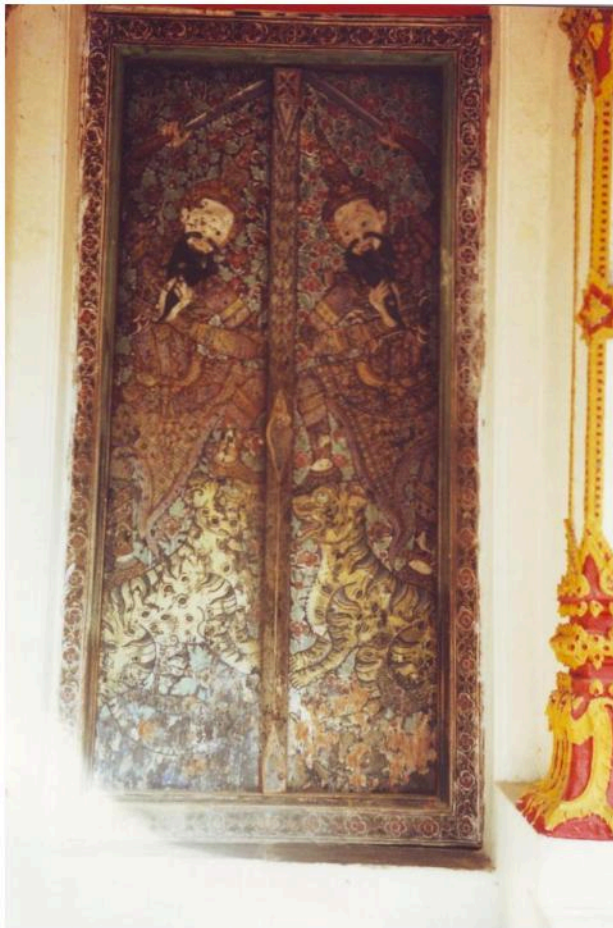
บานประตูด้านหน้าอุโบสถ เขียนรูปเสี้ยววงเหียบเสื่อ