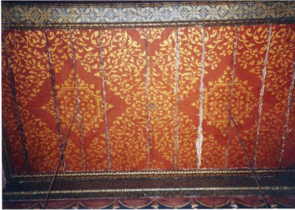
ลายบนเพดานอุโบสถวัดมหาสมณาราม ปรุสายทองล่องชาด