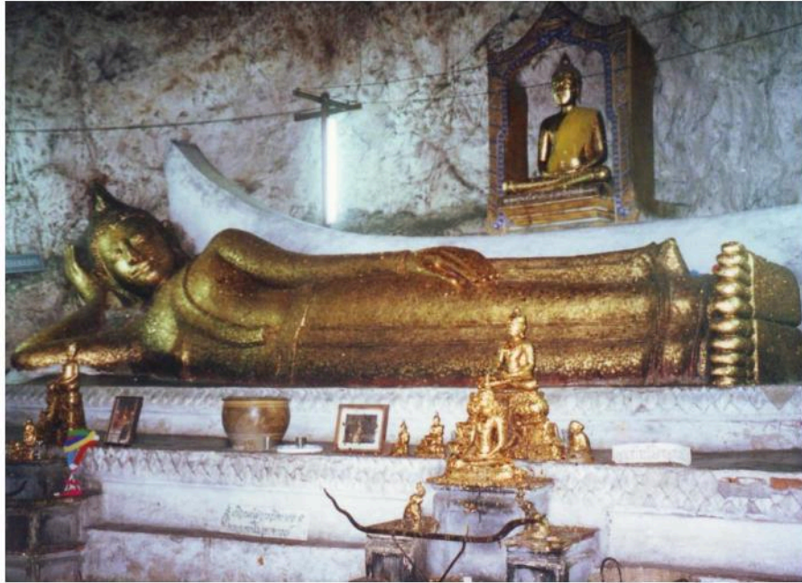
พระพุทธรไสยาสน์ ในถ้ำพระพุทธรโฆษาจารย์ หลังวัดมหาสมณาราม