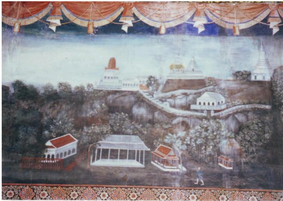
ภาพจิตรกรรมฝาผนังด้านทิศใต้ อุโบสถวัดมหาสมณาราม เขียนภาพพระนครคีรี