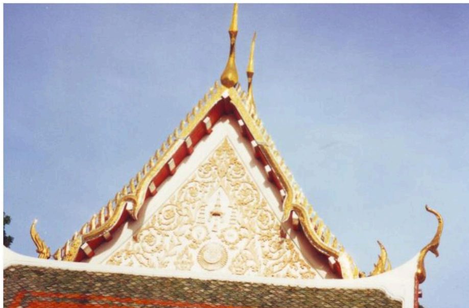
หน้าบันอุโบสถวัดมหาสมณาราม ด้านทิศตะวันออกประดับลายปูนปั้น รูปพระมหามงกุฏขนาดข้างด้วยฉัตร

เสมาอุโบสถวัดมหาสมณาราม เป็นหินอ่อนจำหลัก ทรงสี่เหลี่ยมตามแบบนิยมสมัยรัชกาลที่ 4