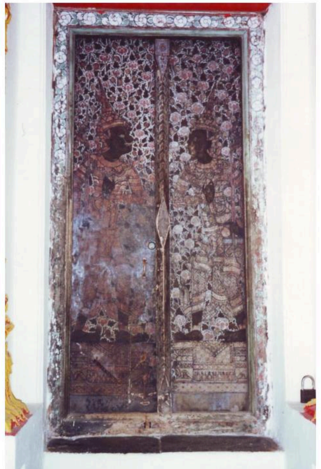
บานประตูด้านหลัง เขียนรูปเทพวาระบาลถือคันศร