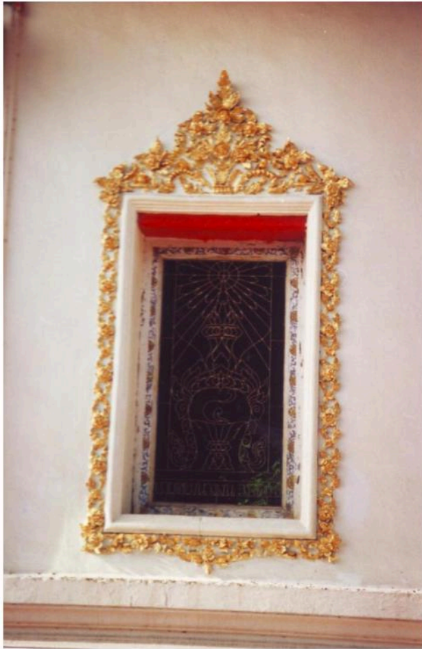
หน้าต่างอุโบสถวัดมหาสมณาราม ตกแต่งซุ้มด้วยปูนปั้น ลายดอกพุดตาลโบเทศ