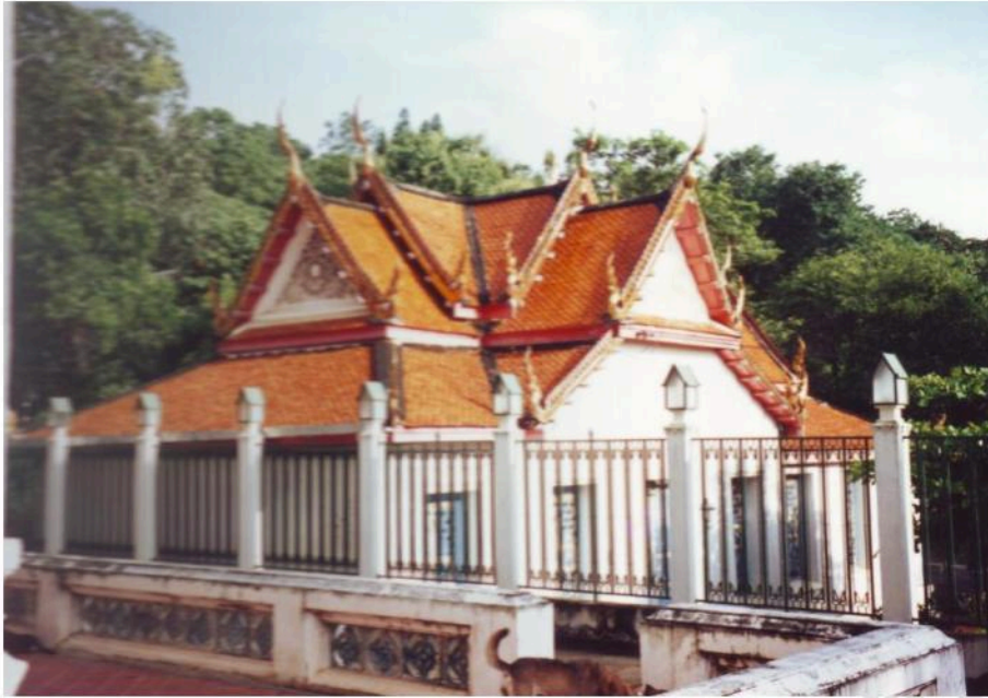
วิหารทรงจตุรมุข เชื่อกันว่าเป็นที่ประทับของรัชกาลที่ 4 เมื่อครั้งดำรงเพศบรรชิต