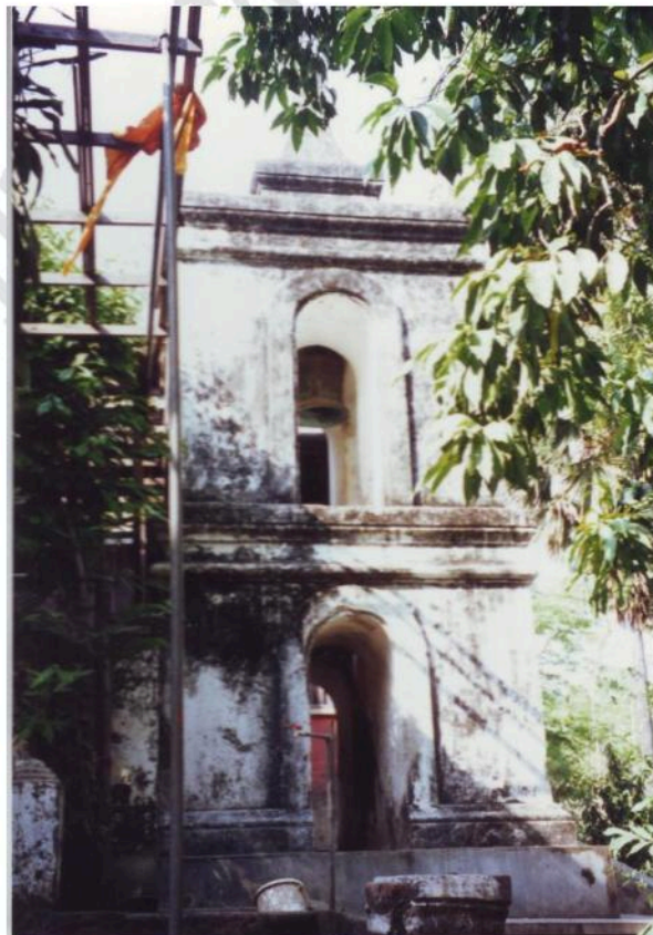
หอรบขัง วัดมหาสมณาราม เป็นอาคารประยุกต์ ทรงสี่เหลี่ยม