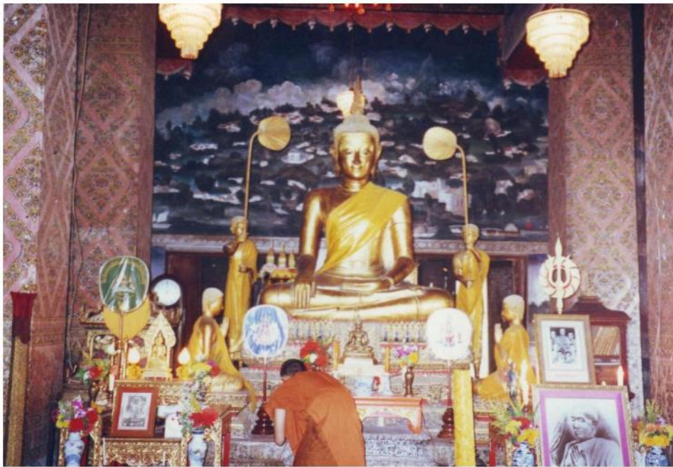
พระประธานในอุโบสถ วัดมหาสมณาราม