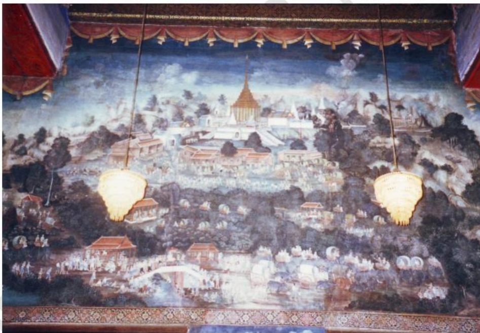
ภาพจิตรกรรมฝาผนังภายในอุโบสถ ด้านหน้าพระประธานเป็นภาพเรื่องราวไปมณัสการพระพุทบาทสระบุรี