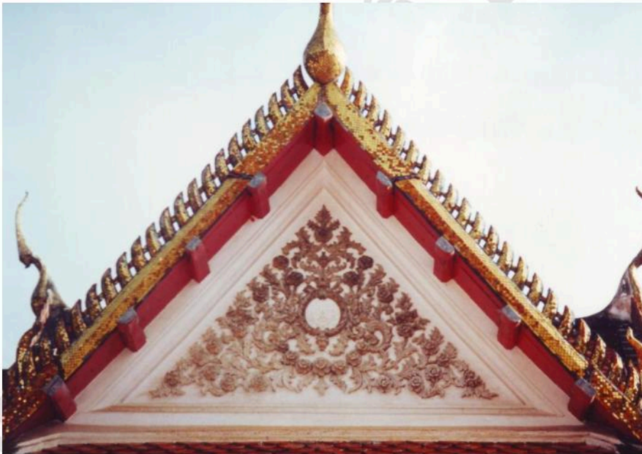
หน้าบันวิหาร ทรงจตุรมุข ตกแต่งลวดลายปูนปั้น