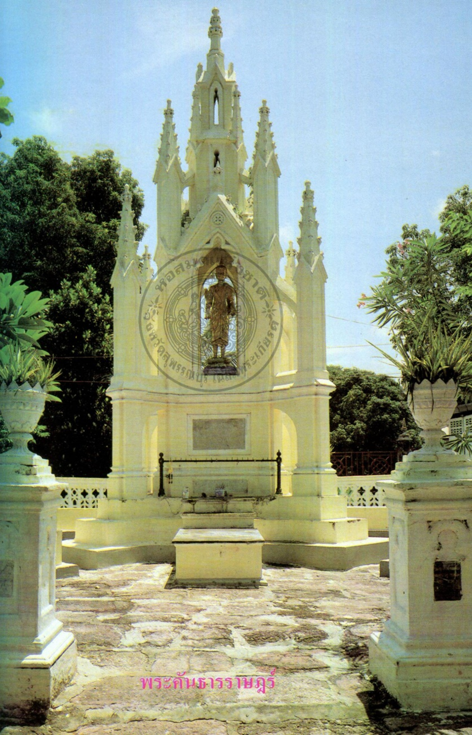
พระคันธารราษฎร์