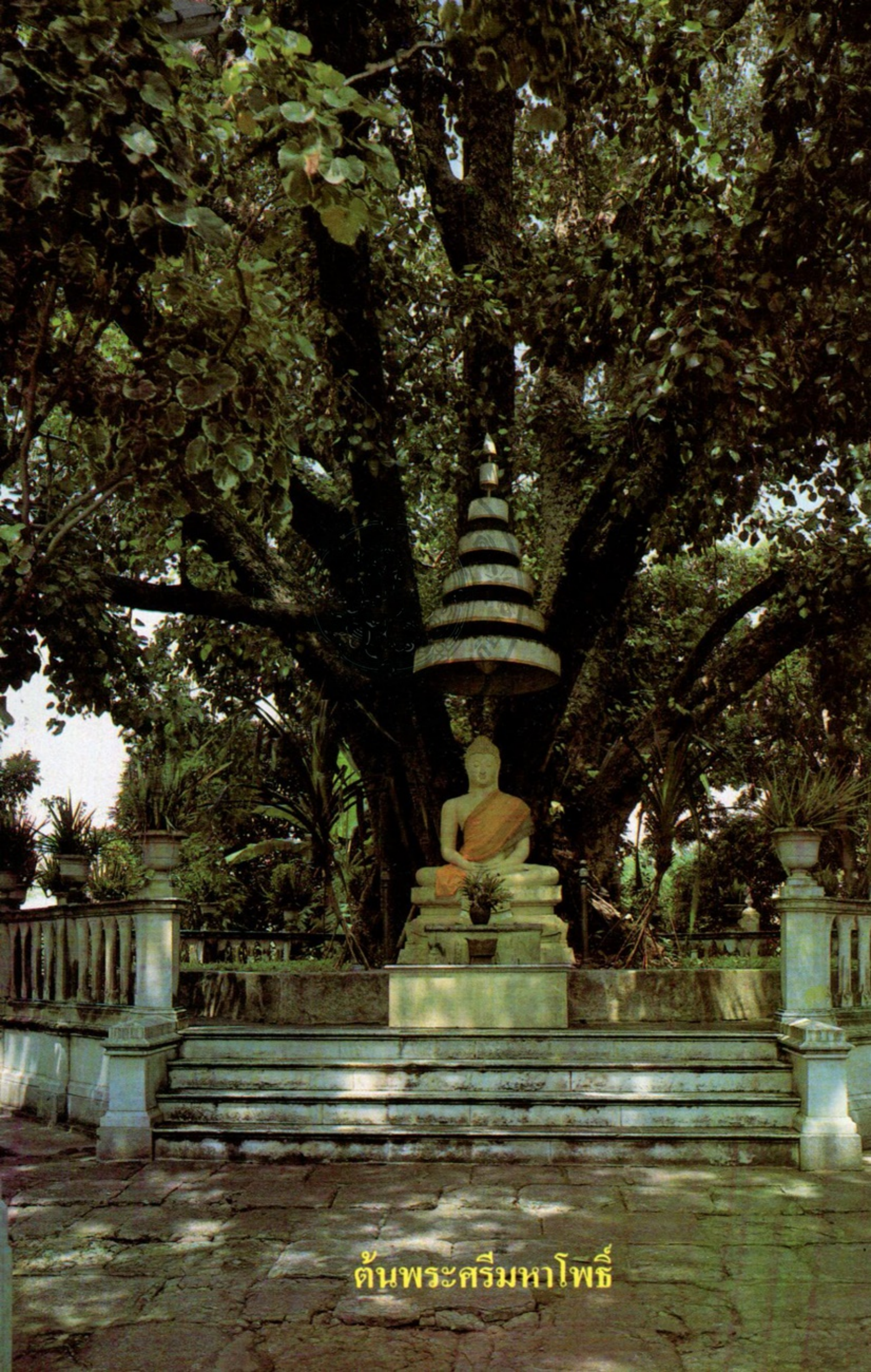
ต้นพระศรีมหาโพธิ์