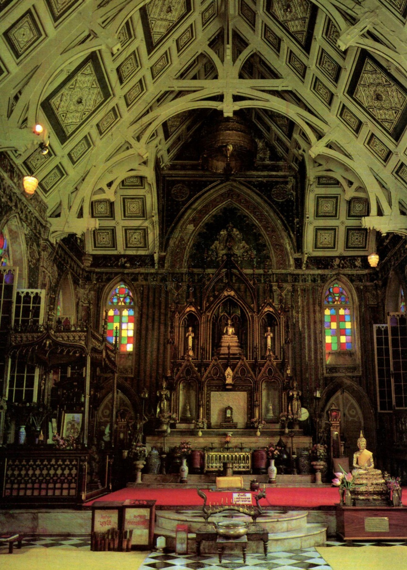
ภายในพระอุโบสถ