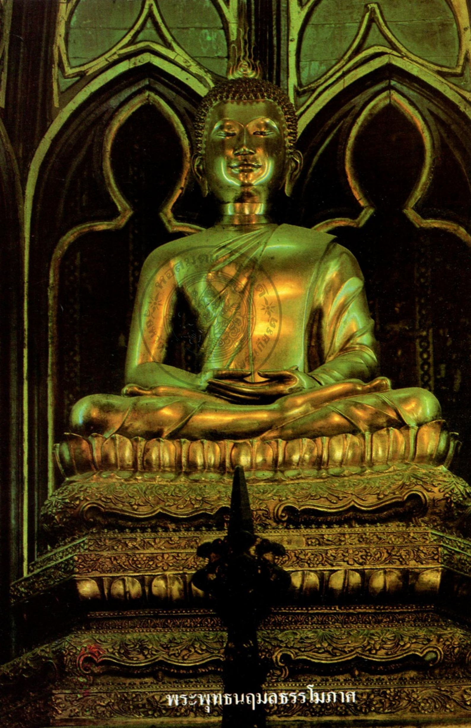
พระพุทธนฤมลธรรโมภาส