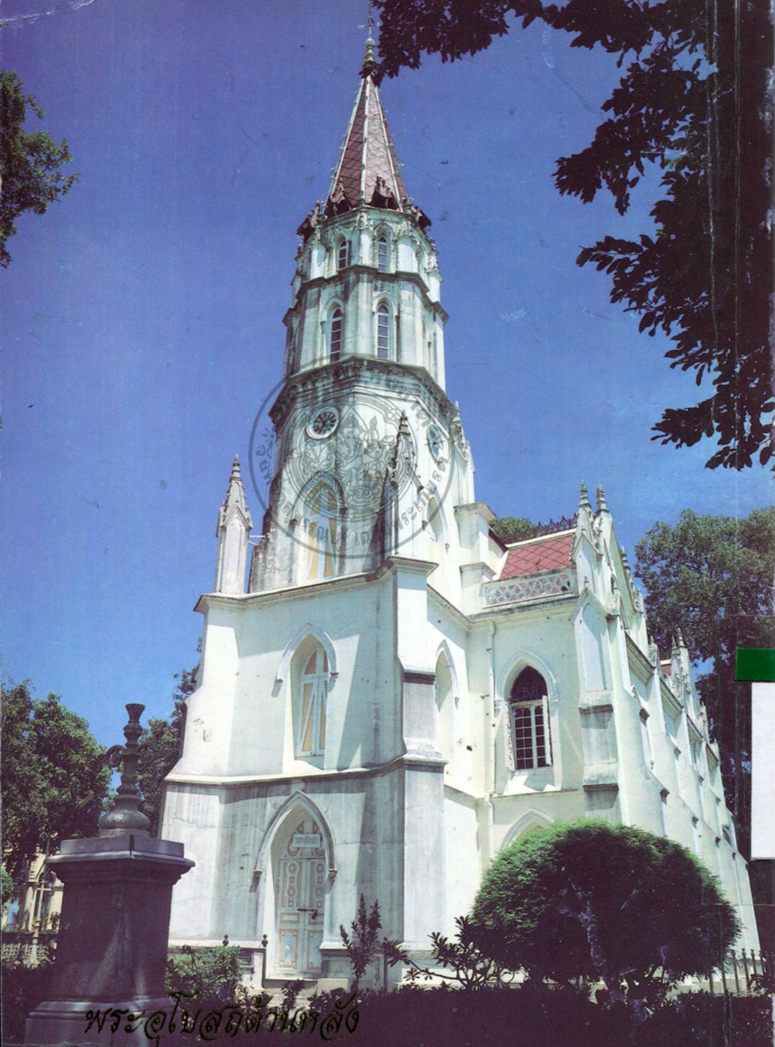
พระอโศกตัดทอนแล้ว