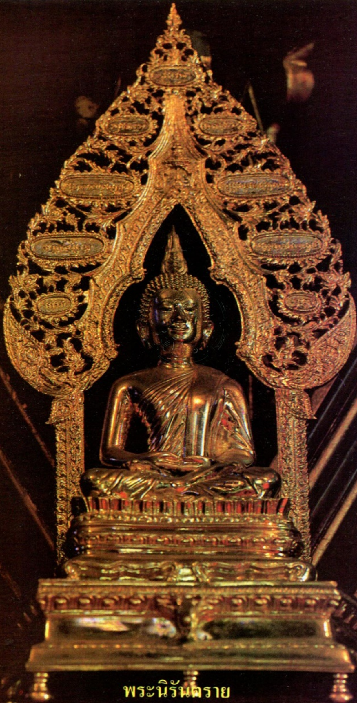
พระนirmanทราย