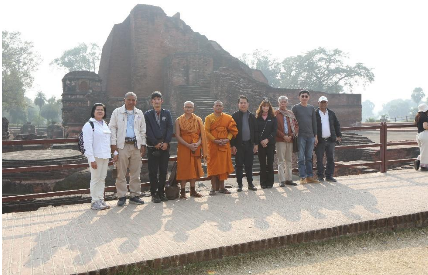
มหาวิทยาลัย นาลันทา