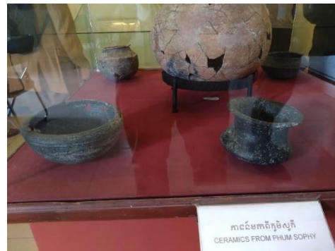
ภาพที่ ๑๑ - ๑๒ (ภาพซ้าย) พิพิธภัณฑ์จังหวัดบ่อนเตี้ยเมียนเจียจัดแสดงหลุมฝังศพของมนุษย์ที่มีสถานะสูงของแหล่งโบราณคดี Kok Treas โดยมีการจัดทำของศพอยู่ในท่าอเข่าขึ้น พร้อมทั้งอุทิศภาชนะสำริด และลูกปัดแก้ว ซึ่งเป็นของต่างถิ่นให้แก่ศพด้วย (ภาพขวา) แสดงภาชนะดินเผาในแหล่งโบราณคดี Phum Sophy ซึ่งถึงความสัมพันธ์อย่างใกล้ชิดกับภาชนะดินเผาพิมายดำที่พบในประเทศไทย