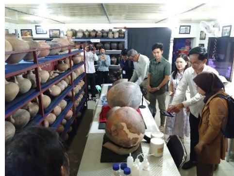
ภาพที่ ๑๓ - ๑๔ แสดงพื้นที่จัดเก็บภาชนะดินเผาภายในห้องปฏิบัติการเพื่อการอนุรักษ์ของพิพิธภัณฑ์จังหวัดบ่อนเตี้ยเมียนเจีย