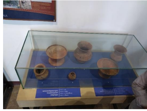
ภาพที่ ๙ - ๑๐ พิพิธภัณฑ์จังหวัดพระตะบองจัดแสดงโบราณวัตถุสมัยก่อนประวัติศาสตร์ของแหล่ง Laang Spean ซึ่งเป็นแหล่งตัวแทนในยุค Neolithic ที่สำคัญเพียง ๑ ใน ๒ แห่งของกัมพูชา