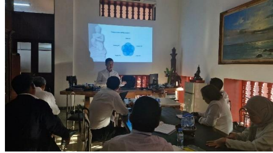
ภาพที่ ๓ - ๔ (ภาพซ้าย) เข้าเยี่ยมชมการจัดแสดงโบราณวัตถุ (ภาพขวา) รับฟังการบรรยายจากผู้อำนวยการพิพิธภัณฑสถานแห่งชาติกัมพูชา กรุงเทพมหานคร