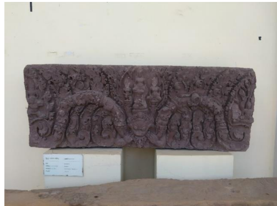
ภาพที่ ๗ - ๘ (ภาพซ้าย) เข้าเยี่ยมชมการจัดแสดงโบราณวัตถุภายในพิพิธภัณฑสถานจังหวัดพระตะบองโดยมีภัณฑารักษ์เป็นผู้บรรยายนำชม (ภาพขวา) แสดงลักษณะการจัดแสดงโบราณวัตถุ โดยจะมีป้ายให้ข้อมูลโดยสังเขปกับโบราณวัตถุแต่ละชิ้น