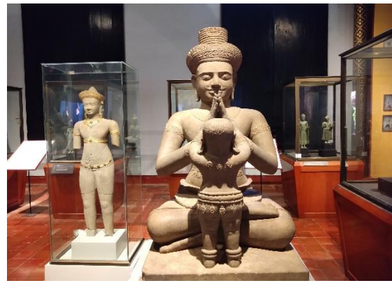
ภาพที่ ๕ - ๖ (ภาพซ้าย) พิพิธภัณฑสถานแห่งชาติกัมพูชา กรุงเทพมหานคร จัดแสดงโบราณวัตถุชิ้นเยี่ยมของกัมพูชาเป็นโบราณวัตถุที่ได้จากการบูรณะปราสาทเกาะแกร์ (ภาพขวา) เป็นโบราณวัตถุที่ได้จากการส่งมอบคืนจากประเทศอังกฤษเมื่อปี พ.ศ. ๒๕๖๔