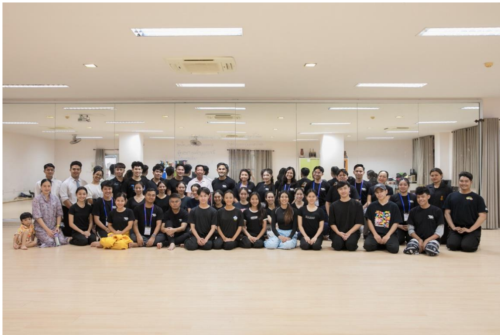
ภาพบรรยากาศการฝึกซ้อมการแสดง ณ มหาวิทยาลัยราชภัฏสงขลา