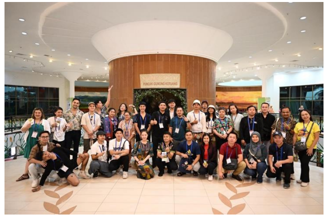
ภาพการเยี่ยมชมทัศนศึกษาพิพิธภัณฑ์ข้าว ณ สหพันธรัฐมาเลเซีย