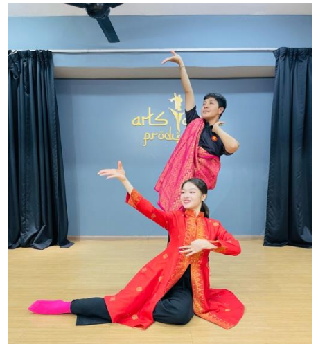
ฝึกซ้อมการแสดงฟิธิปัด ณ สตูดิโออาร์ตทาลันโปรดักชั่น กรุงกัวลาลัมเปอร์ สหพันธรัฐมาเลเซีย