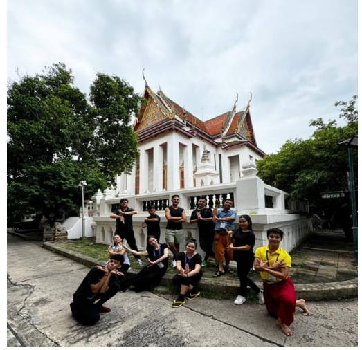
การทำกิจกรรมเวิร์คช็อปทางด้านเพิ่มพูนทักษะการแสดงของกลุ่มนักแสดงอาเซียน ณ สถาบันบัณฑิตพัฒนศิลป์