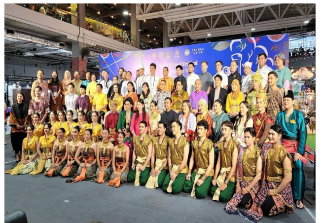
ภาพถ่ายงานการแสดงในไทย ณ ห้างสรรพสินค้าเซ็นทรัลหาดใหญ่ จังหวัดสงขลา