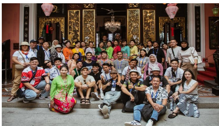
ทัศนศึกษาเยี่ยมชมเมืองเก่าย่านจอร์จทาวน์ บ้านหุ่นกระบอกแต่จิว อูปรากรจีนแต่จิว และถนนสายเมืองเก่าประจำ รัฐปีนัง สหพันธรัฐมาเลเซีย