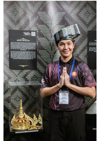
ภาพบรรยากาศงานพิธีเปิดโครงการในกรุงกัวลาลัมเปอร์ สหพันธรัฐมาเลเซีย และพิธีเปิดนิทรรศการเครื่องประดับศิระในภูมิภาคอาเซียน