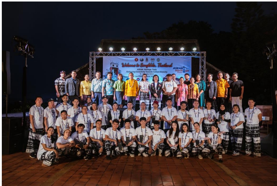
ภาพบรรยากาศงานเลี้ยงต้อนรับผู้เข้าร่วมโครงการและมอบของที่ระลึก ณ มหาวิทยาลัยทักษิณ จังหวัดสงขลา