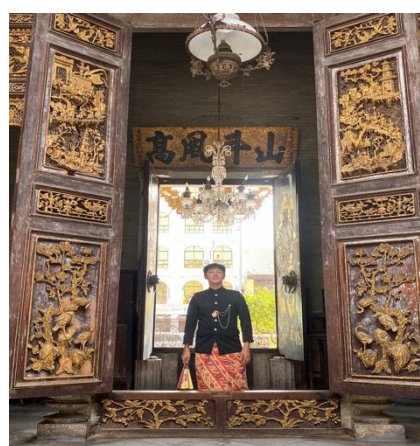
เยี่ยมชมเปอร์รานากันแมนชั่น ณ รัฐปีนัง สหพันธรัฐมาเลเซีย