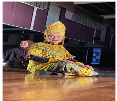
เยี่ยมชมโรงเรียนสอนศิลปะอัสวาร่า ประจำสหพันธรัฐมาเลเซีย และเข้าร่วมกิจกรรมการฝึกหัดการแสดง “รำมะโย่ง” นาฏศิลป์ประจำชาติมาเลเซีย