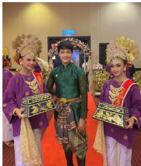
ภาพบรรยากาศงานเลี้ยงต้อนรับ ณ โรงแรมสตาร์ซิตี รัฐเคดาห์ สหพันธรัฐมาเลเซีย