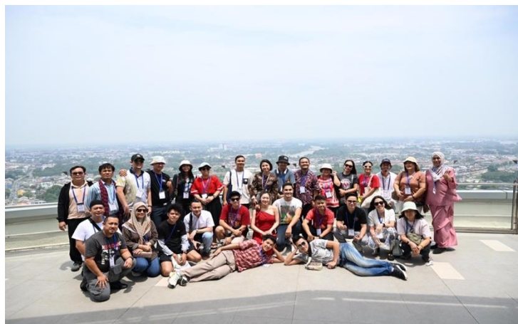
เยี่ยมชมหอคอยอาโรลิตา รัฐเคด้า สหพันธรัฐมาเลเซีย