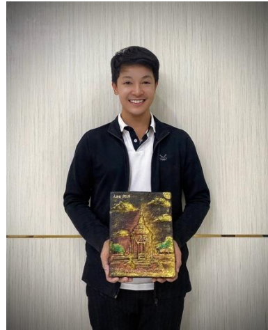
ภาพการเข้าร่วมการสัมมนาการเข้าร่วมกิจกรรมและการทำเวิร์คช็อปในการส่งเสริมงานหัตถกรรม ณ สาธารณรัฐประชาธิปไตยประชาชนลาว