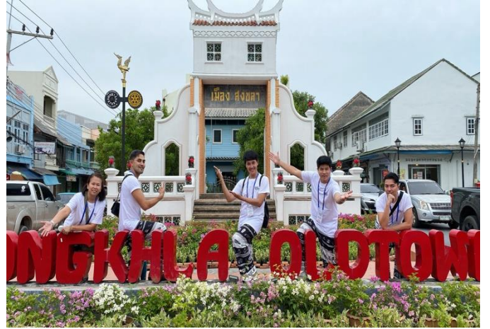
ภาพบรรยากาศการเยี่ยมชมพิพิธภัณฑ์และเมืองเก่าจังหวัดสงขลา