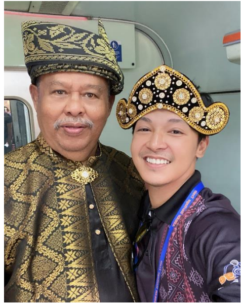
การทำกิจกรรมขนาดนั่งรถไฟจากรัฐเคดัมบุงสู เมืองโกลาลัมเปอร์ สหพันธรัฐมาเลเซีย (กิจกรรมการประดิษฐ์เครื่องประดับศิระและการชมการแสดง)