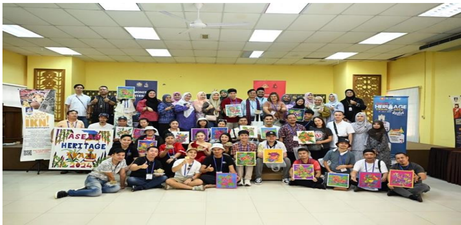
เข้าศึกษาเยี่ยมชมศูนย์ศิลปหัตถกรรมงานปั้นและการทำผ้าบาติก ประจำรัฐเคด้า สหพันธรัฐมาเลเซีย