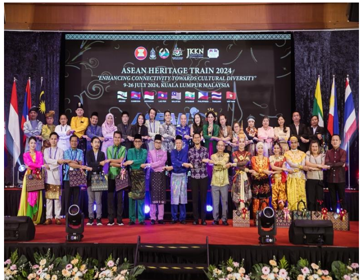
กิจกรรมงานพิธีปิด การแสดงในพิธีปิด รับของที่ระลึก ถ่ายภาพที่ระลึก และกิจกรรมงานเลี้ยง รับประทานอาหาร ณ กรุงกัวลาลัมเปอร์ สหพันธรัฐมาเลเซีย