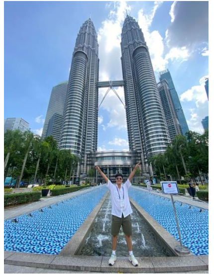
เยี่ยมชมพิพิธภัณฑ์ศิลปะร่วมสมัยและตึกแฝดสแตนเลส ณ กรุงกัวลาลัมเปอร์ สหพันธรัฐมาเลเซีย