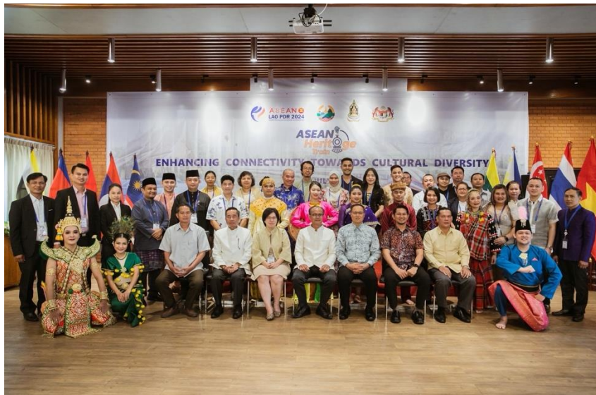
ภาพบรรยากาศการแสดงงานพิธีเปิด ณ สาธารณรัฐประชาธิปไตยประชาชนลาว