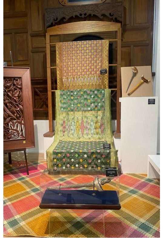
เยี่ยมชมศูนย์ศิลปหัตถกรรมประจำสหพันธรัฐมาเลเซีย