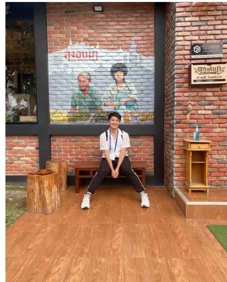
ภาพบรรยากาศการเยี่ยมชมสวนตาลโตนดลุงอนอม และโรงงานจำหน่ายขนมหวานสินค้าที่ระลึกลุงอเนก จังหวัดเพชรบุรี