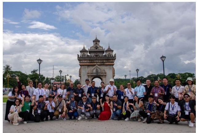
ภาพการรับของที่ระลึกและการถ่ายภาพที่ระลึก ณ สาธารณรัฐประชาธิปไตยประชาชนลาว