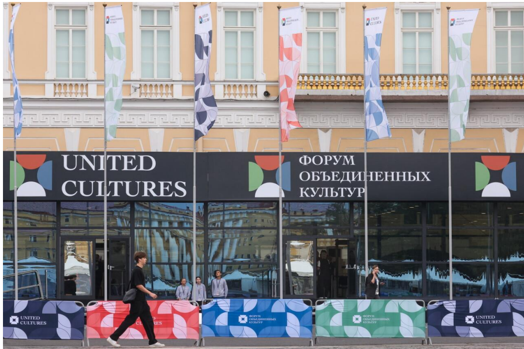
บรรยายการจุดลงทะเบียนหน้าการเข้างาน