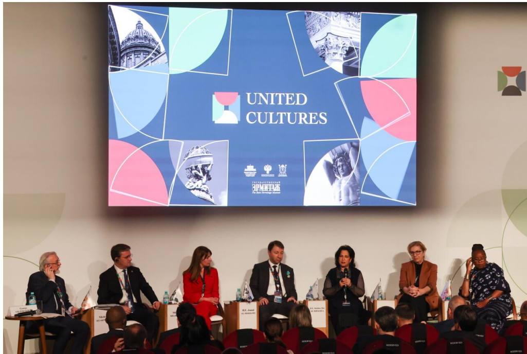
บรรยายภาคการนำเสนอในงานในหัวข้อต่างๆ