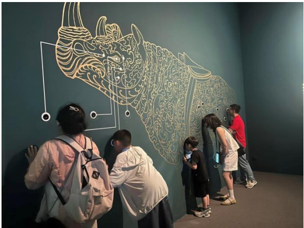
เข้าเยี่ยมชมนิทรรศการพิเศษ “การวิเคราะห์โบราณวัตถุด้วยเทคโนโลยี AI” พิพิธภัณฑ์สถานแห่งชาติจีน