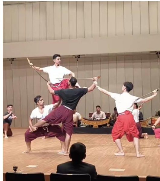
ภาพแผ่นประชาสัมพันธ์การแสดงนาฏศิลป์ไทย ณ ประเทศญี่ปุ่น (ซ้าย) ภาพการซ้อมการแสดงโขนเรื่องรามเกียรติ์ ตอนลักสีดา - ขจรบ (ขวา)