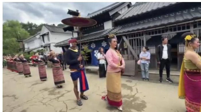
ภาพการแสดงชุดเตี้ยเกี้ยว (ซ้าย) ภาพการแสดงประกอบขบวนฟ้อน รำกลองยาว และกลองยาว ณ เอโดะ วันเดอร์แลนด์ เมืองนิกโกะ (ขวา) ซึ่งภาพทั้งสองเป็นการแสดงร่วมกันระหว่างนาฏศิลป์ใน สำนักการสังคีต กับคณะนาฏศิลป์ญี่ปุ่น