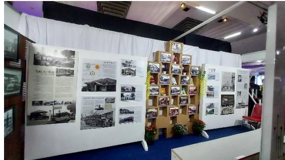
คณะเดินทางไปเยี่ยมชม Central Java Library and Archives Exhibition ที่ Grha Niaga, Sriwedari เมื่อวันที่ ๑๐ มิถุนายน ๒๕๖๗ ภายในพิธีการมีการเผยแพร่ข้อมูลประเภทหนังสือ สิ่งพิมพ์ ภาพถ่ายที่เกี่ยวข้องกับชาวกลาง