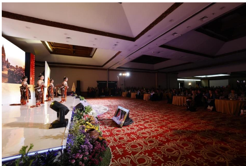
การแสดงเนื่องในพิธีเปิดการสัมมนา เมื่อวันที่ ๑๑ มิถุนายน ๒๕๖๗