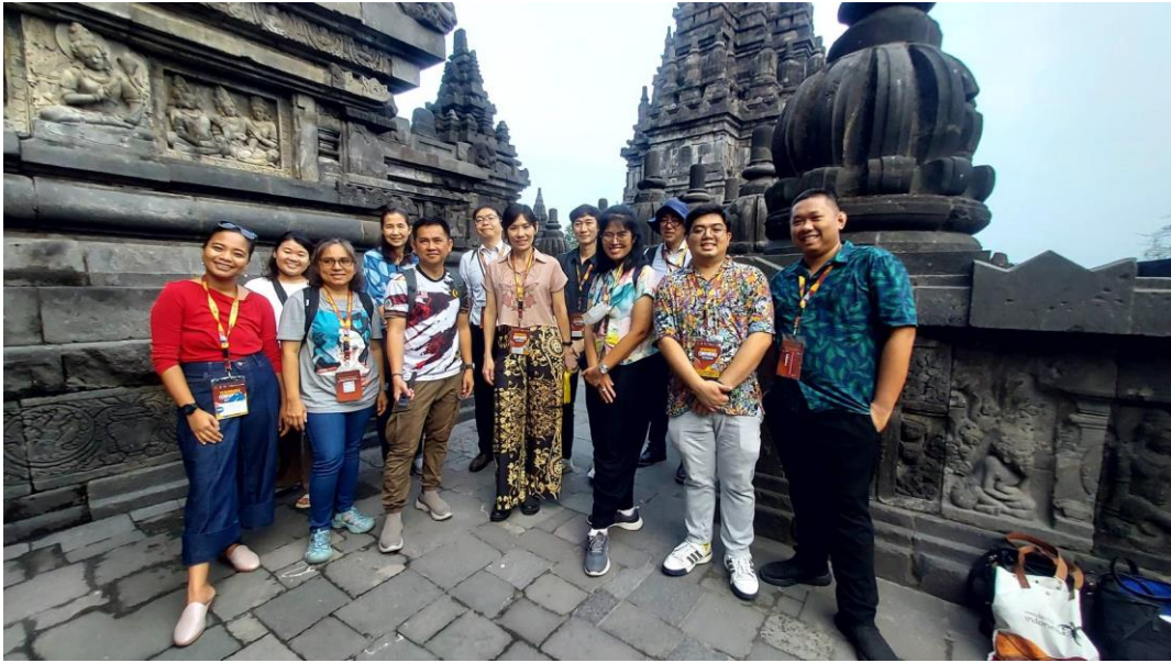
ศึกษาดูงานโบราณสถาน Prambanan Temple เมื่อวันที่ ๑๔ มิถุนายน ๒๕๖๗