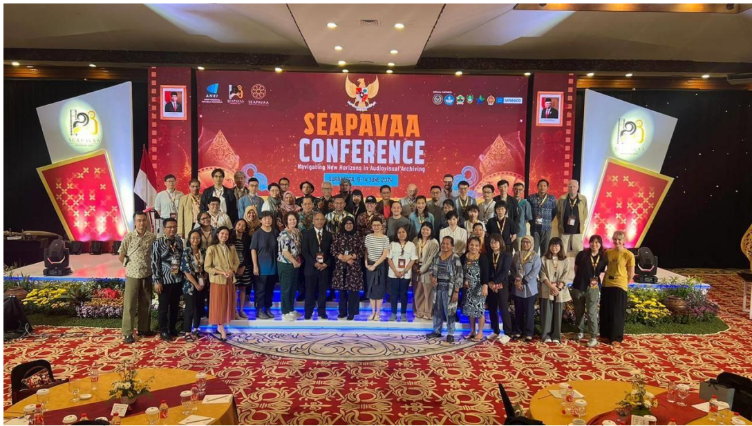
ถ่ายภาพหมู่ที่ระลึก ภายหลังจากจบการประชุม The 28 th SEAPAVAA General Assembly เมื่อวันที่ ๑๓ มิถุนายน ๒๕๖๗