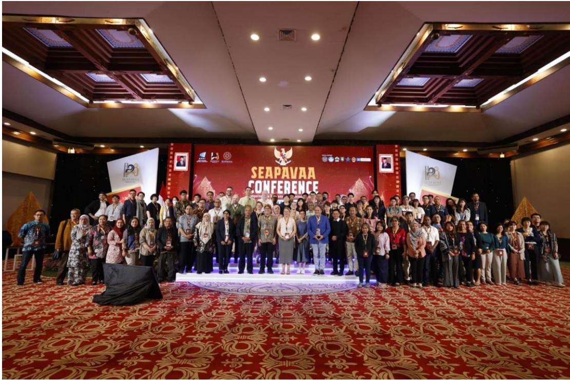
ถ่ายภาพหมู่ที่ระลึก ภายหลังจากจบการสัมมนา วันที่ ๑๒ มิถุนายน ๒๕๖๗