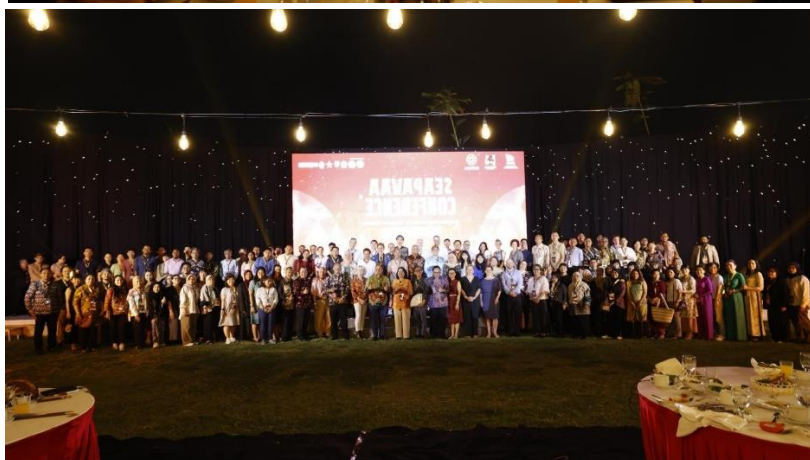
งานเลี้ยงต้อนรับ (Welcome Dinner) ที่ Lokananta Museum