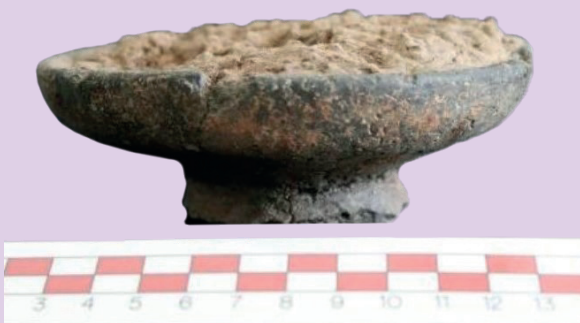
ตัวอย่างโบราณวัตถุจากการฝังศพที่ ๕ หลุมขุดค้นที่ ๓