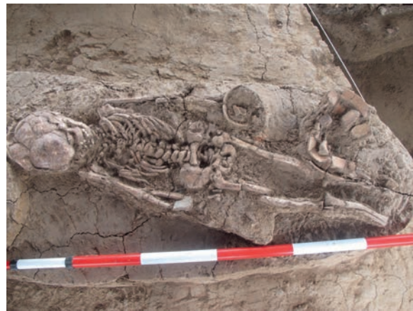
ภาพร่องรอยการฝังศพที่ ๓