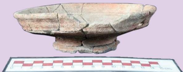
ตัวอย่างโบราณวัตถุจากการฝังศพที่ ๖ หลุมขุดค้นที่ ๓