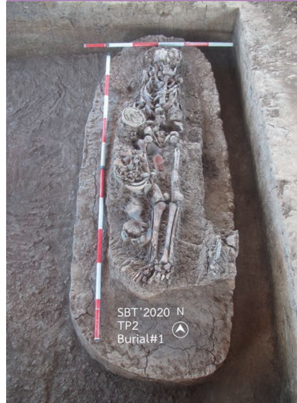
หลักฐานการฝังศพที่ ๑ หลุมขุดค้นที่ ๒