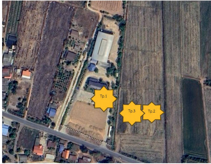
ภาพถ่ายดาวเทียมแสดงตำแหน่งหลุมขุดค้น

ความสำคัญของการค้นพบในครั้งนี้ทำให้สำนักศิลปากรที่ ๓ พระนครศรีอยุธยา ขออนุมัติงบประมาณบูรณะโบราณสถานฉุกเฉินเร่งด่วนจากกรมศิลปากร เพื่อการดำเนินการทางโบราณคดีในลักษณะงานโบราณคดีกู้ภัย ณ แหล่งโบราณคดีสีบัวทอง ตำบลสีบัวทอง อำเภอแสวงหา จังหวัดอ่างทอง