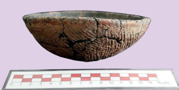
ตัวอย่างโบราณวัตถุจากการฝังศพที่ ๒ หลุมขุดค้นที่ ๓

เป็นที่น่าเสียดายว่าการดำเนินงานในครั้งนี้ เป็นเพียงการกู้แหล่งโบราณคดีที่เสียหายไปเท่านั้น โดยพื้นที่ดำเนินการเป็นพื้นที่ที่ได้รับความเสียหาย จากการขุดหน้าดินขายทำให้ข้อมูลการอยู่อาศัย ขาดหายไป โดยเฉพาะข้อมูลเกี่ยวกับพัฒนาการ ในยุคสำริดที่ต่อเนื่องมาถึงสมัยประวัติศาสตร์ จึง สมควรที่จะได้ดำเนินการต่อไปในพื้นที่ที่ชั้นทับถม ยังไม่เสียหายเพื่อจะได้ข้อมูลที่สมบูรณ์เกี่ยวกับแหล่ง โบราณคดี อย่างไรก็ตาม จากการดำเนินการในครั้งนี้ ช่วยให้เปิดมุมมองใหม่เกี่ยวกับแหล่งโบราณคดีสมัย ก่อนประวัติศาสตร์ในพื้นที่ภาคกลางตอนล่างและ ตั้งคำถามถึงเหตุการณ์ที่เกิดขึ้นในช่วง ๓,๐๐๐ ปี ที่ผ่านมา ว่าอะไรเป็นสาเหตุที่แท้จริงต่อการเลือก พื้นที่ตั้งถิ่นฐานเมื่อสังคมมนุษย์มีความซับซ้อนในช่วง ที่เกิดวัฒนธรรมทวารวดี