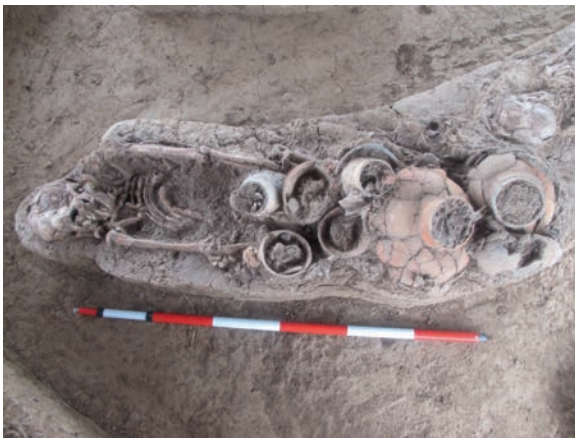
ภาพร่องรอยการฝังศพที่ ๒

ตารางที่ ๑ ผลการศึกษาวิเคราะห์โครงกระดูกมนุษย์แหล่งโบราณคดีสีบัวทอง