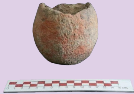
ตัวอย่างโบราณวัตถุจากการฝังศพที่ ๑ หลุมขุดค้นที่ ๓