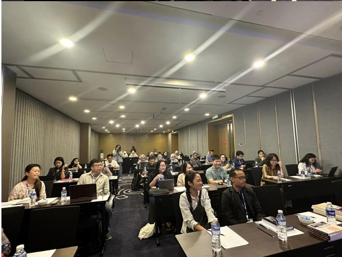
การฝึกอบรมภาคทฤษฎี