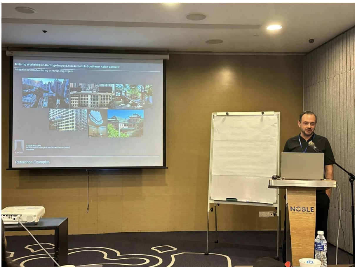
การบรรยายภาคทฤษฎี