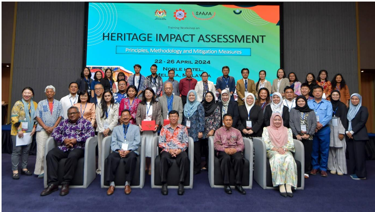
พิธีเปิดการฝึกอบรม