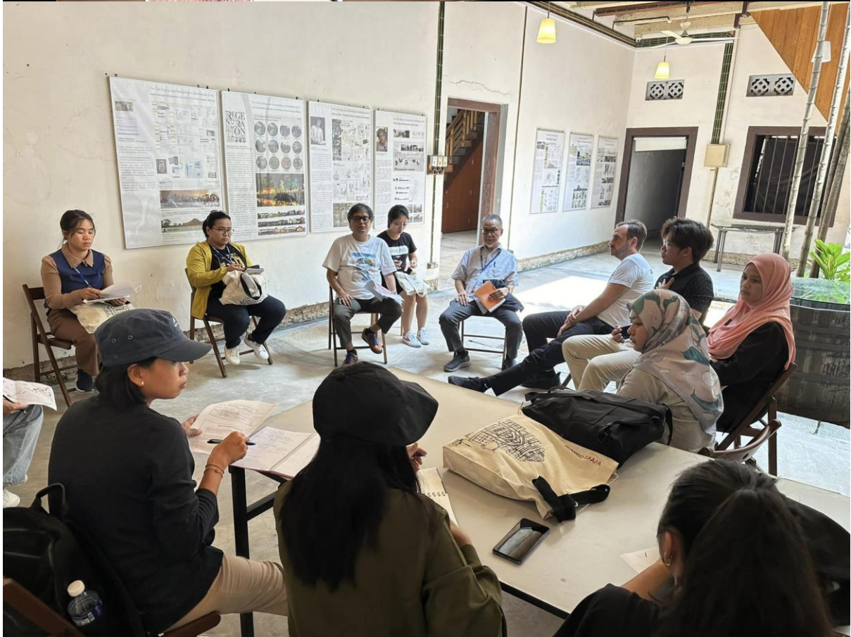
กิจกรรมกลุ่มย่อย