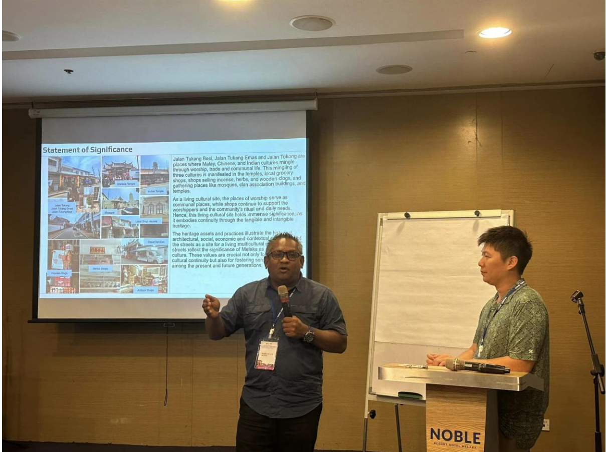
การนำเสนอผลงาน อภิปราย และแลกเปลี่ยนประสบการณ์จากกรณีศึกษา