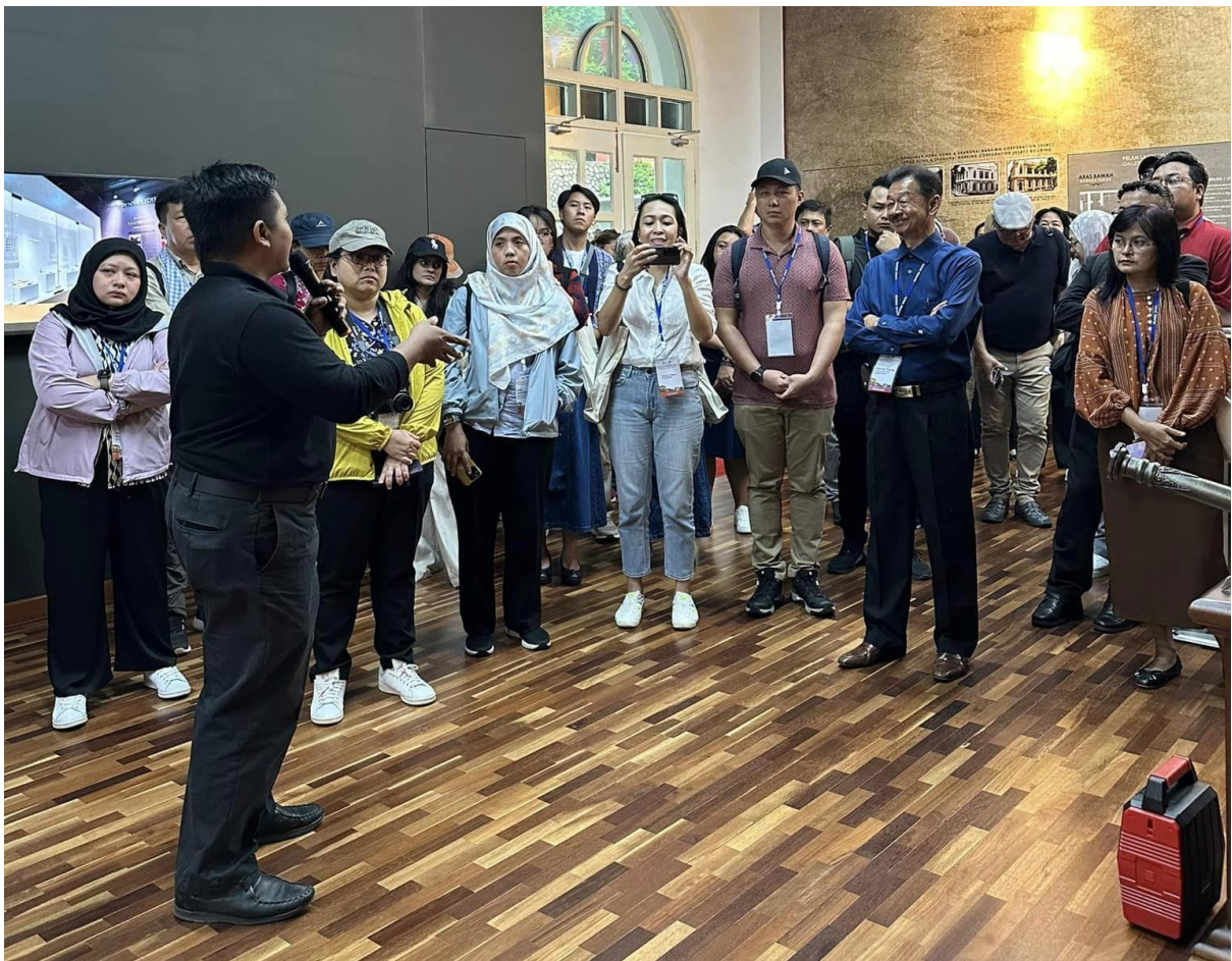
กิจกรรมสำรวจภาคสนาม