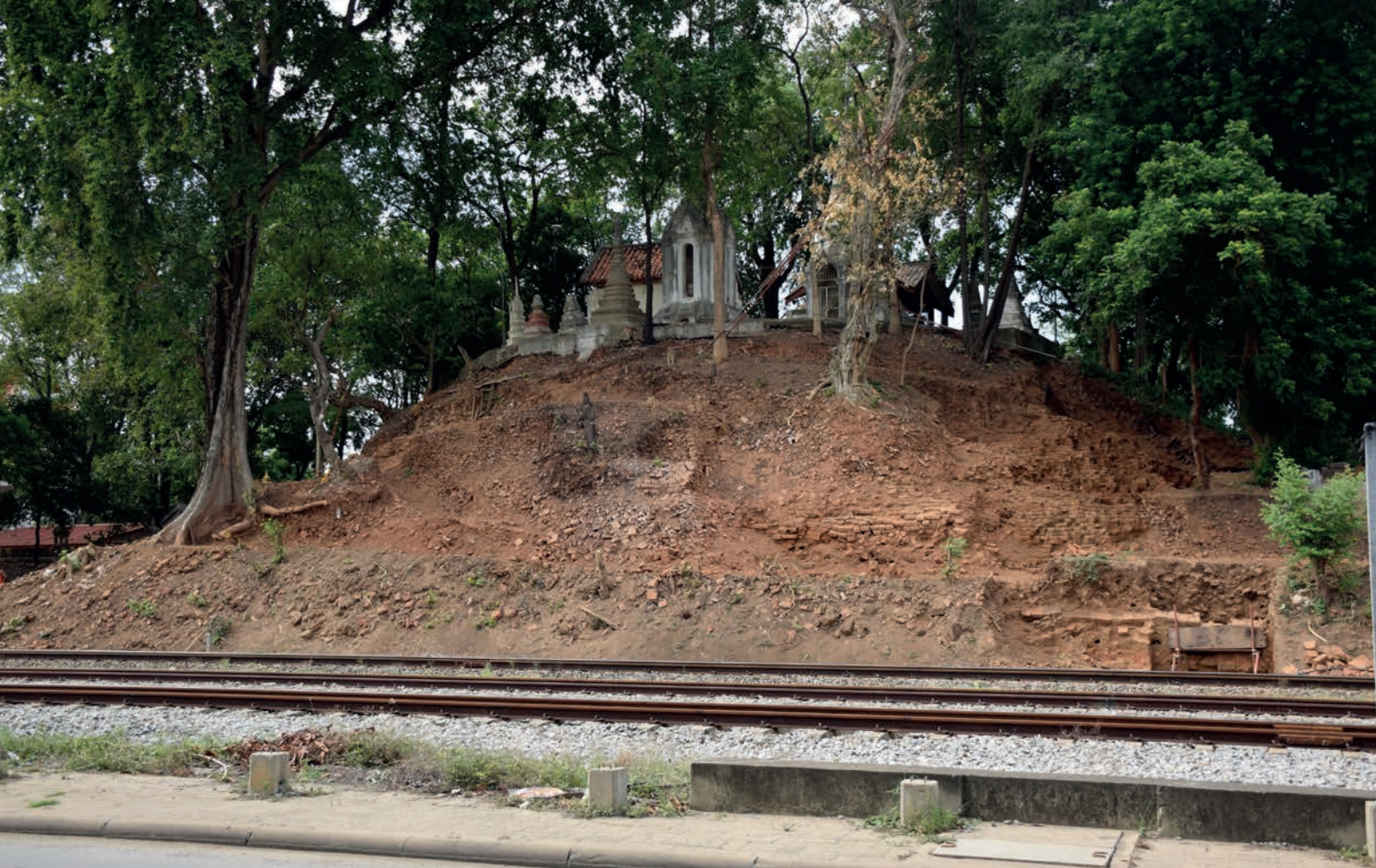
เนินสถูปสมัยทวารวดีวัดพระงาม

ต่อมาในระหว่าง พ.ศ. ๒๕๖๒-๒๕๖๓ สำนักศิลปากรที่ ๒ สุพรรณบุรี ได้ขุดค้นศึกษาโบราณสถานในจังหวัดนครปฐม คือ วัดพระงาม และโบราณสถานโคกแจรง อำเภอเมืองนครปฐม ซึ่งนำไปสู่การค้นพบจารึกสมัยทวารวดีหลักใหม่อีก ๒ หลัก ดังนี้