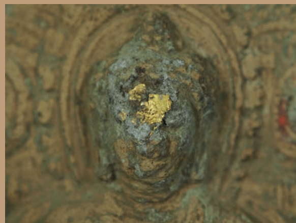
ทองคำเปลวบางส่วนที่พบภายในภาชนะบรรจุพระพิมพ์ และทองคำเปลวที่ยังติดอยู่กับพระพิมพ์ดินเผาบางองค์