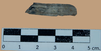
ก้อนแร่ควอทซ์