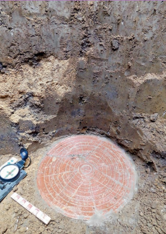
โบราณสถานโคกแจง ด้านทิศใต้ ภายหลังการขุดศึกษาทางโบราณคดี และลักษณะจารึกที่พบ ภายในหลุมขุดค้น