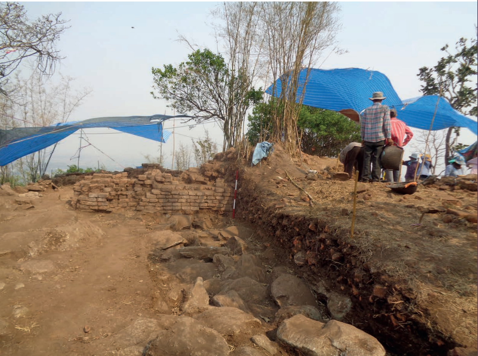
โบราณสถานพูหางนาหมายเลข ๒ ระหว่างขุดแต่ง

นอกจากโครงสร้างศาสนสถานที่พบแล้ว ในการ ขุดค้นทางโบราณคดีครั้งนี้ยังพบโบราณวัตถุสำคัญคือ ภาชนะดินเผาจำนวน ๓ ใบ ซึ่งบรรจุพระพิมพ์ดินเผาและ เครื่องมงคลต่าง ๆ ฝังอยู่รอบองค์สถูปเพื่อถวายเป็น พุทธบูชา พระพิมพ์ดินเผาทั้งหมดที่พบ (จากภาชนะ ทั้ง ๓ ใบ) จำนวน ๑๓๙ องค์ เป็นพระพิมพ์ศิลปะ ทวารวดีที่ได้รับรูปแบบจากศิลปะอินเดียสมัยปาละ แสดงปางสมาธิ ประทับนั่งขัดสมาธิราบบนบัลลังก์ อุษณีษะสูง มีประภามณฑลเป็นวงโค้งรอบพระเศียร ขอบประภามณฑลเป็นเปลวเพลิง พระพักตร์รูปไข่