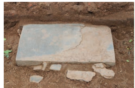
จารึกวัดพระงาม ขณะขุดค้นพบบริเวณฐานเจดีย์วัดพระงาม

วัดพระงาม ตั้งอยู่นอกเมืองโบราณนครปฐมทางด้านทิศตะวันตก มีสิ่งสำคัญคือสถูปสมัยทวารวดีขนาดใหญ่ ฝังรูปสี่เหลี่ยมจัตุรัส ขนาดความกว้างด้านละ ๔๑.๕๐ เมตร จารึกวัดพระงามพบจากการขุดศึกษาทางโบราณคดีบริเวณด้านทิศเหนือของสถูปวัดพระงาม เมื่อวันที่ ๒ ตุลาคม พ.ศ. ๒๕๖๒ โดยผู้เชี่ยวชาญด้านภาษาโบราณกรมศิลปากรได้ทำการอ่านและแปลความในเบื้องต้นได้ว่า เป็นจารึกอักษรปัลลวะ ภาษาสันสกฤตที่งดงามมากที่สุดเท่าที่เคยพบในประเทศไทย กำหนดอายุอยู่ในราวพุทธศตวรรษที่ ๑๒ เนื้อความโดยสรุปเป็นการสรรเสริญพระราชาผู้มีความสามารถ ทรงได้ชัยชนะในสงคราม นำความเจริญมาสู่วงศ์ตระกูลและบ้านเมือง ทั้งนี้ นอกจากจารึกสำคัญแล้ว ยังได้พบประติมากรรมรูปยักษ์ดินเผาที่มีความงดงามอีกด้วย