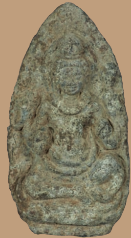
รูปเคารพ (พระโพธิสัตว์?) เนื้อตะกั่ว จากภาชนะดินเผาใบที่ ๑

นอกจากพระพิมพ์ดินเผาแล้ว ยังพบพระพุทธรูปสำริด รูปเคารพ (พระโพธิสัตว์) เนื้อตะกั่ว และโบราณวัตถุอื่น ๆ ได้แก่ เหรียญเงิน หอยเบี้ย ก้อนแร่ควอทซ์ และทองคำเปลว ผังร่วมกันภายในภาชนะแต่ละใบ ซึ่งสิ่งเหล่านี้คงจะมีสถานะเป็นเครื่องมงคลเช่นกัน