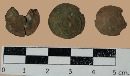
เหรียญเงินผสมทองแดง