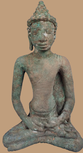
พระพุทธรูปสำริด จากภาชนะดินเผาใบที่ ๑