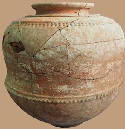
ภาชนะดินเผาบรรจุพระพิมพ์ดินเผาใบที่ ๑