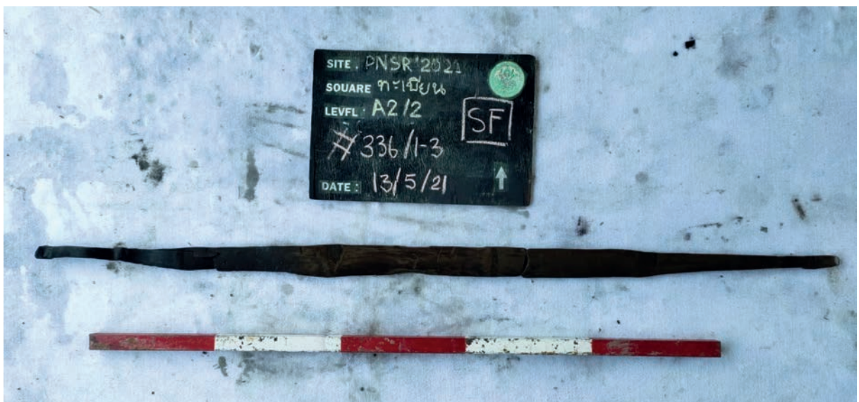
โบราณวัตถุประเภทไม้ รูปทรงคล้ายไม้คานหาบ

• ไม้คานหาบ ทำจากไม้ไผ่ ลักษณะเป็นไม้ยาว ทรงแคบ ตรงกลางมีความกว้างมากที่สุด ส่วนปลายทั้งสองด้านเหลาให้เรียวเล็กลง ก่อนถึงส่วนปลายไม้ มีปุ่มนูนขึ้นมา ด้านนอกผิวเรียบ ด้านในเว้าเล็กน้อย สันนิษฐานว่าเป็นอุปกรณ์สำหรับการเคลื่อนย้ายสิ่งของ คล้ายกับไม้คานหาบในปัจจุบัน