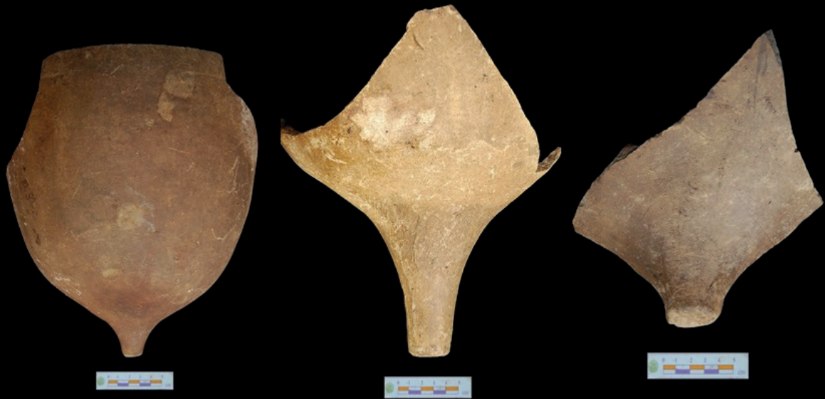
ชิ้นส่วนภาชนะดินเผาแบบ "ตอร์ปิโด" พบจากการดำเนินงานระหว่าง พ.ศ. ๒๕๕๖ - ๒๕๕๘

ทะเลเมดิเตอร์เรเนียน มีชื่อเรียกเฉพาะว่าตอร์ปิโด เนื่องจากมีรูปร่างเรียวยาว ยังไม่ทราบแหล่งผลิตหรือหน้าที่การใช้งานที่ชัดเจน ซึ่งไหตอร์ปิโดมักเอาไว้ใส่ของเหลวเพื่อการขนส่งในปริมาณมาก ส่วนใหญ่มีการค้นพบในบริเวณมหาสมุทรอินเดีย ชิ้นส่วนภาชนะดินเผาแบบนี้ที่พบจากการขุดค้นส่วนใหญ่จะมีคราบน้ำมันดินติดอยู่ผิวด้านในภาชนะ จากการศึกษาพบว่า เป็นน้ำมันดิน (Bitumen) ลักษณะพิเศษของไหตอร์ปิโดที่พบจากแหล่งโบราณคดี คือ การเจาะรูขนาดเล็กบริเวณขอบปาก และร้อยเชือก ผูกปม สันนิษฐานว่าใช้พันกับฝาปิดภาชนะ การเจาะรูนี้อาจจะเป็นการนำภาชนะกลับมาใช้ซ้ำ นอกจากนี้ยังพบการถักเชือกสีดำล้อมรอบส่วนก้นและลำตัวภาชนะ สันนิษฐานว่าใช้ห้อย หิ้ว หรือพันกับระวางเรือ เพื่อความแข็งแรงระหว่างการเดินทาง นักวิชาการ