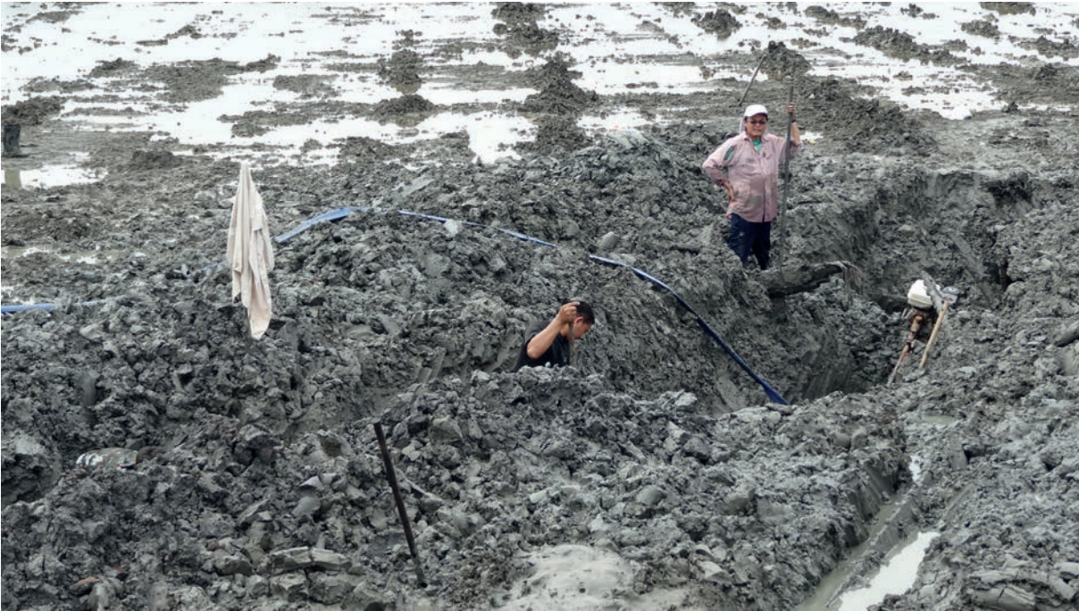
การพบซากเรือโบราณจมอยู่ในดินโคลน เมื่อเดือนกันยายน พ.ศ. ๒๕๕๖