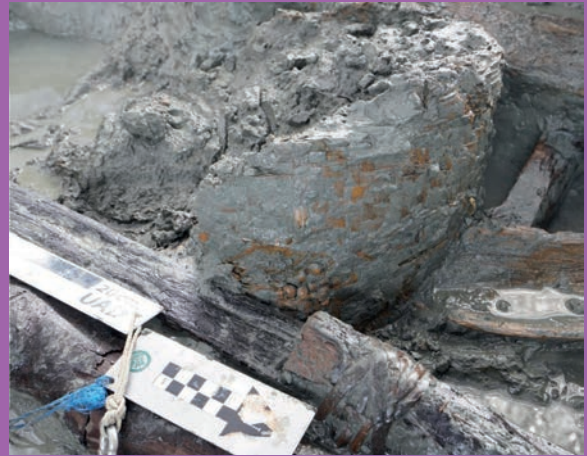
ตะกร้าจักสานที่พบภายในตัวเรือ

๓.๕) เครื่องจักสาน พบชิ้นส่วนเครื่องจักสานหลายรูปแบบที่สำคัญ ได้แก่ ใน Area 1 บริเวณกลางลำเรือพบตะกร้าไม้ไผ่สาน ขนาดเส้นผ่านศูนย์กลาง ๓๘ เซนติเมตร สูงประมาณ ๓๐ - ๔๐ เซนติเมตร ปากตะกร้าเบาะเสียหายเล็กน้อย ภายในตะกร้าบรรจุเมล็ดประคำไก่อจำนวนมาก นอกจากนี้ยังพบถุงตาข่ายเย็บด้วยเส้นใยผ้า สันนิษฐานว่าเป็นถุงบรรจุเมล็ดพืชอีกชิ้นหนึ่ง ส่วนกันตะกร้าพบกรรมช้างขนาดใหญ่ ๑ ท่อน ส่วนในพื้นที่ Area 2 พบชิ้นส่วนตะกร้าจักสานหลายชิ้น ส่วนใหญ่ใช้ไม้ไผ่เป็นวัสดุหลัก