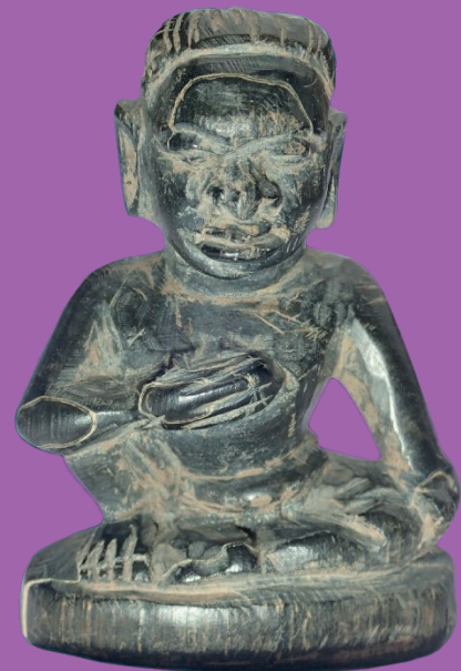
ตุ๊กตารูปบุคคล ทำจากเขาสัตว์ สันนิษฐานว่าพบภายในตัวเรือ

๓.๗) กระจูดสัตว์ - เขาสัตว์ ใน Area 1 พบตุ๊กตารูปบุคคลทำจากเขาสัตว์ สูง ๔.๕ เซนติเมตร กว้าง ๓ เซนติเมตร ลักษณะไว้ผมยาวเกล้ามวยไว้ที่ท้ายทอย ปลอยชายผมยาวประตันคอ คล้ายนักบวช ใบหน้ากลม จมูกใหญ่ ริมฝีปากหนาอยู่ในอิริยาบถนั่งท่ามหาราชลีลา (นั่งชันเข่าขาขึ้น เท้าข้างอพับไปสอดไว้ใต้โคนขาขวา) มือขวาทาบหน้าอก นิ้วมือเรียงชิดติดกัน มือซ้ายเท้าหัวเข่าข้างซ้าย นิ้วมือหันไปด้านหลัง แต่งกายด้วยผ้าลักษณะคล้ายผ้าเตี่ยว พบบริเวณระหว่างแนววงเรือโดยอยู่ถัดมาห่างจากขอบกราบเรือประมาณ ๑ เมตร เบื้องต้นสันนิษฐานว่าอาจเป็นรูปเคารพที่ลูกเรือนำมาเพื่อเป็นเครื่องรางหรือสิ่งยึดเหนี่ยวจิตใจ อันบ่งบอกเป็นนัยถึงความเชื่อของชาวเรือที่มีอยู่ในเรือลำนี้ และพบเขาสัตว์มีการเจาะรูบริเวณโคนเขา สันนิษฐานว่าเป็นเขาสัตว์ตระกูลกวาง และพบกรรมช้าง จำนวน ๑ ชิ้น บรรจุอยู่ในตะกร้าจักสาน พบปะปนอยู่กับเมล็ดพืช