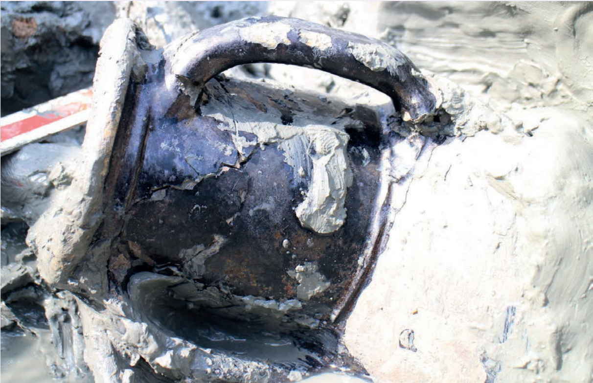
ชิ้นส่วนภาชนะดินเผาเคลือบสีเขียวแกมฟ้า แต่ปัจจุบันน้ำเคลือบเปลี่ยนเป็นสีดำ