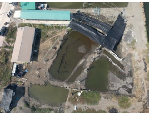
สภาพโดยรวมแหล่งเรือโบราณพนมสุรินทร์ ก่อนการขุดค้นทางโบราณคดีใน พ.ศ. ๒๕๖๔