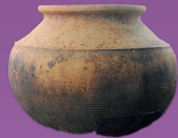
ภาชนะดินเผาประเภทหม้อก้นกลม มีสันที่ไหล่ภาชนะ ด้านนอกมี คราบเขม่าจากการใช้งาน