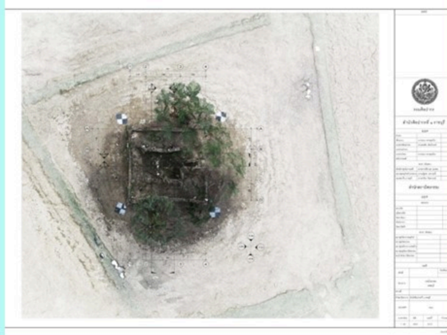
ภาพถ่ายทางอากาศ แสดง ตำแหน่งที่ตั้งโบราณสถาน บ้านท่าคอย