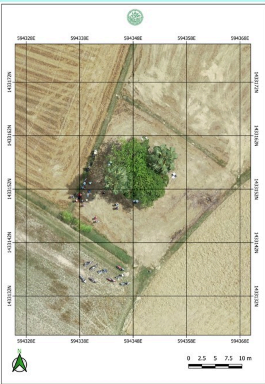
ภาพถ่ายทางอากาศ แสดงตำแหน่งที่ตั้งโบราณสถานบ้านท่าคอย